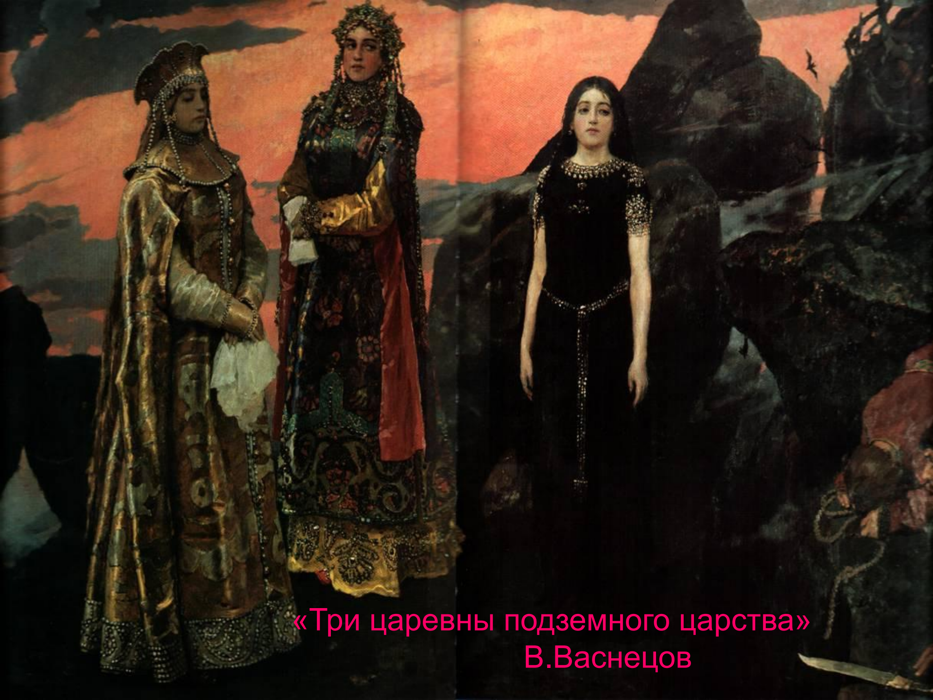
«Три царевны подземного царства» В.Васнецов