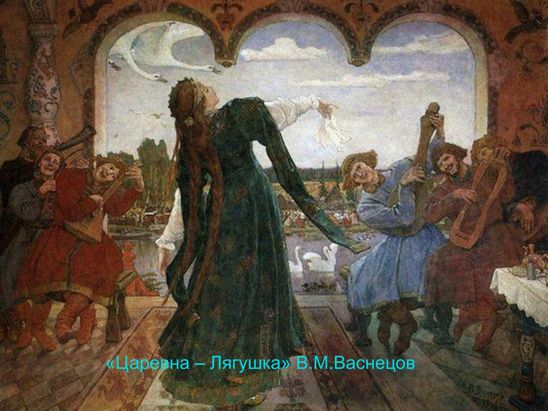
«Царевна – Лягушка» В.М.Васнецов