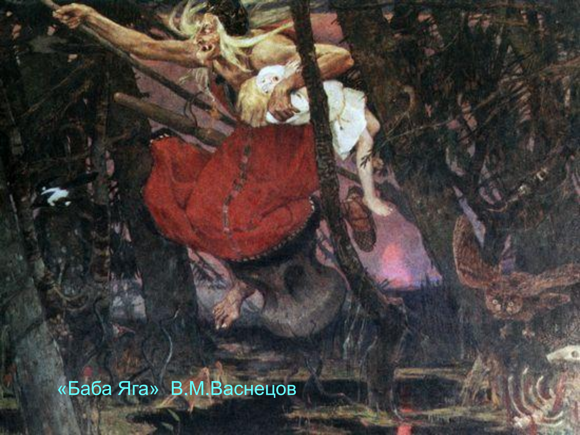
«Баба Яга» В.М.Васнецов