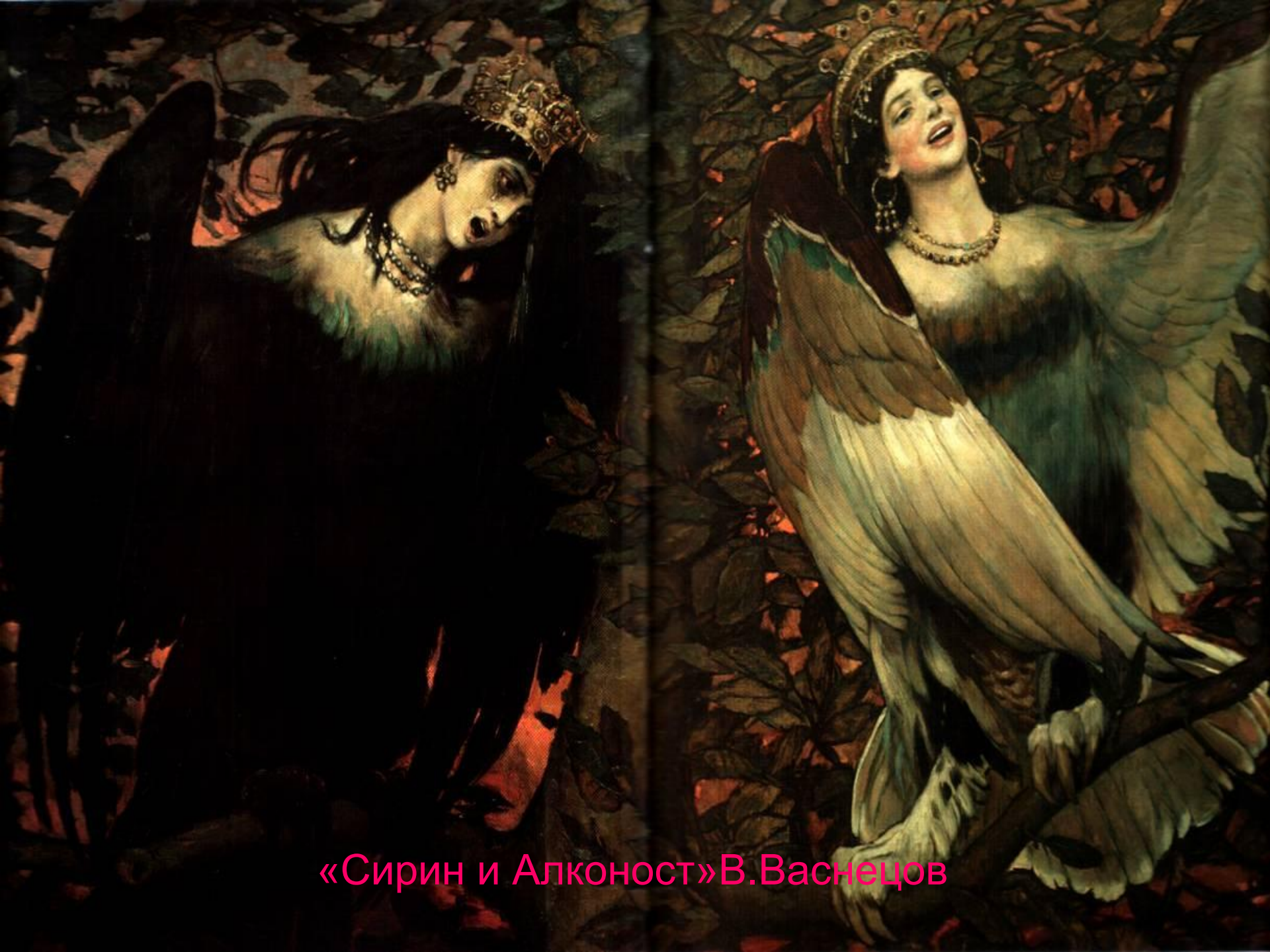
«Сирин и Алконост» В. Васнецов