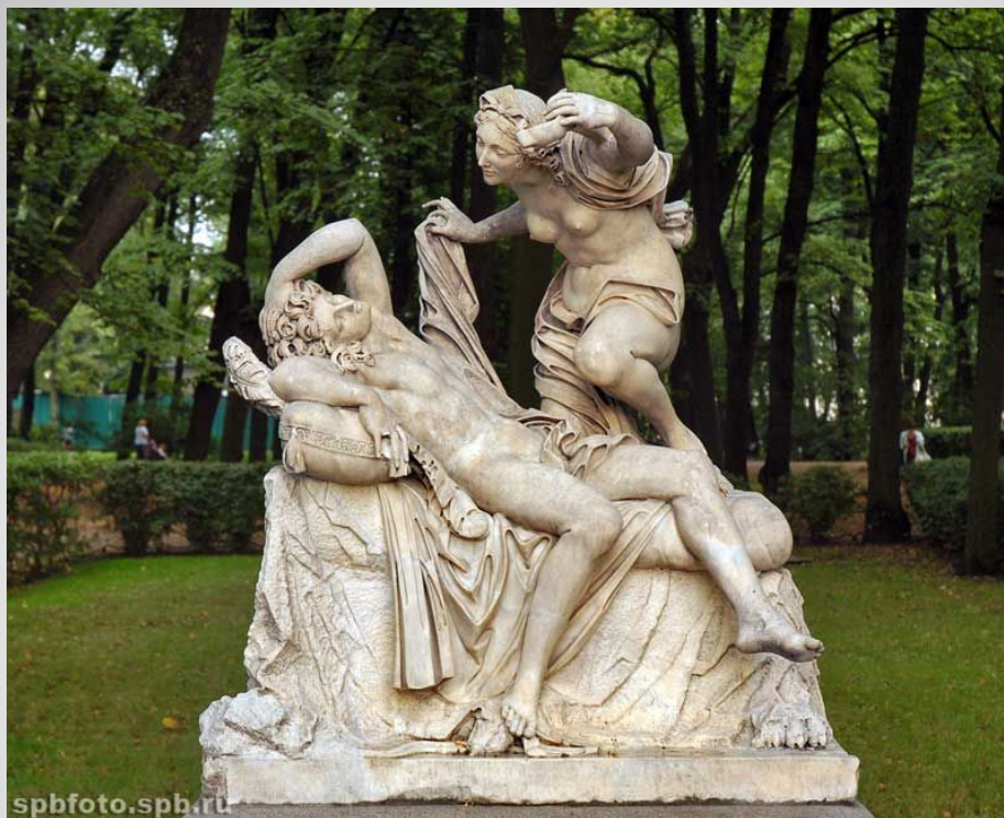
"Амур и психея". XVII в. Неизвестный итальянский скульптор