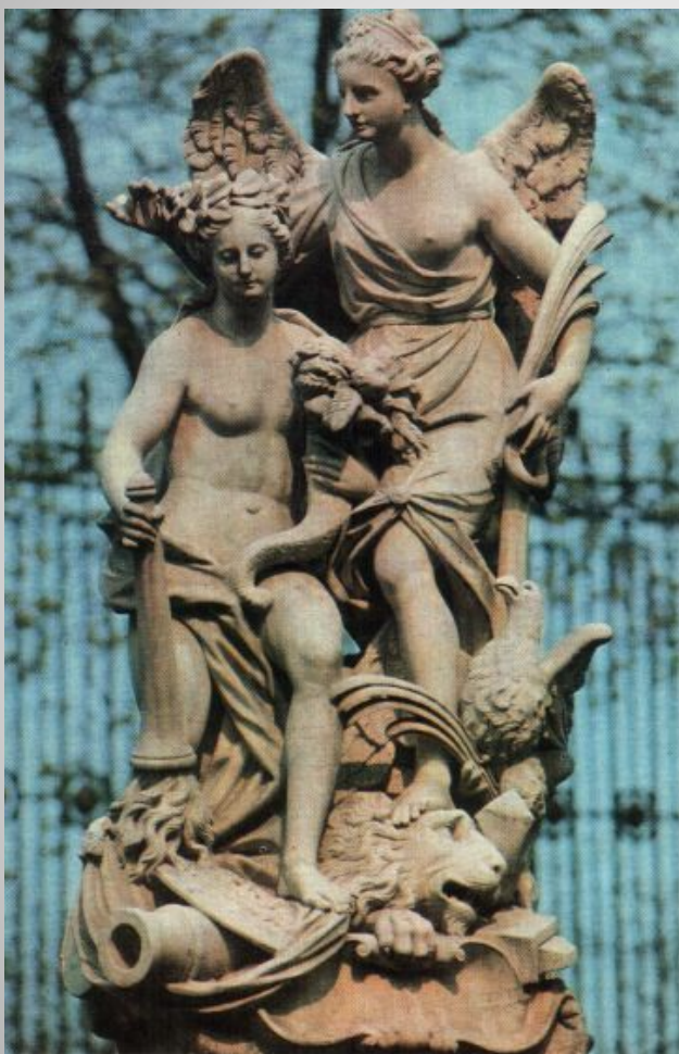
Скульптурная группа "Мир и изобилие". 1722 г. Скульптор П. Баратта