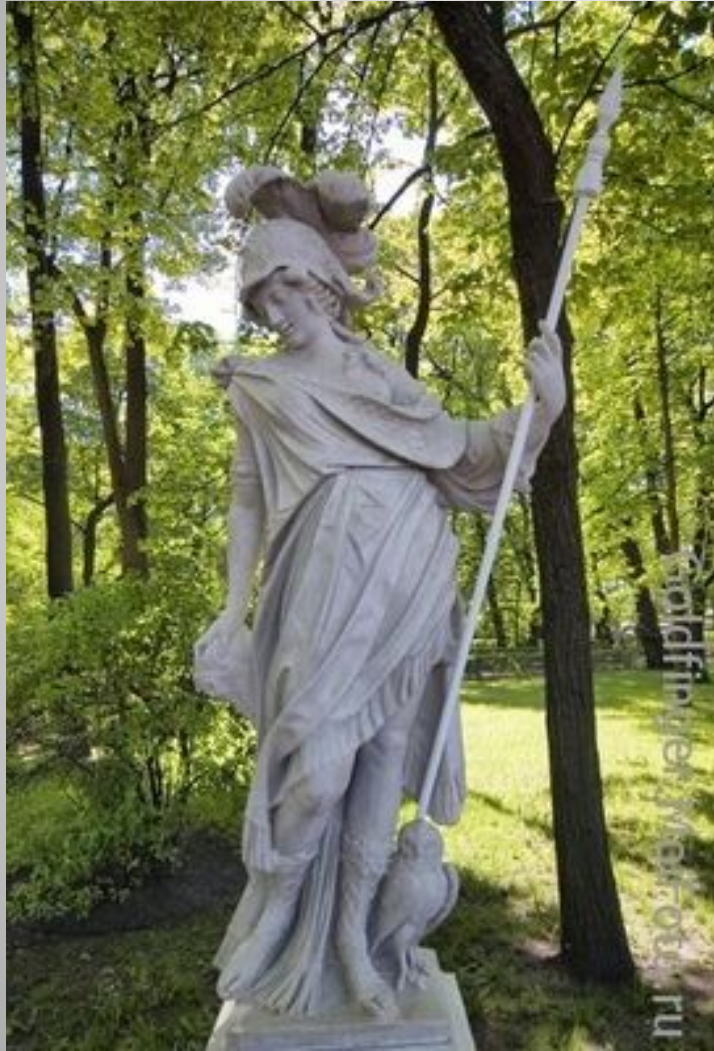
Статуя "Миневра". XVIII в. Неизвестный итальянский скульптор