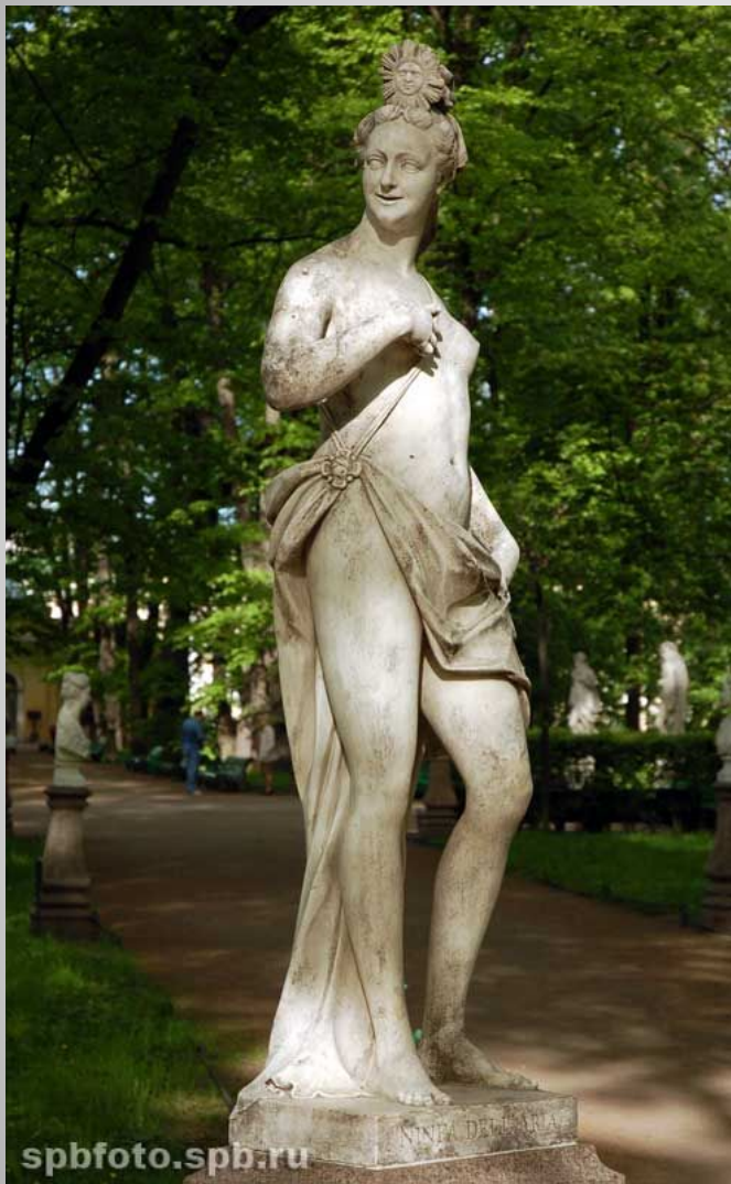
Статуя "Нимфа воздуха". XVIII в. Скульпторы Д. и П. Гропелли.