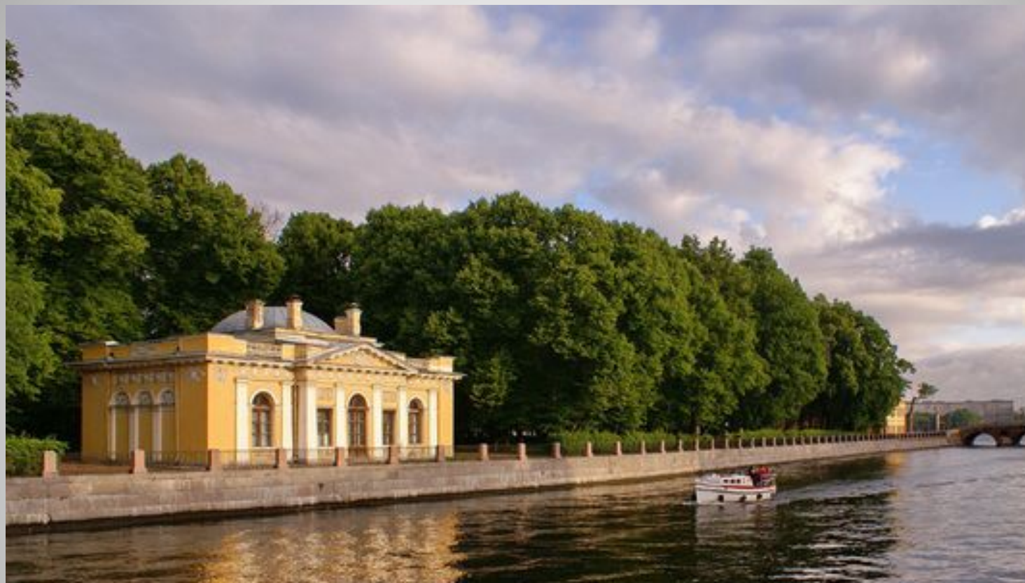
Павильон "Кофейный домик". 1826 г. Архитектор К. Росси