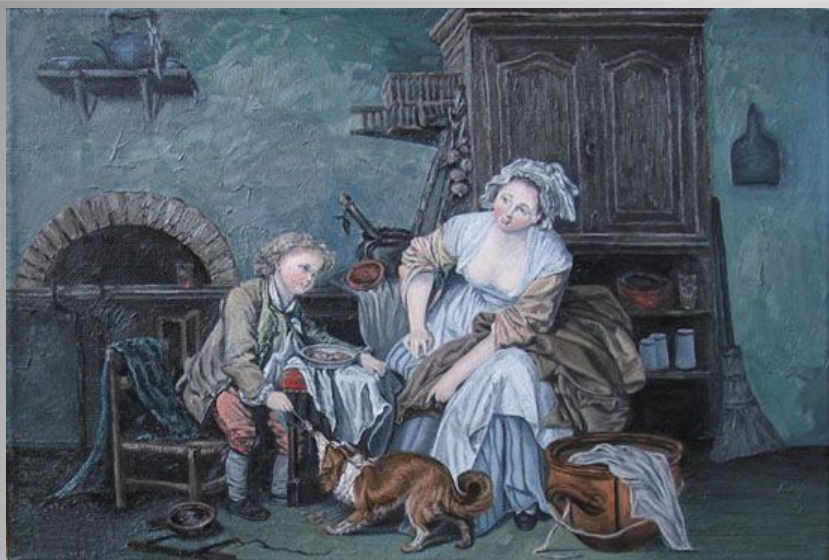
«Балованное дитя, или Плоды дурного воспитания»

«Паралитик, за которым ухаживают его дети, или Плоды хорошего воспитания»»,