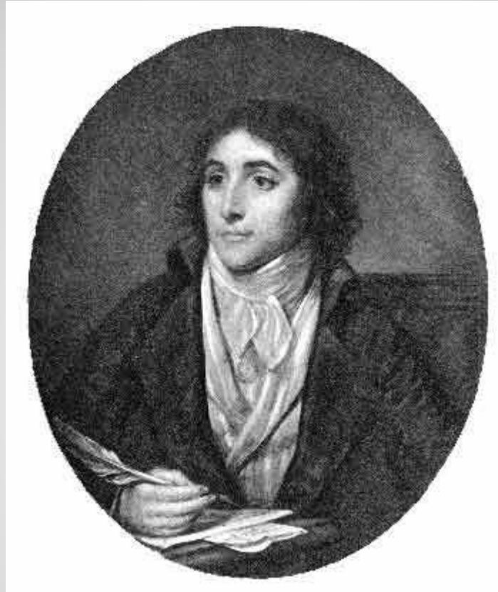
Жан Батист Грёз (1725-1805)