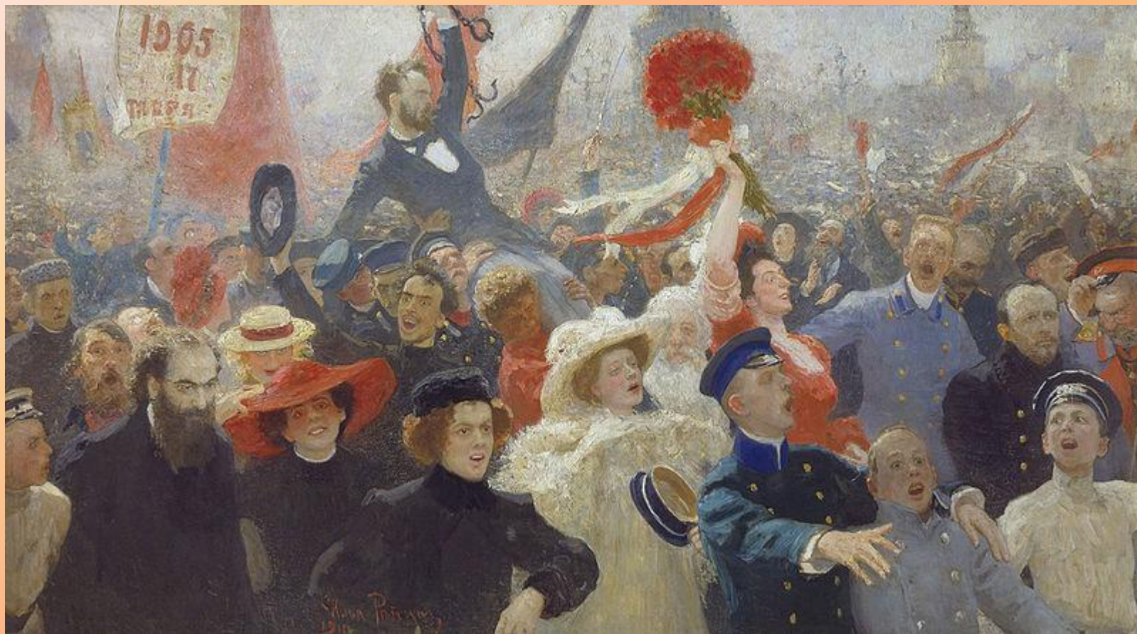
«Манифестация 17 октября 1905 года», 1906-1911