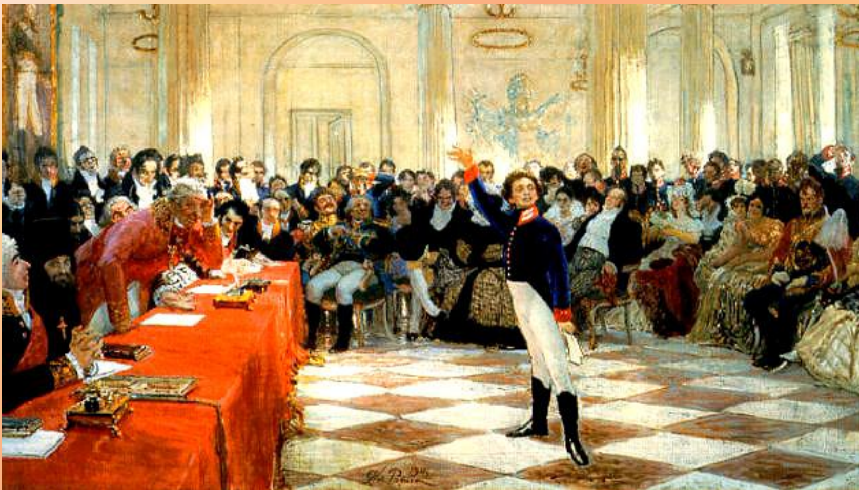
«Александр Сергеевич Пушкин читает свою поэму перед Гавриилом Державиным на лицейском экзамене в Царском Селе 8 января