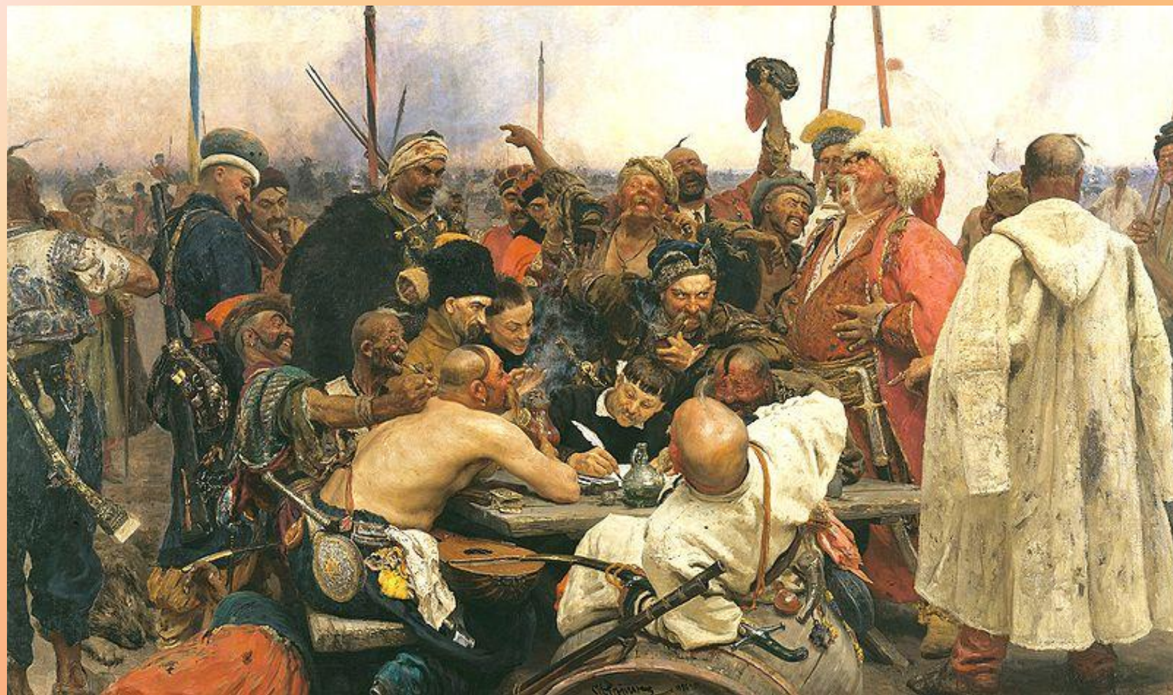
«Запорожцы», 1880—1891, Государственный Русский музей, Санкт-Петербург