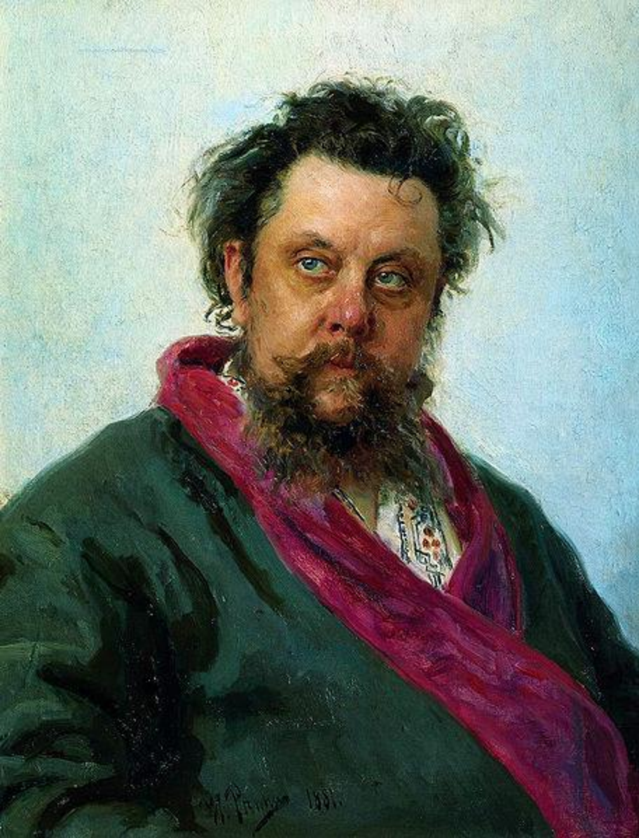
«Портрет композитора Модеста Петровича Мусоргского»