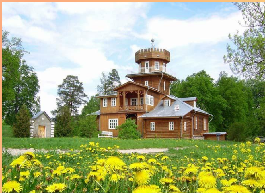
Музей-усадьба И.Е.Репина "Здравнево". Фото В.А.Шишанова, 2006.