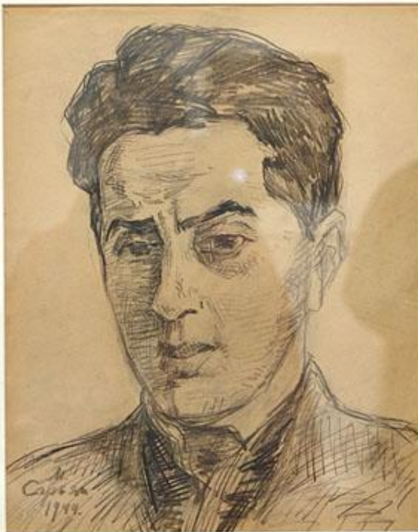
М.С. Сарьян. Портрет Арама Хачатуряна. 1944 год.