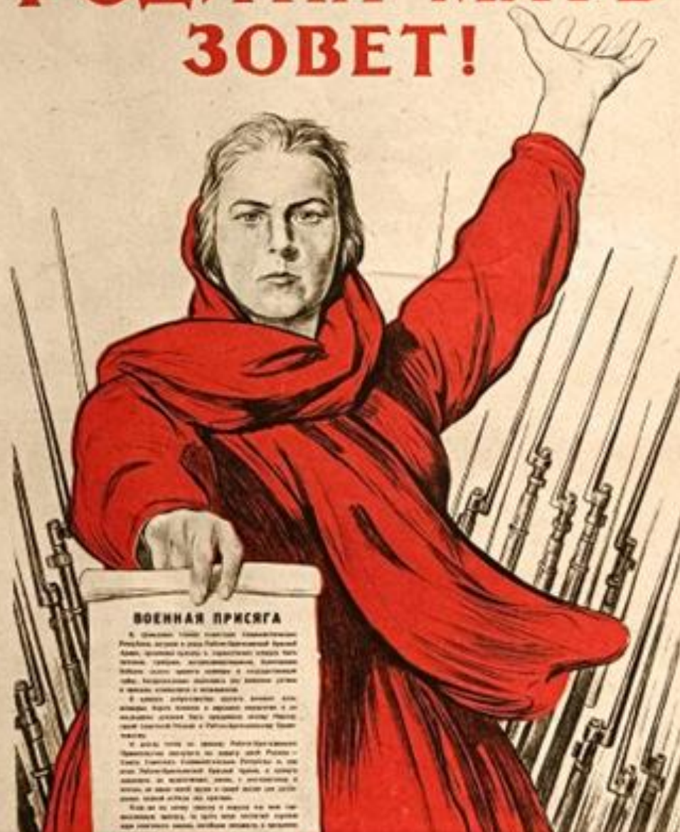
М.И. Тоидзе. "Родина-мать зовет"