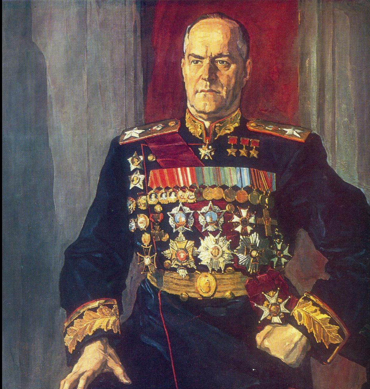
Портрет маршала Г.К. Жукова работы П.Д. Корина