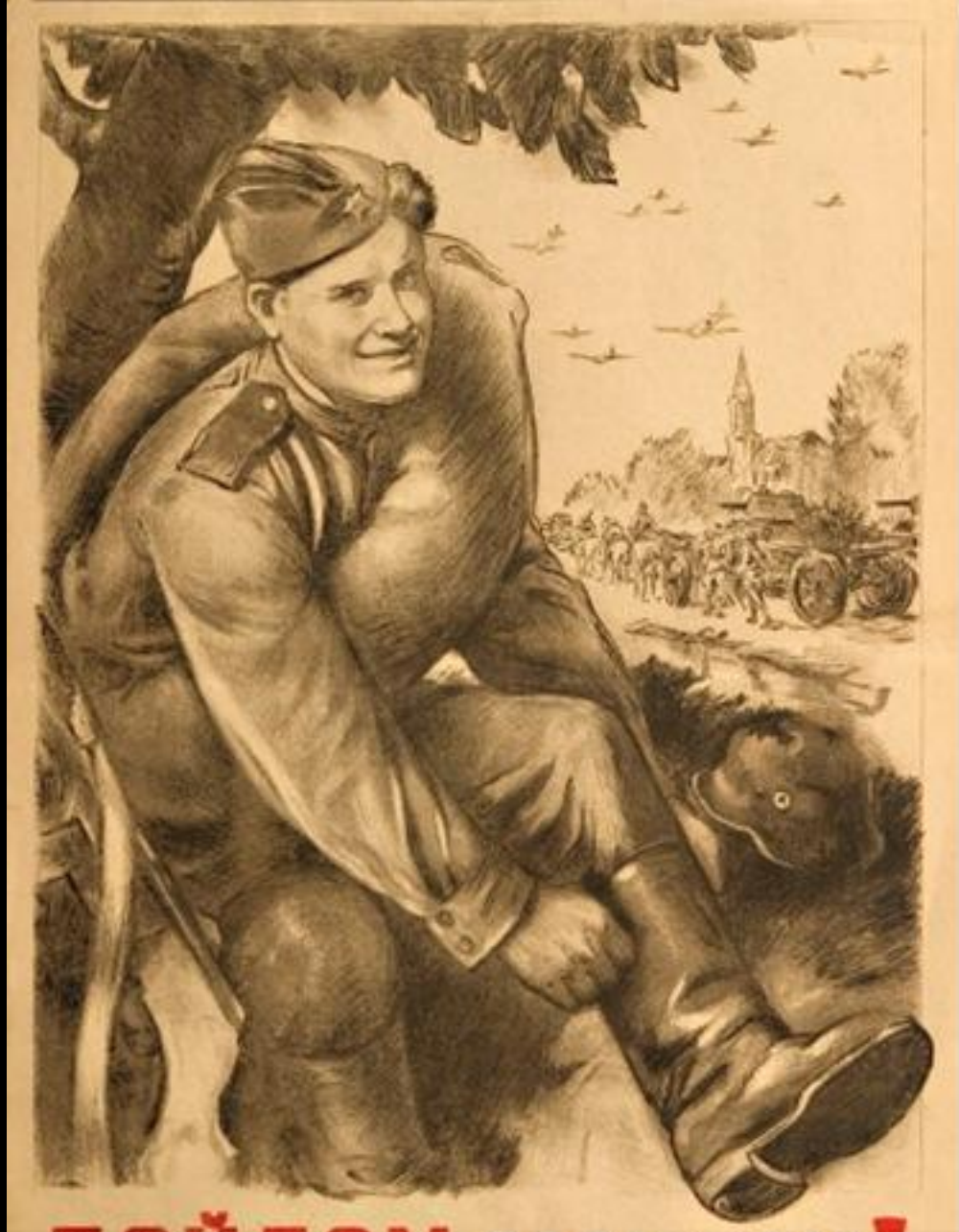
Л.А. Голованов. "Дойдем до Берлина!"