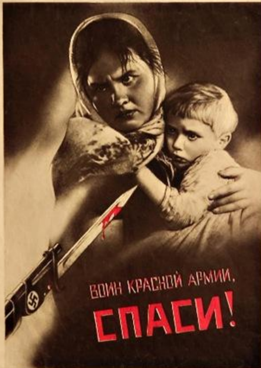
В.Г. Корецкий. "Воин Красной Армии, спаси!"