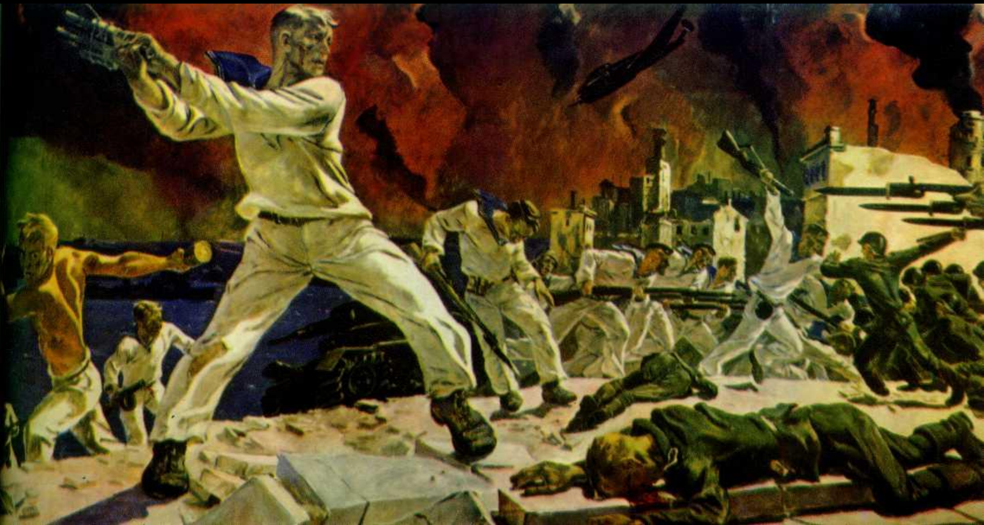
А.А. Дейнека. Оборона Севастополя" (1942)