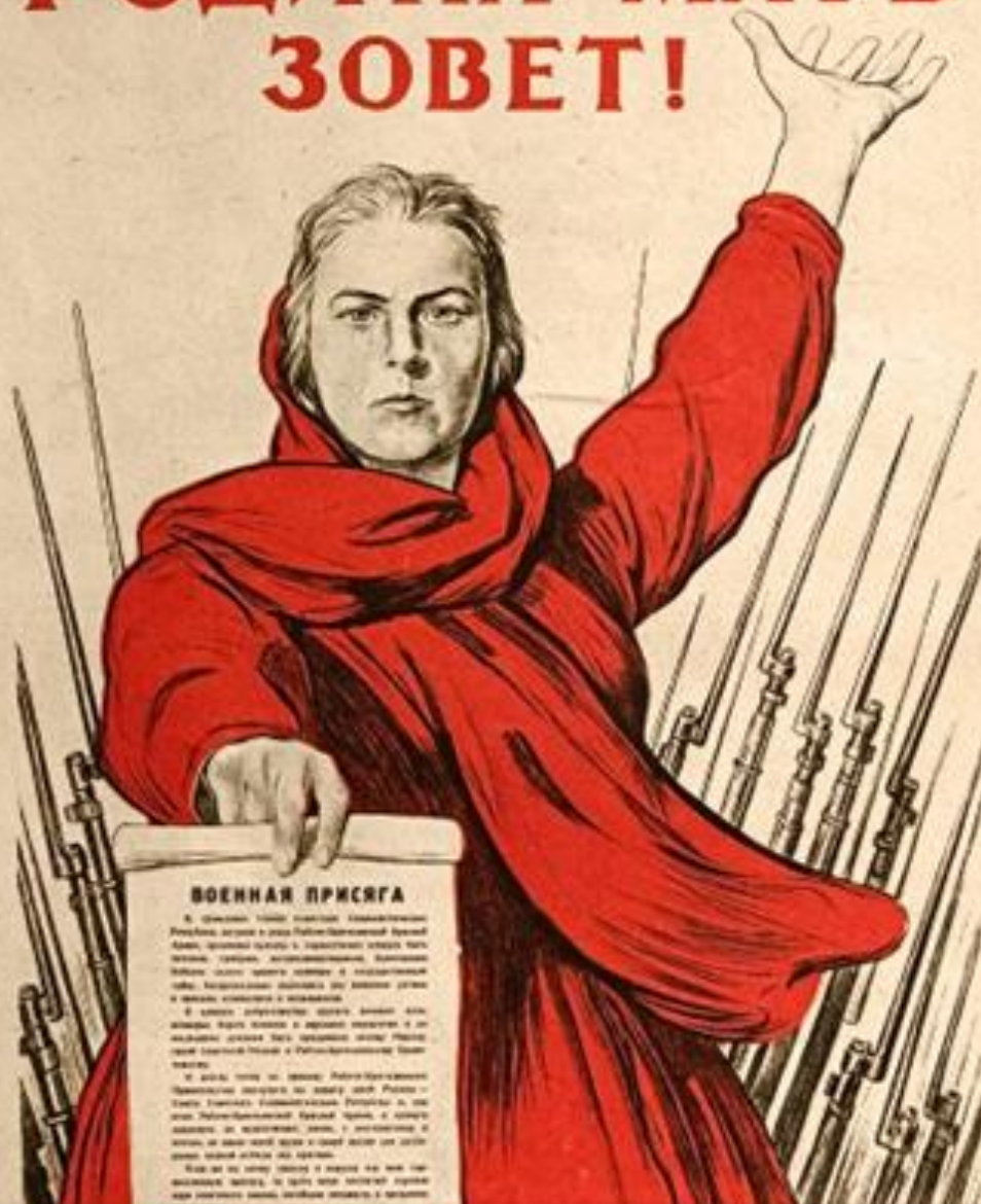
М.И. Тоидзе. "Родина-мать зовет"