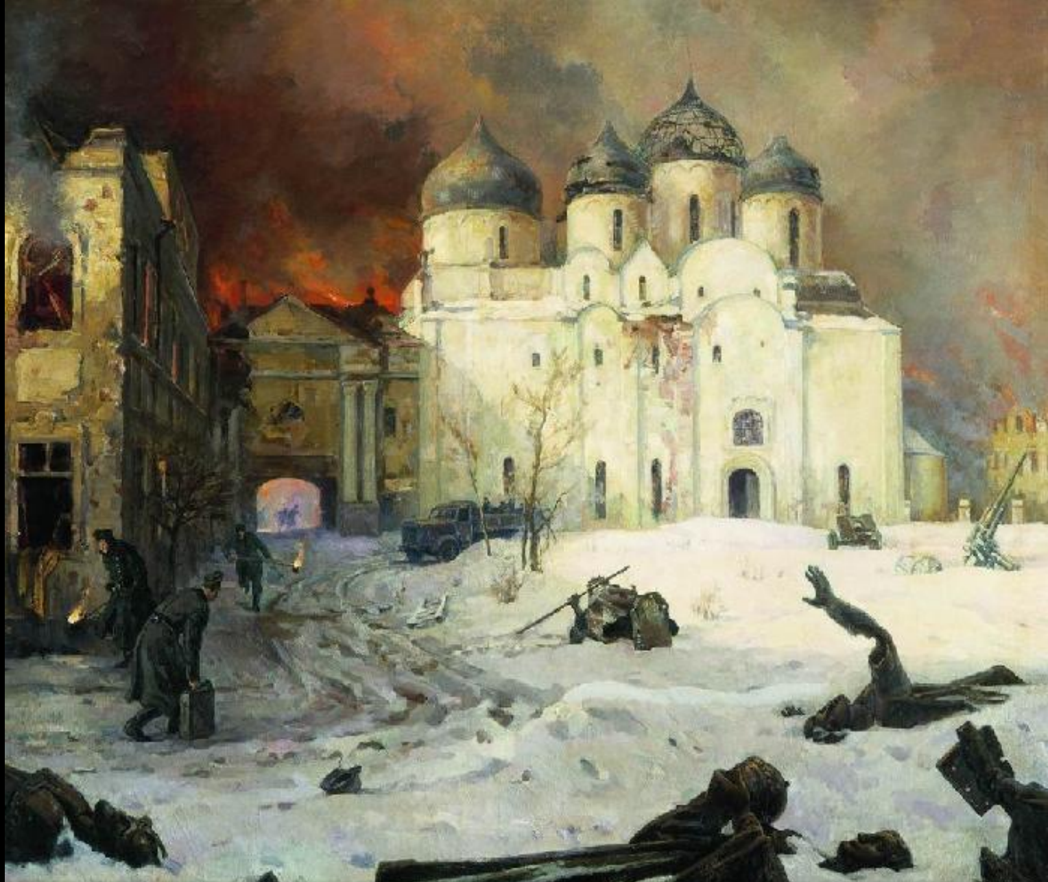
Кукрыниксы. Бегство фашистов из Новгорода (1944 – 1946)