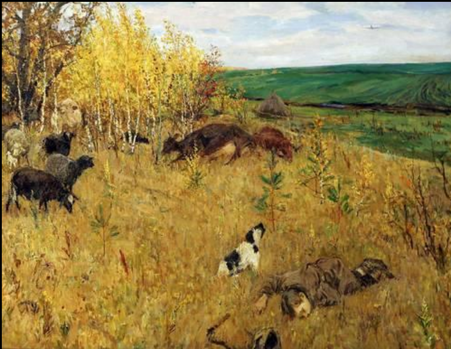
А.А. Пластов. Фашист пролетел (1942)