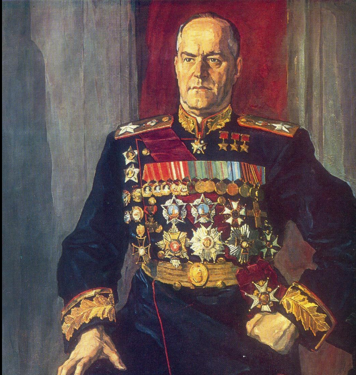
Портрет маршала Г.К. Жукова работы П.Д. Корина (1945)