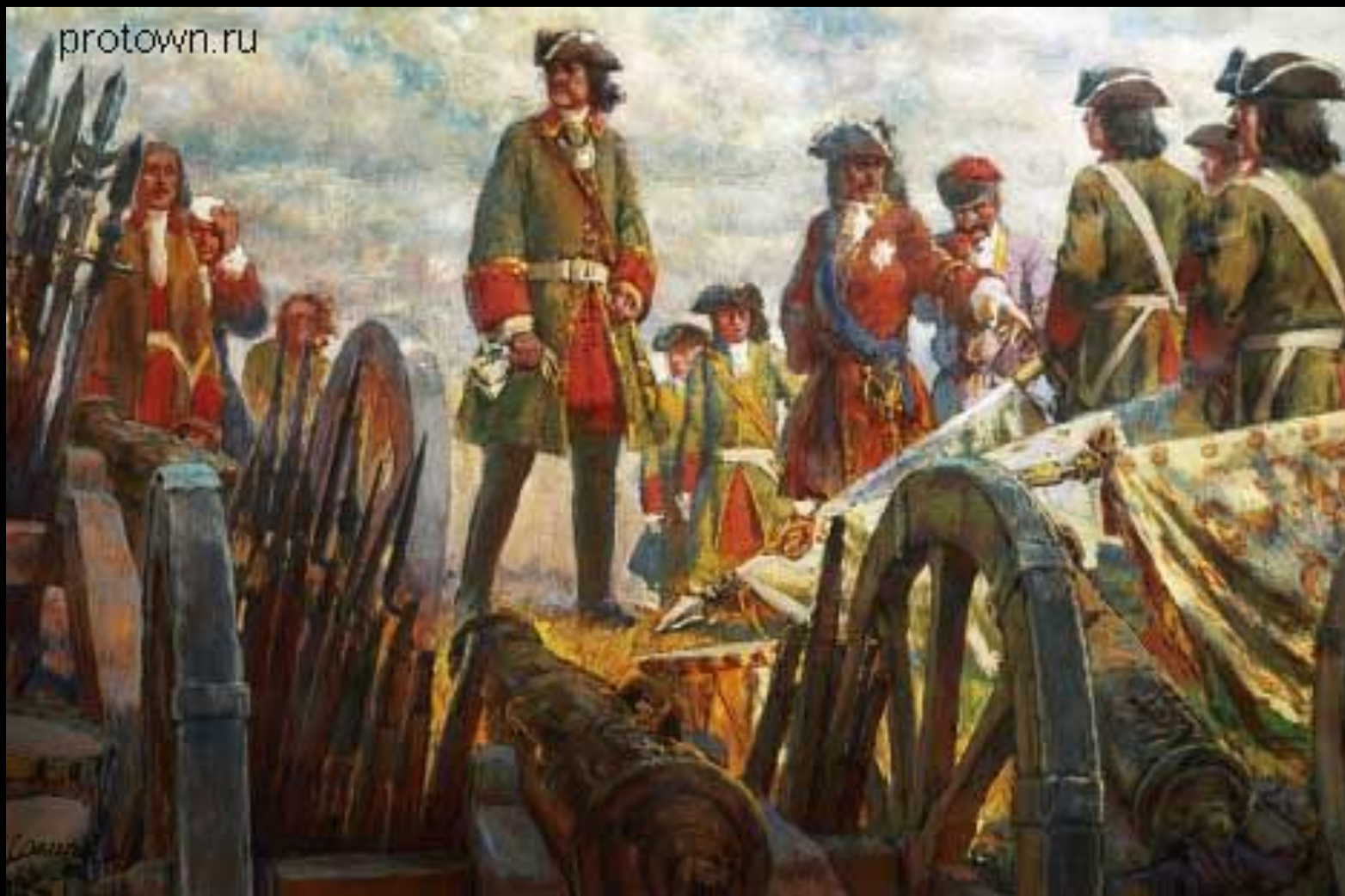
Е.Е. Лансере "Полтавская битва" (1942)