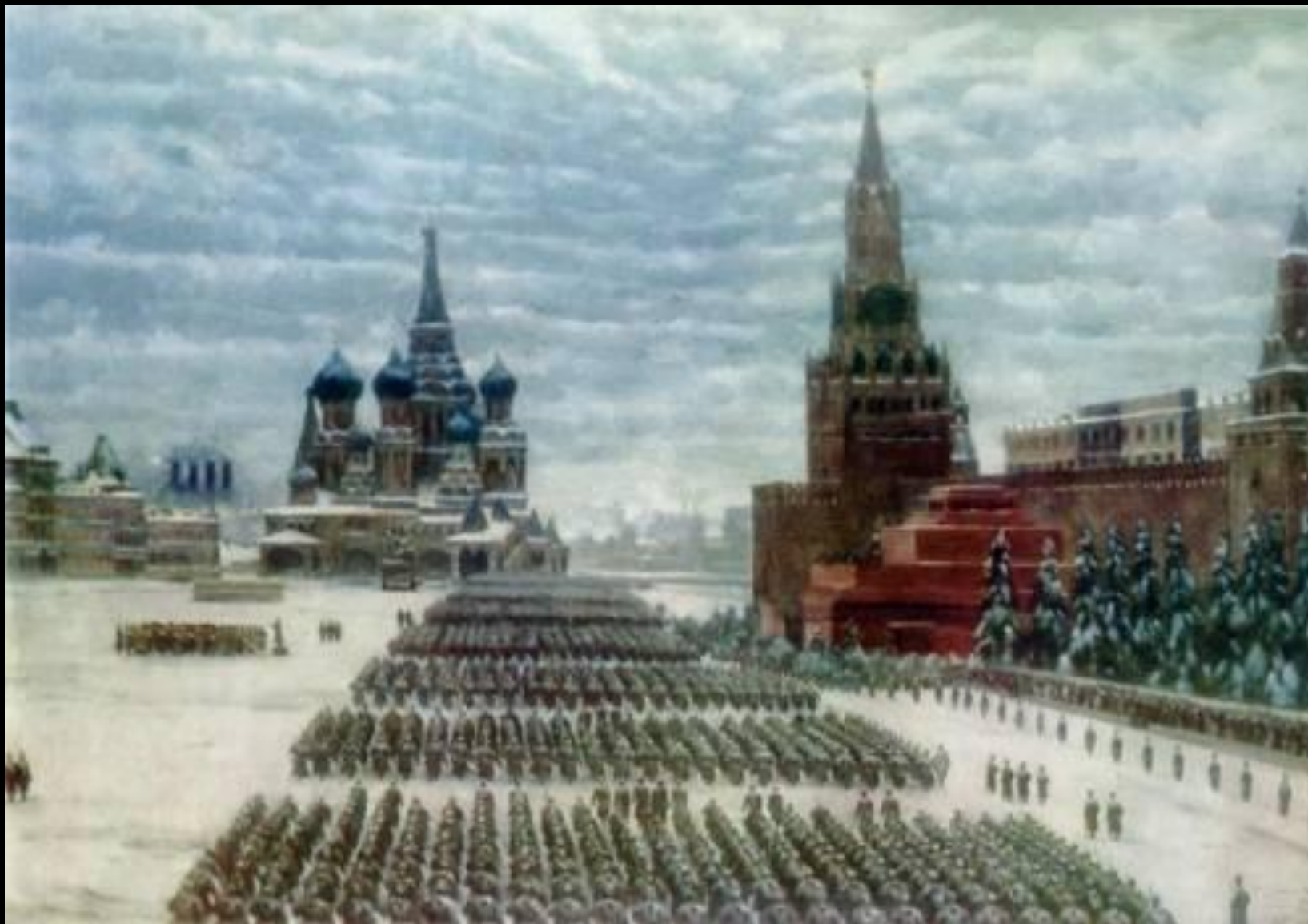
К.Ф. Юон. Парад на Красной площади 7 ноября 1941 года(1942)