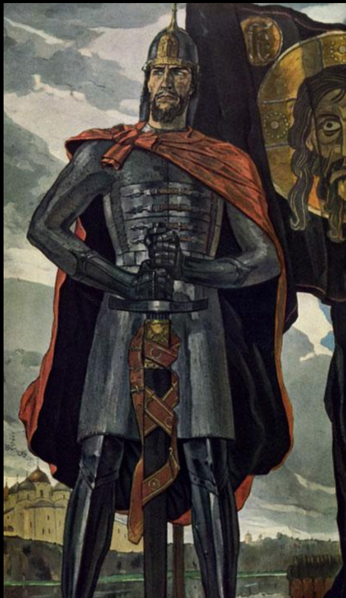
П.Д. Корин создает триптих "Александр Невский" (1942-1943)