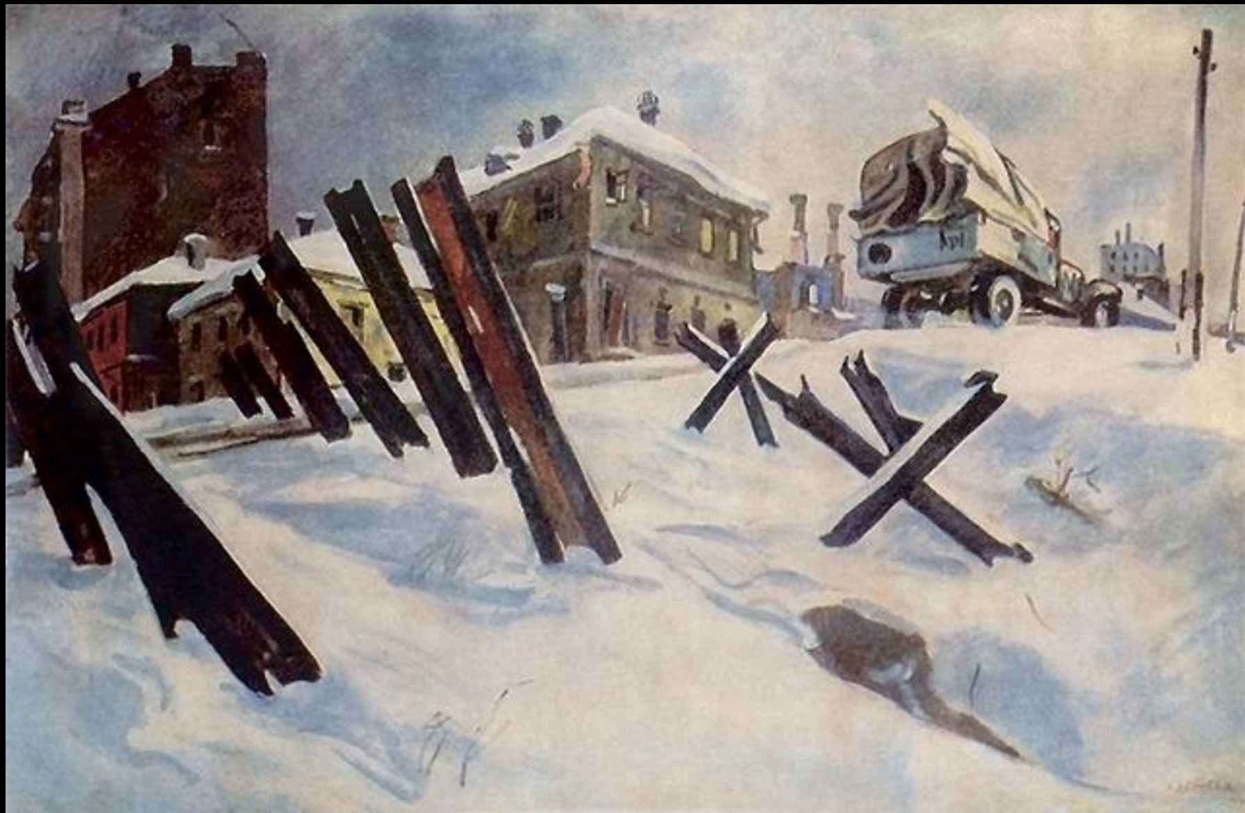
А.А. Дейнека. Окраина Москвы. Ноябрь 1941 г." (1941)