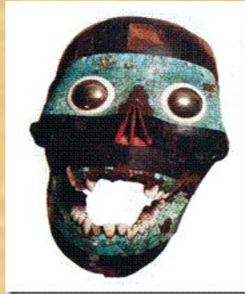
Человеческий череп, покрытый мозаикой из бирюзы и обсидиана