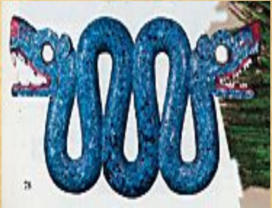
Двуглавая ацтекская змея, выложенная мозаикой из бирюзы.