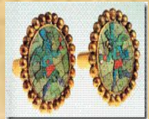
Серьги. Доколумбова эпоха