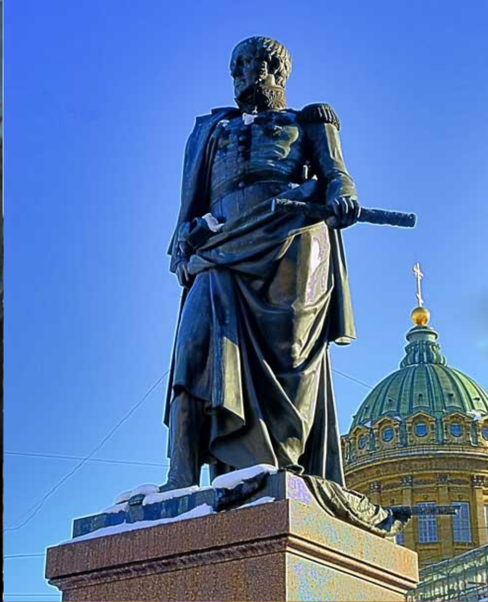
Архитектор Андрей ВОРОНИХИН Скульптор Борис ОРЛОВСКИЙ