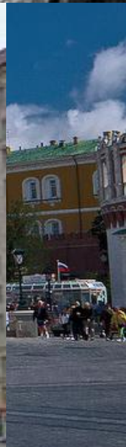
Осип Иванович БОВЕ