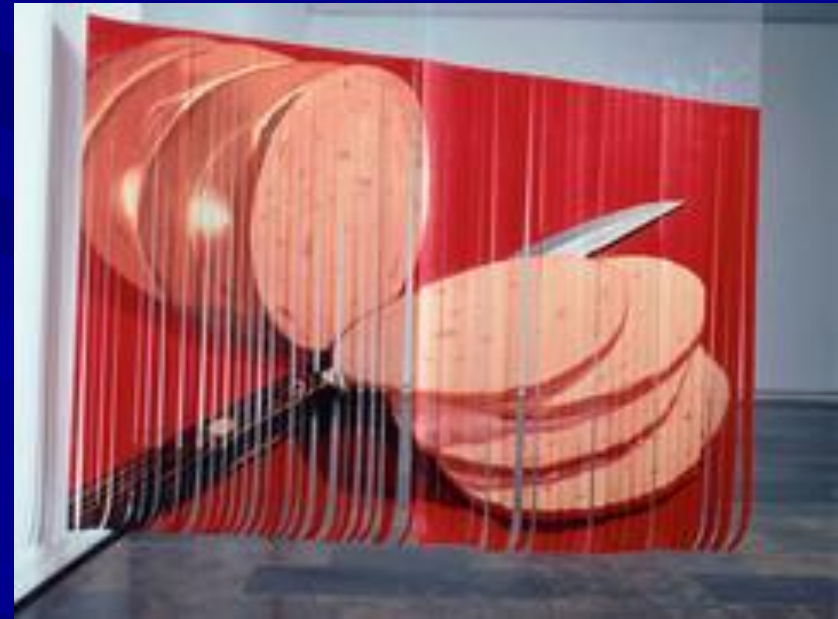
«Лесной странник», Брум-стрит, 1966г.