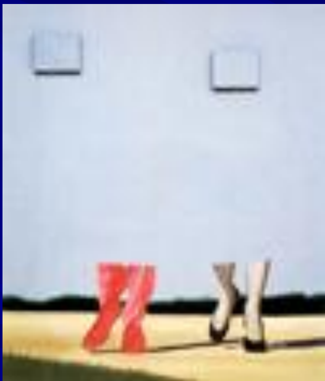
Без названия (Синее небо)1962.

Темные годы Гессквиста проходили в «одноцветной» провинциальной глуши, и встреча с яркими красками и улыбками городской рекламы и, позднее, с телевидением произвела на него неизгладимое впечатление.