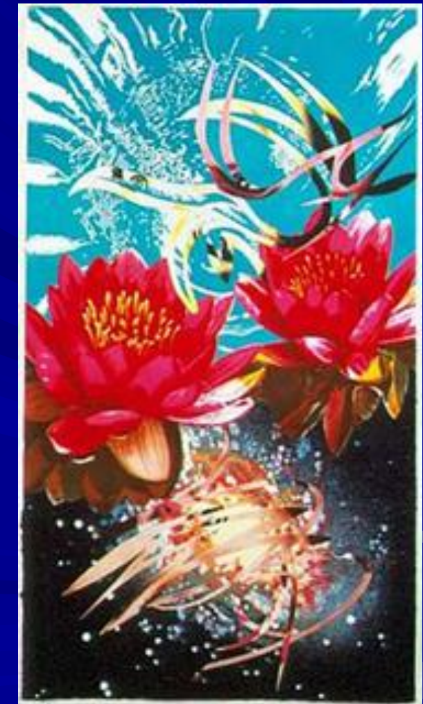
Окно в небо.1989г.