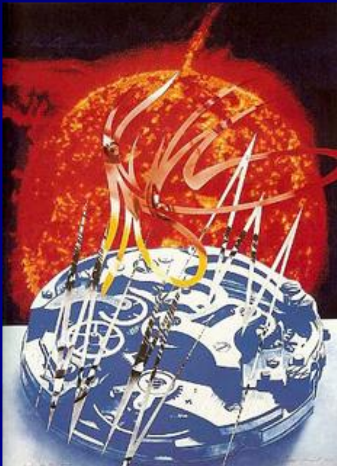
Заход солнца в часовом поясе.1989г.

«Как мне объяснить мои картины, я надеюсь, что они уходят от меня, что идея взлетает и имеет свою собственную жизнь.»