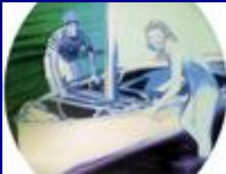
Корабль на телеэкране. 1966.