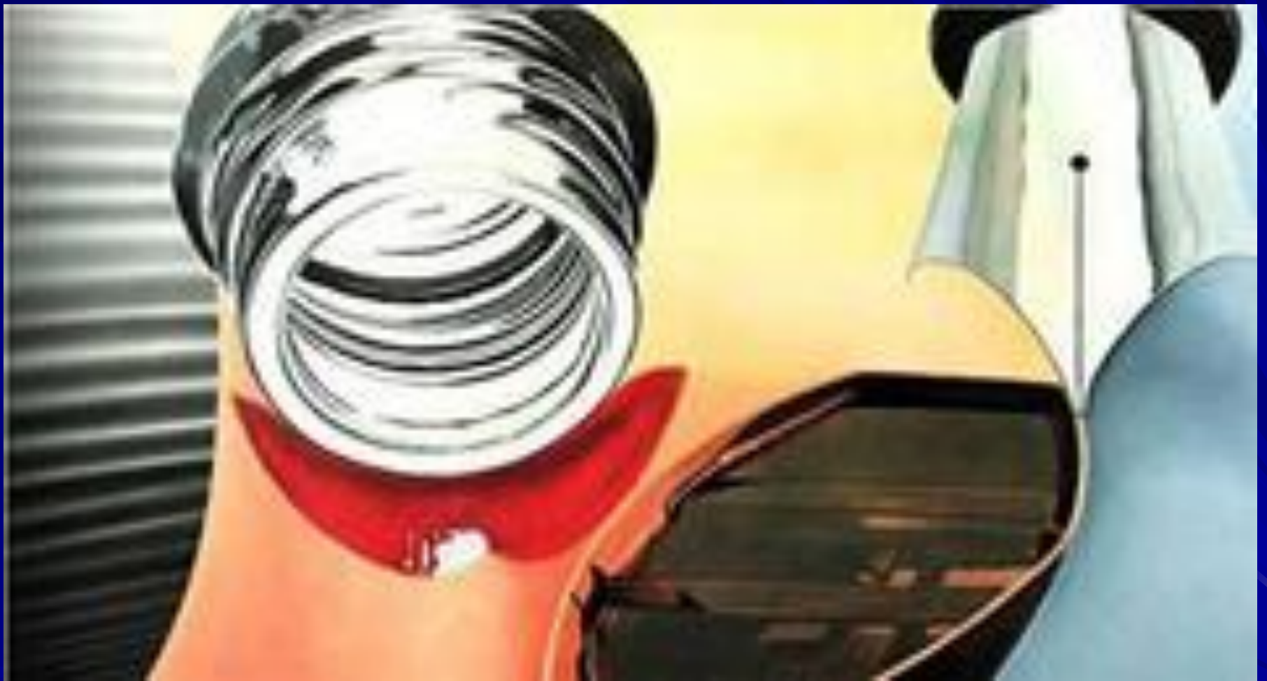
Кривая линия. 1977г.