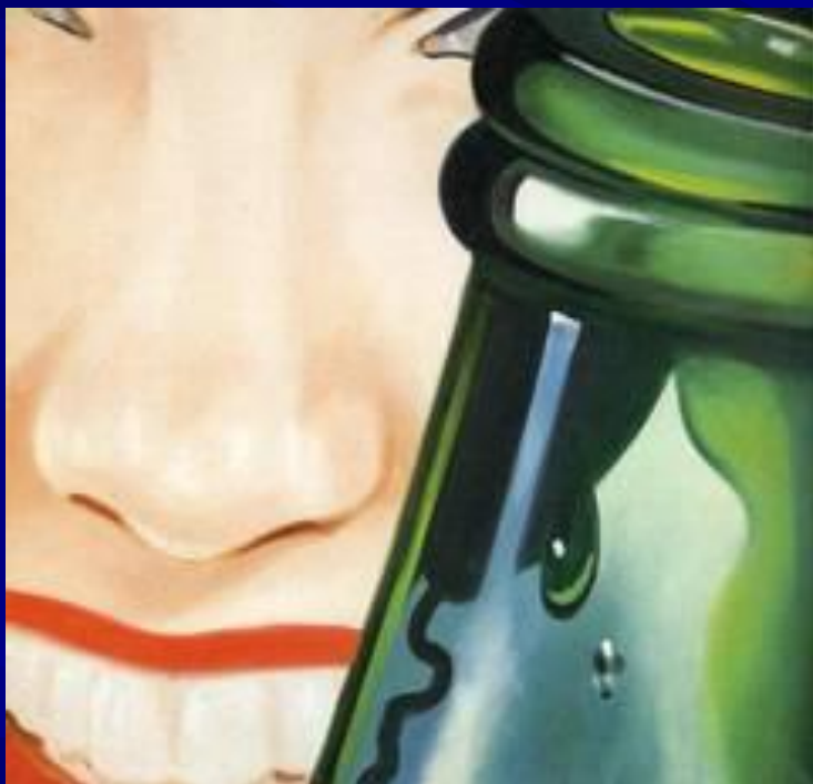
Давай прокатимся! (1961 г.)

союз художников-оформителей, где создаёт рекламные плакаты, вывешивающиеся на Манхеттене.