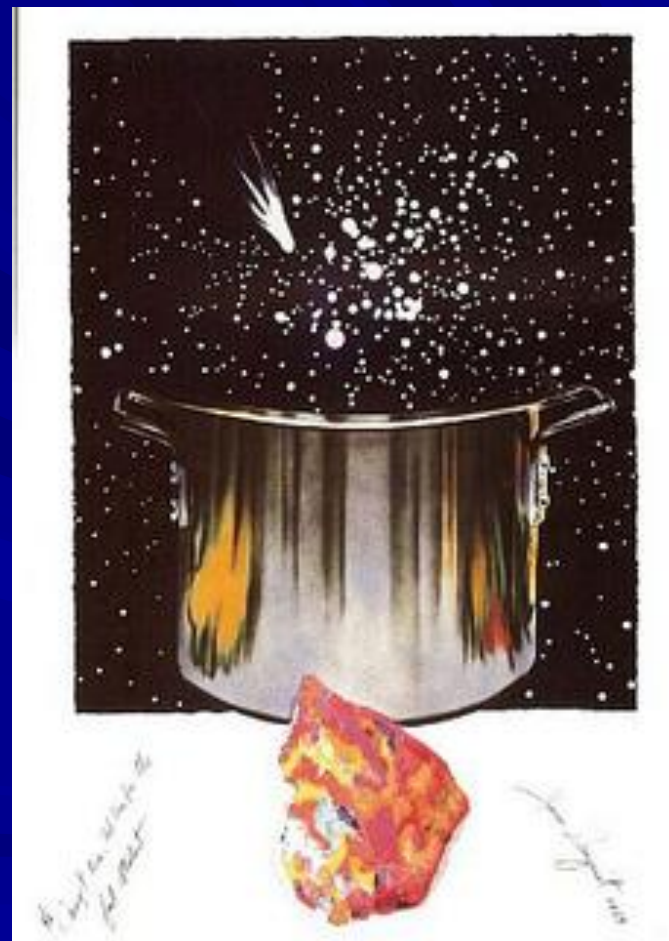
Студент или звездолов.1989г.