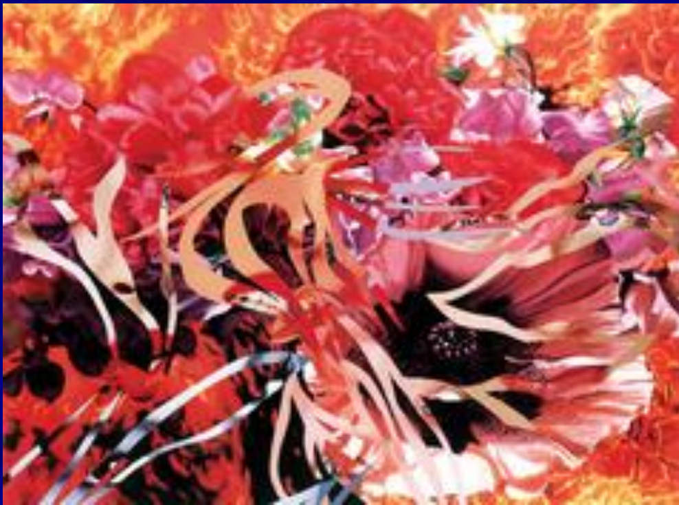
Бисер перед свиньями, цветы перед огнём.1990г.

В поздних произведениях мастера – с преобладающими в них космическими и цветочными мотивами – возобладали более благодушные настроения.