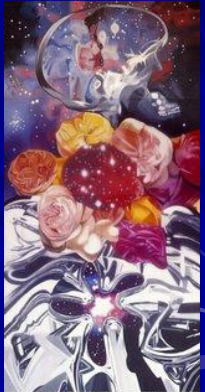
James Beckett, 'Crystals in Space', 2011.