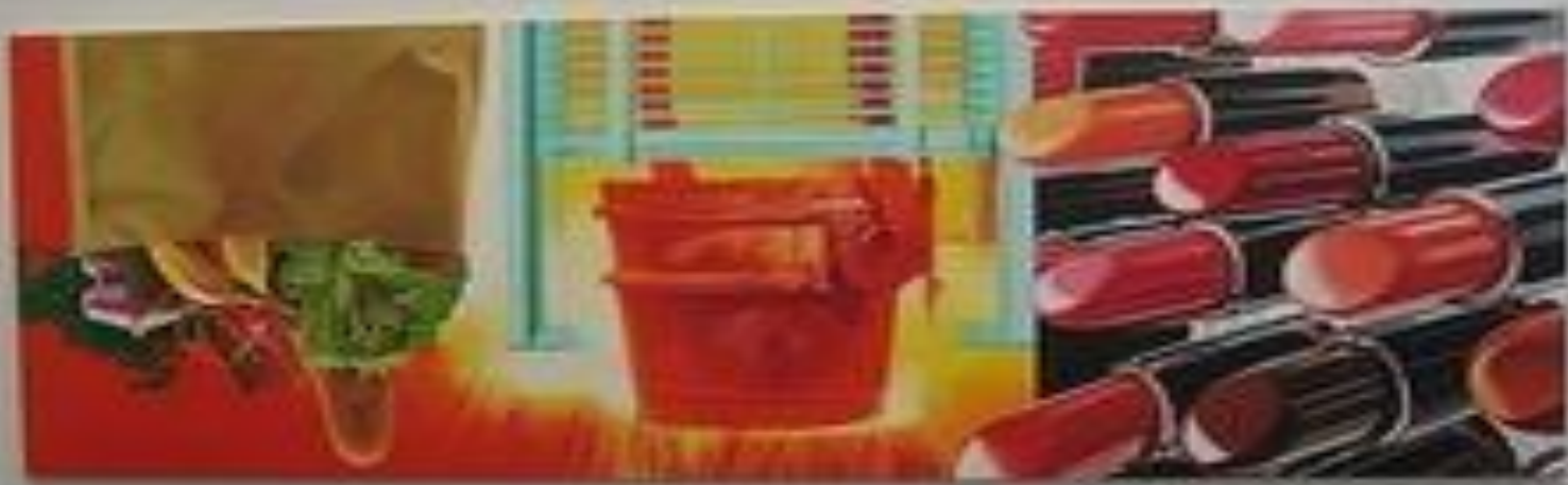
Огненный дом. 1981г.

«Всякий раз, когда я получал новую студию я делал максимально возможное для живописи, но с низким потолком, картины стали горизонтальным.»