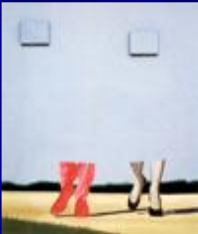
Без названия (Синее небо)1962.