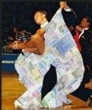
Как это видит папа