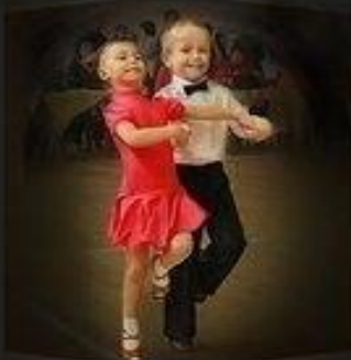
Как это видит мама)