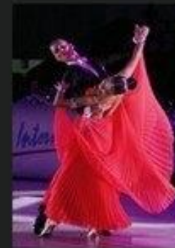
Как это есть.