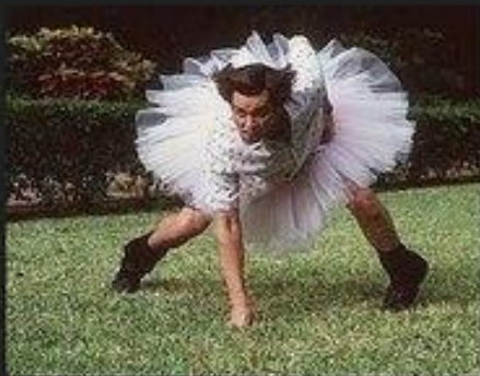
Как это видят мои друзья