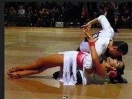
Как это видит моя девушка