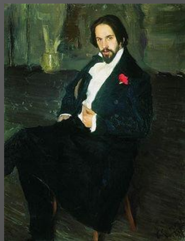
Билибин, Иван Яковлевич