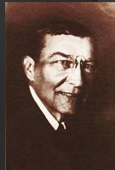
Д. И. Митрохин