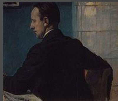
М. В. Добужинский