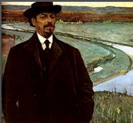
Михаил Васильевич Нестеров