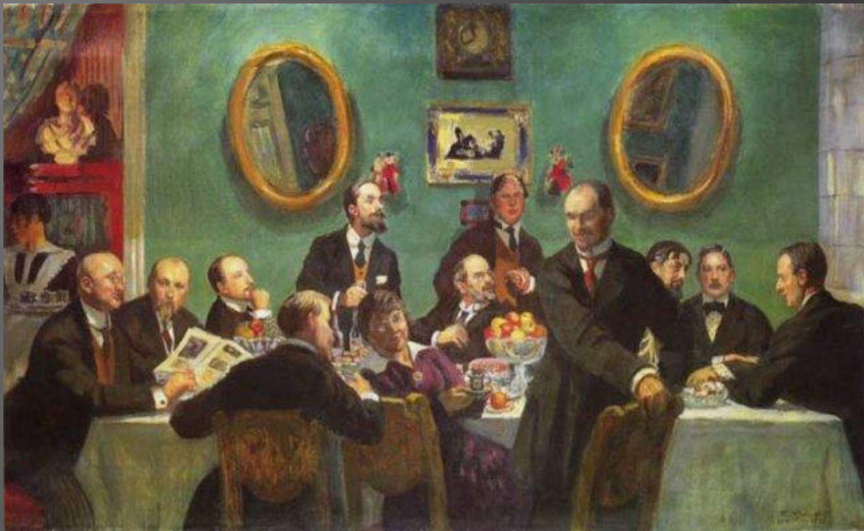
Мир искусства. 1916-1920. Б.М. Кустодиев