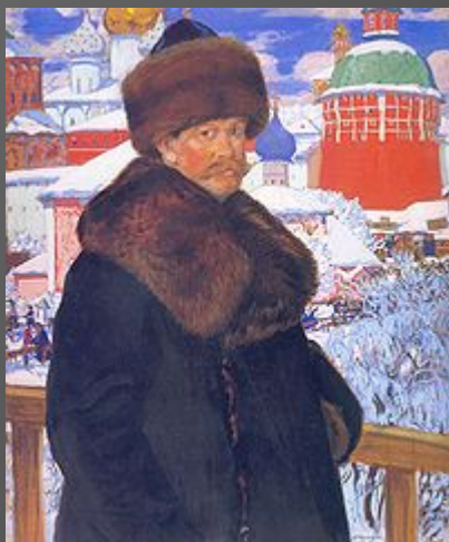
Борис Михайлович Кустодиев