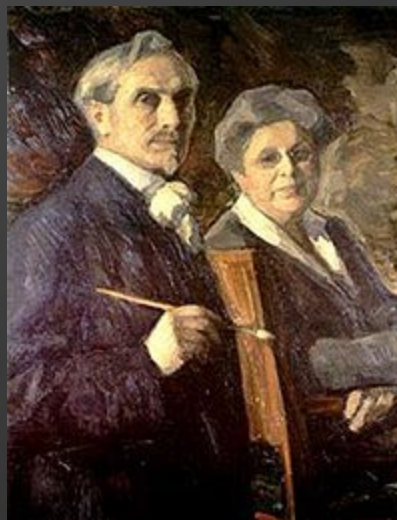
Пастернак, Леонид Осипович