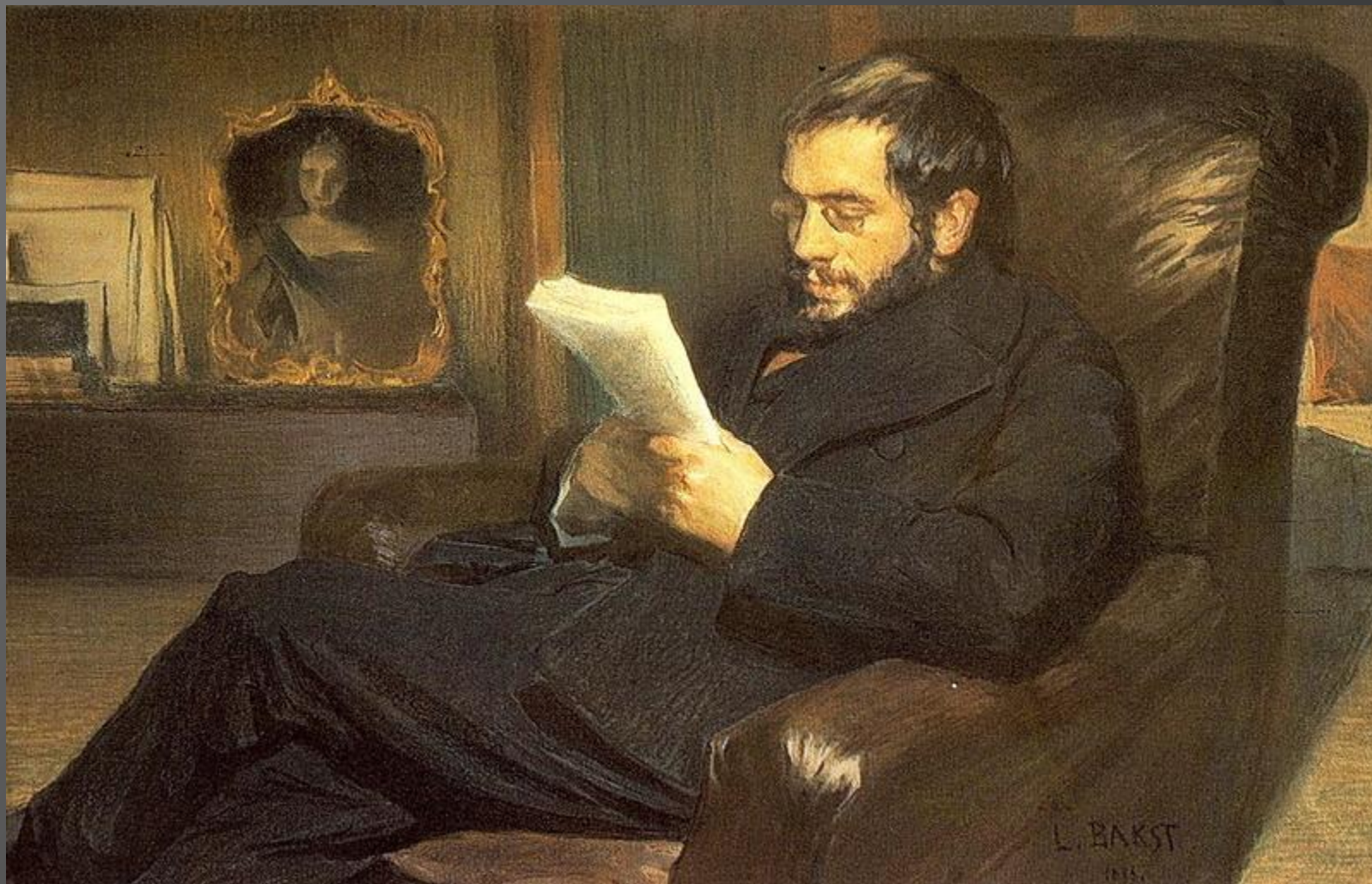
Бенуа Александр Николаевич