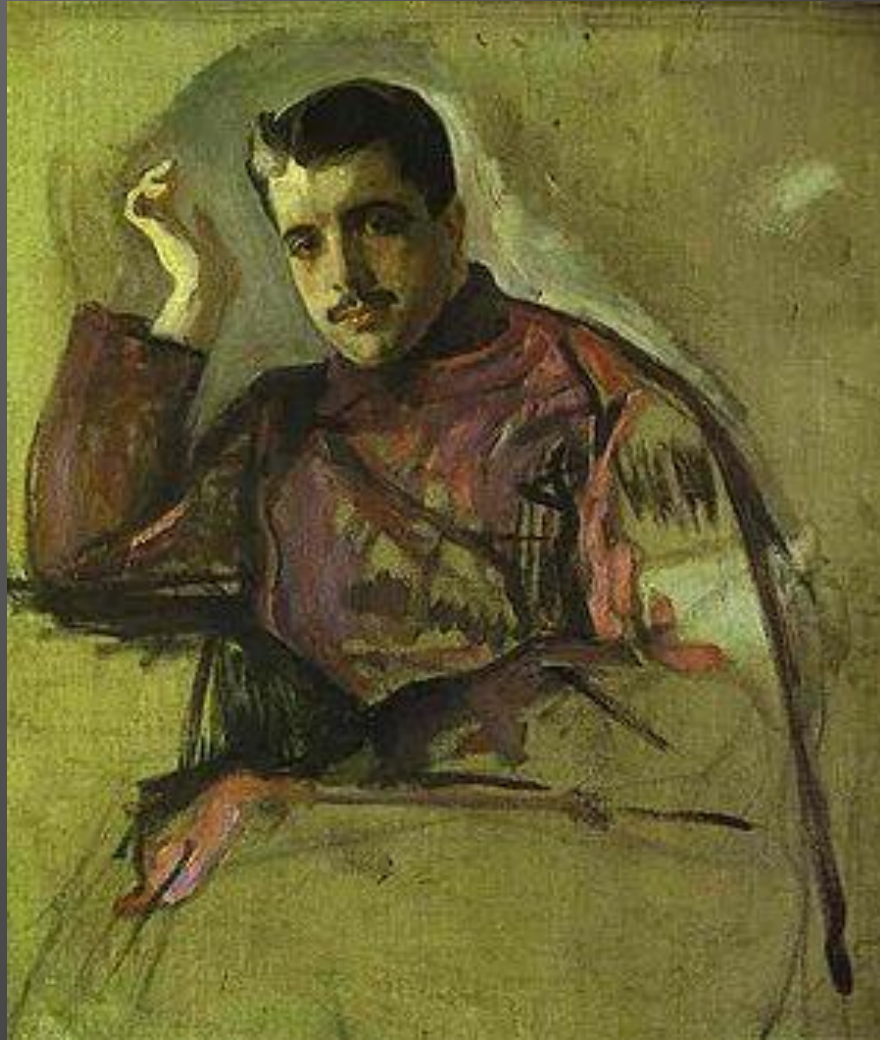
Дягилев Сергей Павлович