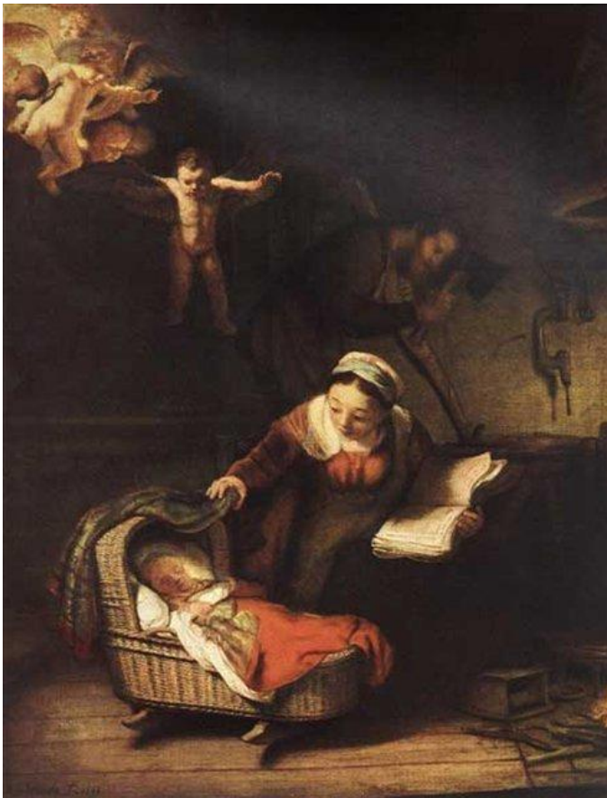
Рембрандт, «Святое семейство»