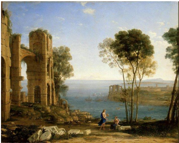
Клод Лоррен, «Байский залив»