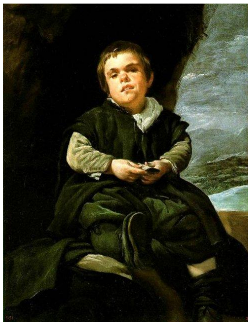
Портрет придворного карлика