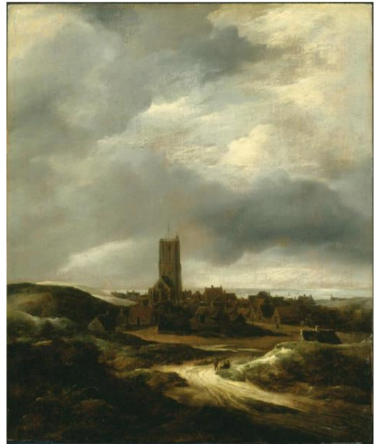
Якоб ван Рейсдал, «Вид деревни Эгмонт»

Вывод: стиль барокко построен на контрастах и асимметрии, тяготеет к грандиозности и пышной декоративности.