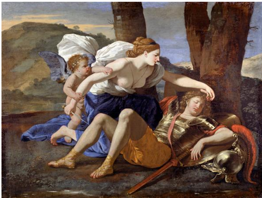
Никола Пуссен, «Ринальдо и Армида»