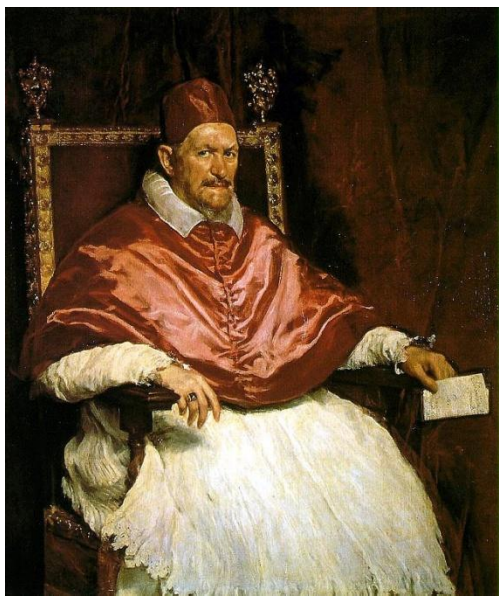
Папа Иннокентий X