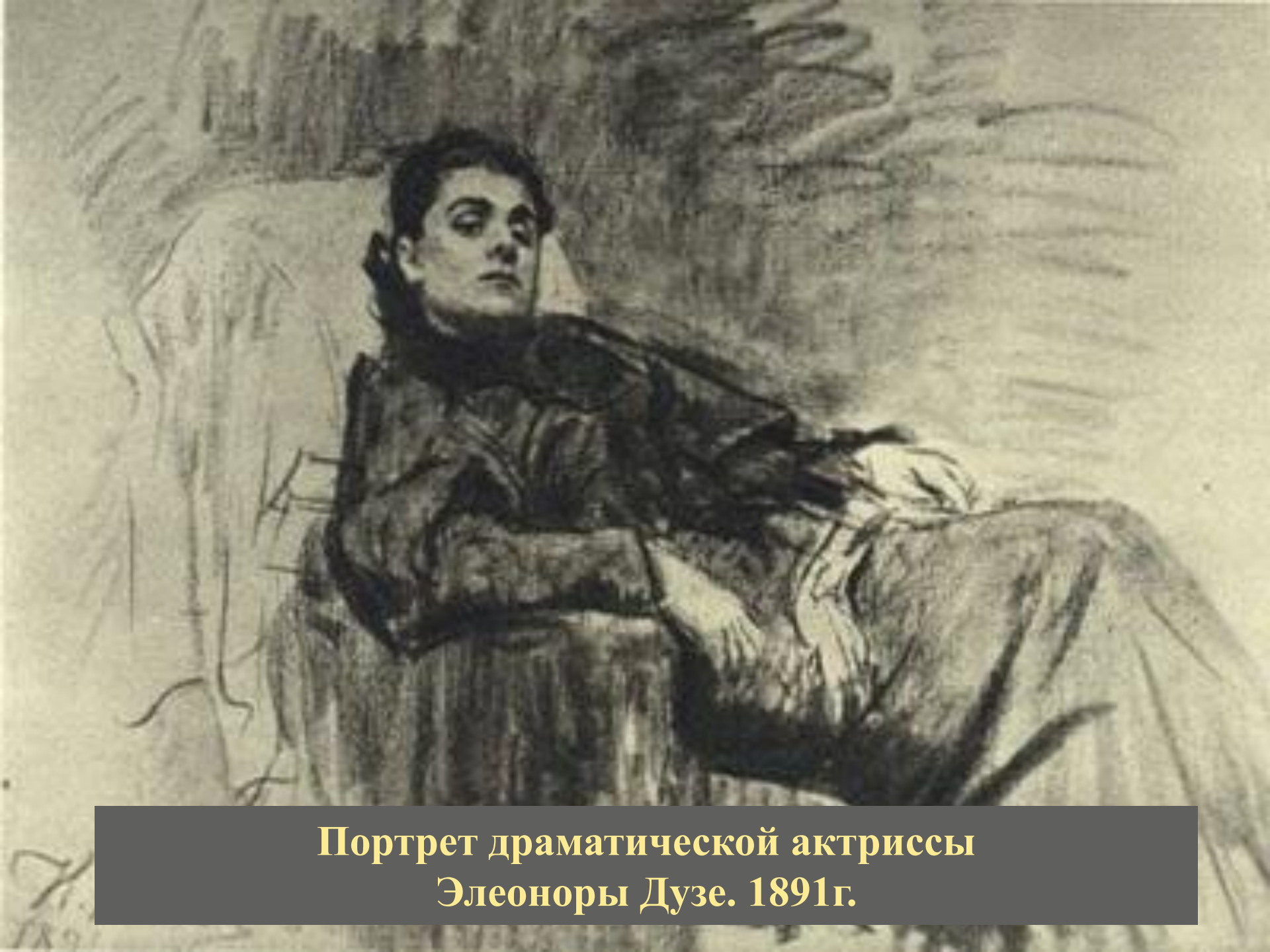
Портрет драматической актриссы Элеоноры Дузе. 1891г.