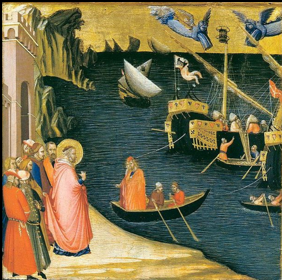
Амброджо Лоренцетти. «Сцены из жизни св. Николая», деталь: Св. Николай, чудом наполняющий трюмы кораблей зерном. 1330е гг. Флоренция, Галерея Уффици.