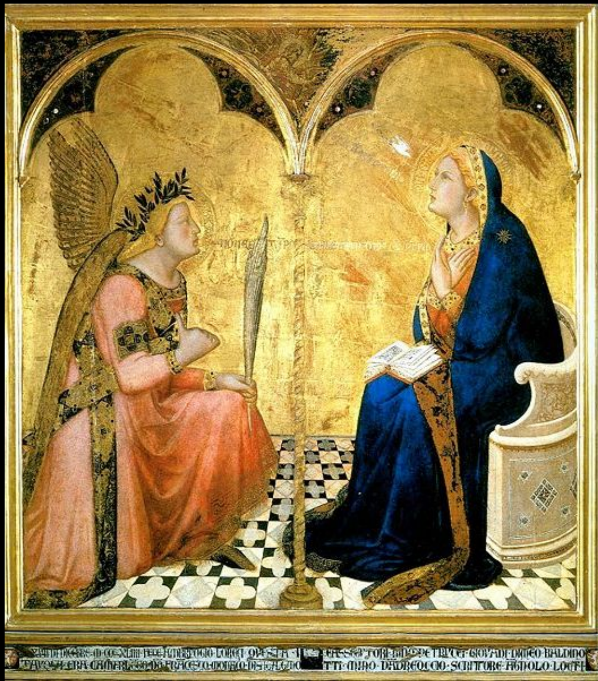
Амброджо Лоренцетти. «Благовещенье» 1344 г. Сиена, Пинакотека.