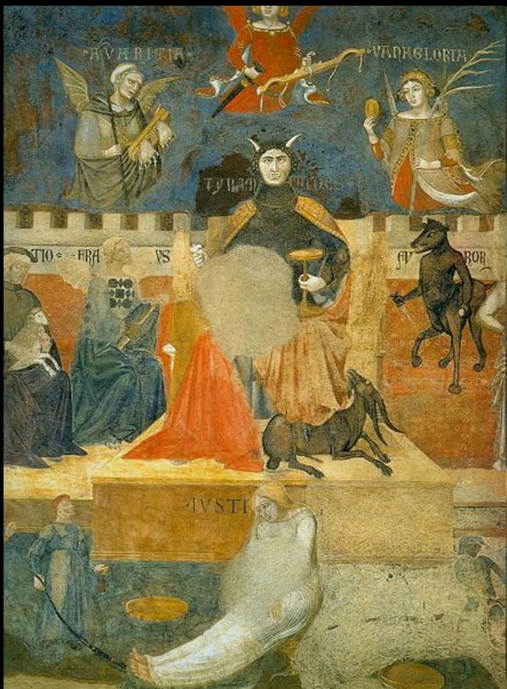
Амброджо Лоренцетти. «Плоды дурного правления» фреска, деталь. 1337-39гг. Сиена, Палаццо Пубблико.