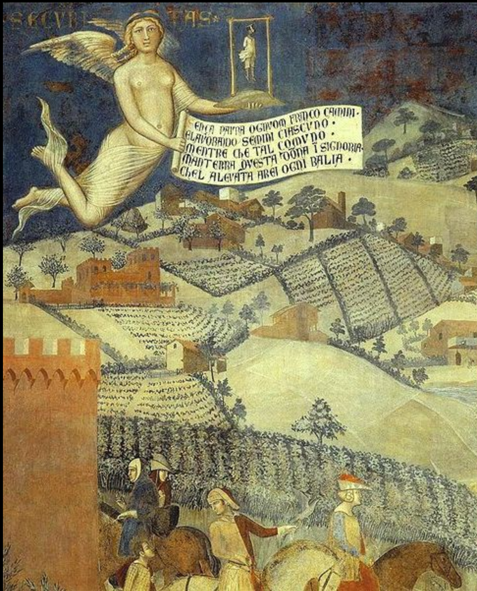
Амброджо Лоренцетти. «Плоды доброго правления» фреска, деталь: Аллегория Безопасности. 1337-39гг. Сиена, Палаццо Пубблико.