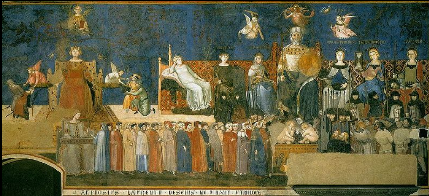
Амброджо Лоренцетти. «Аллегория доброго правления» фреска, деталь. 1337-39гг. Сиена, Палаццо Пубблико.