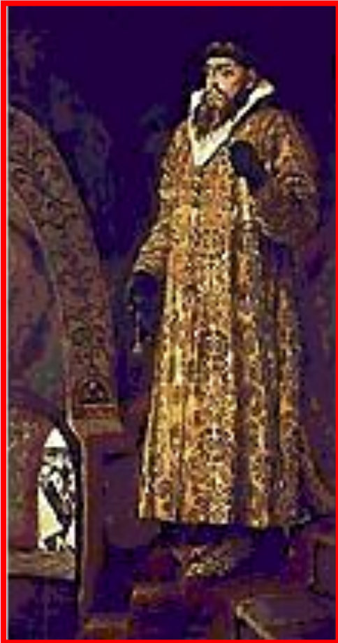
ИВАН IV ГРОЗНЫЙ