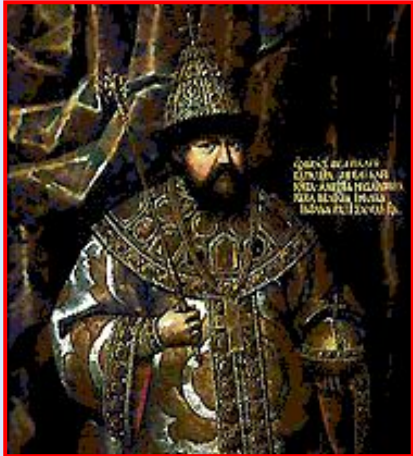
ЦАРЬ И ВЕЛИКИЙ КНЯЗЬ АЛЕКСЕЙ МИХАЙЛОВИЧ