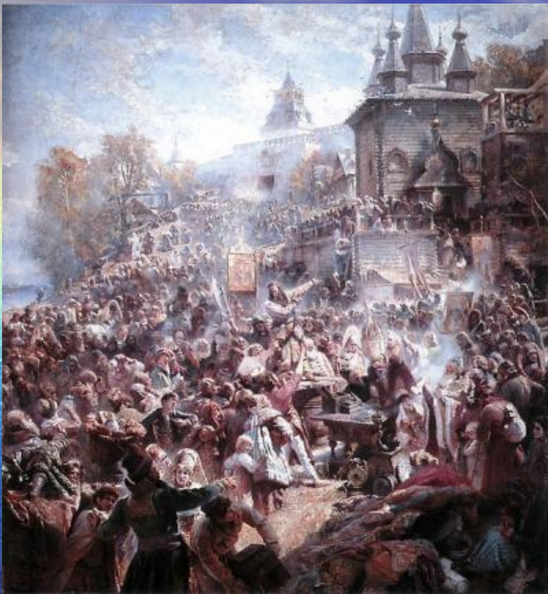
Народное ополчение Минина и Пожарского