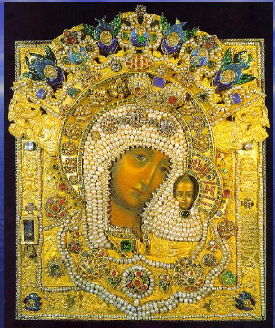
Икона Казанской Божьей Матери