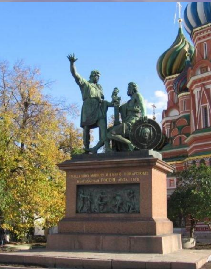
Памятник Минину и Пожарскому в Москве