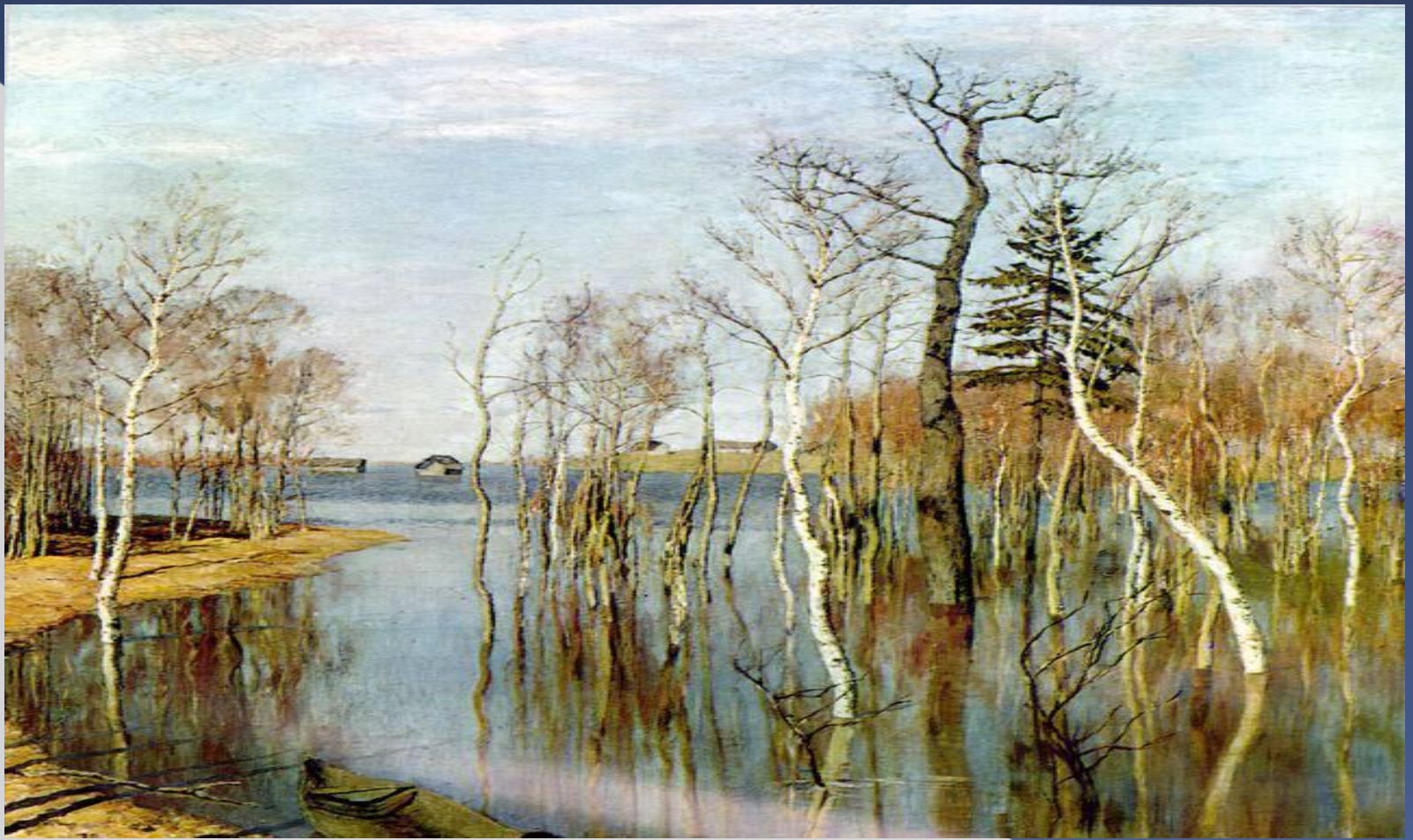
И.И.Левитан «Большая вода».