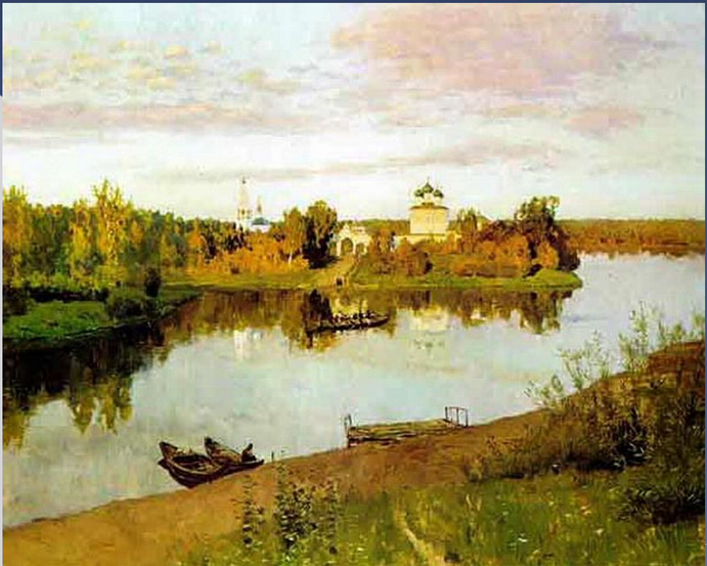
И.И.Левитан «Вечерний звон»