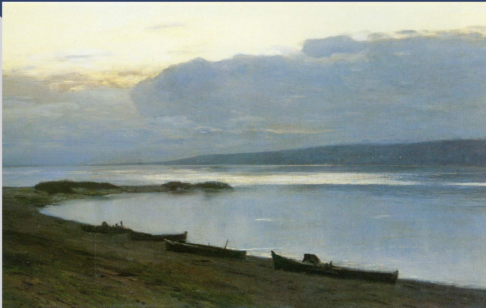
И.И.Левитан «Вечер на Волге»