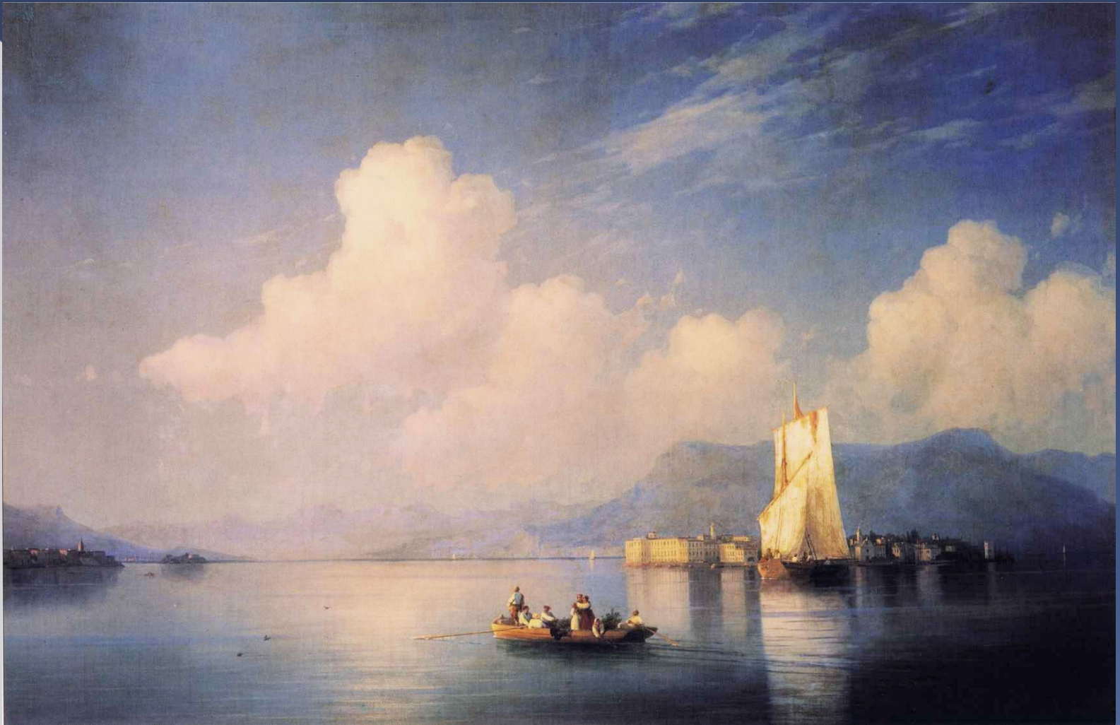
И.К.Айвазовский «Итальянский пейзаж»