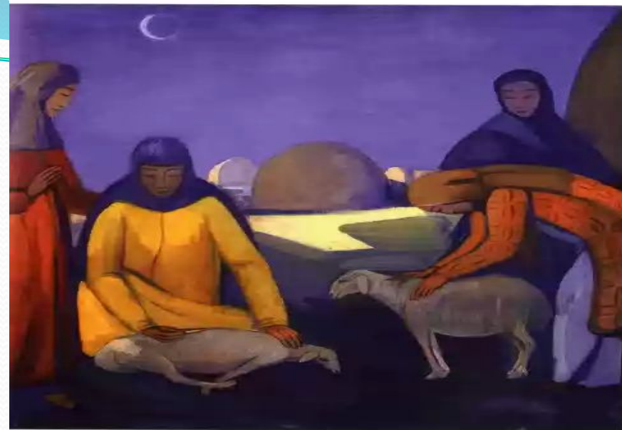
ЖИВОПИСЬ. РУБЕЖ XIX И XX ВЕКОВ