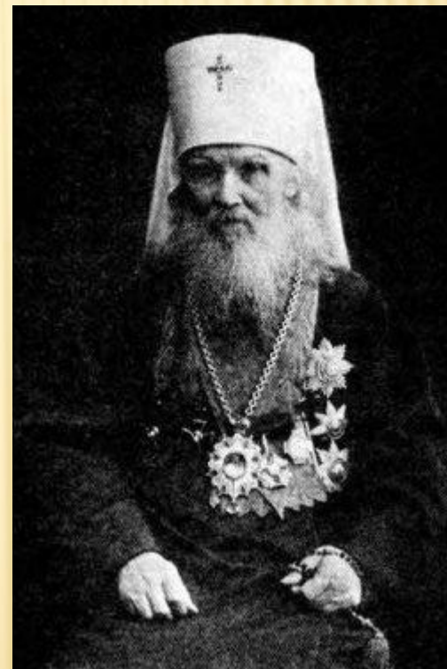
Митр. Московский и Коломенский Макарий (Невский)