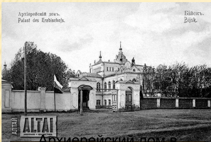
Архиерейский дом в Бийске 1910 г.