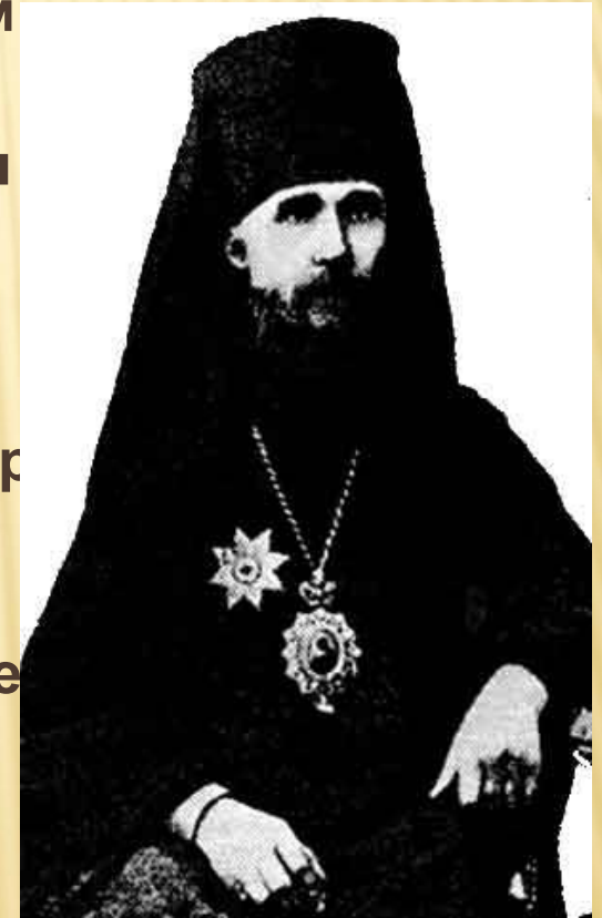
Архимандрит Макарий епископ Бийский, начальник Алтайской миссии.