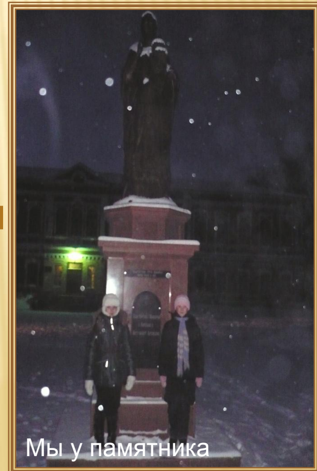
Мы у памятника

1 ОКТЯБРЯ 2009 ГОДА В Г. БИЙСКЕ НА АРХИЕРЕЙСКОЙ ПЛОЩАДИ АРХИЕРЕЙСКОГО ПОДВОРЬЯ АЛТАЙСКОЙ ДУХОВНОЙ МИССИИ СОСТОЯЛОСЬ ТОРЖЕСТВЕННОЕ ОТКРЫТИЕ ПАМЯТНИКА