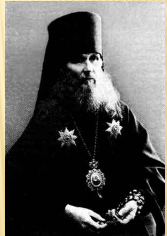
Макарий епископ Томский.