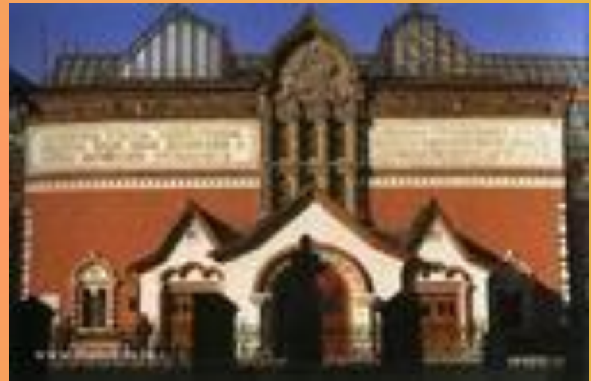
фасад Третьяковской галереи

По чертежам В.М. Васнецова исполнены некоторые архитектурные работы: церковь в Абрамцеве, фасады Третьяковской галереи, Музея Цветкова и другие работы