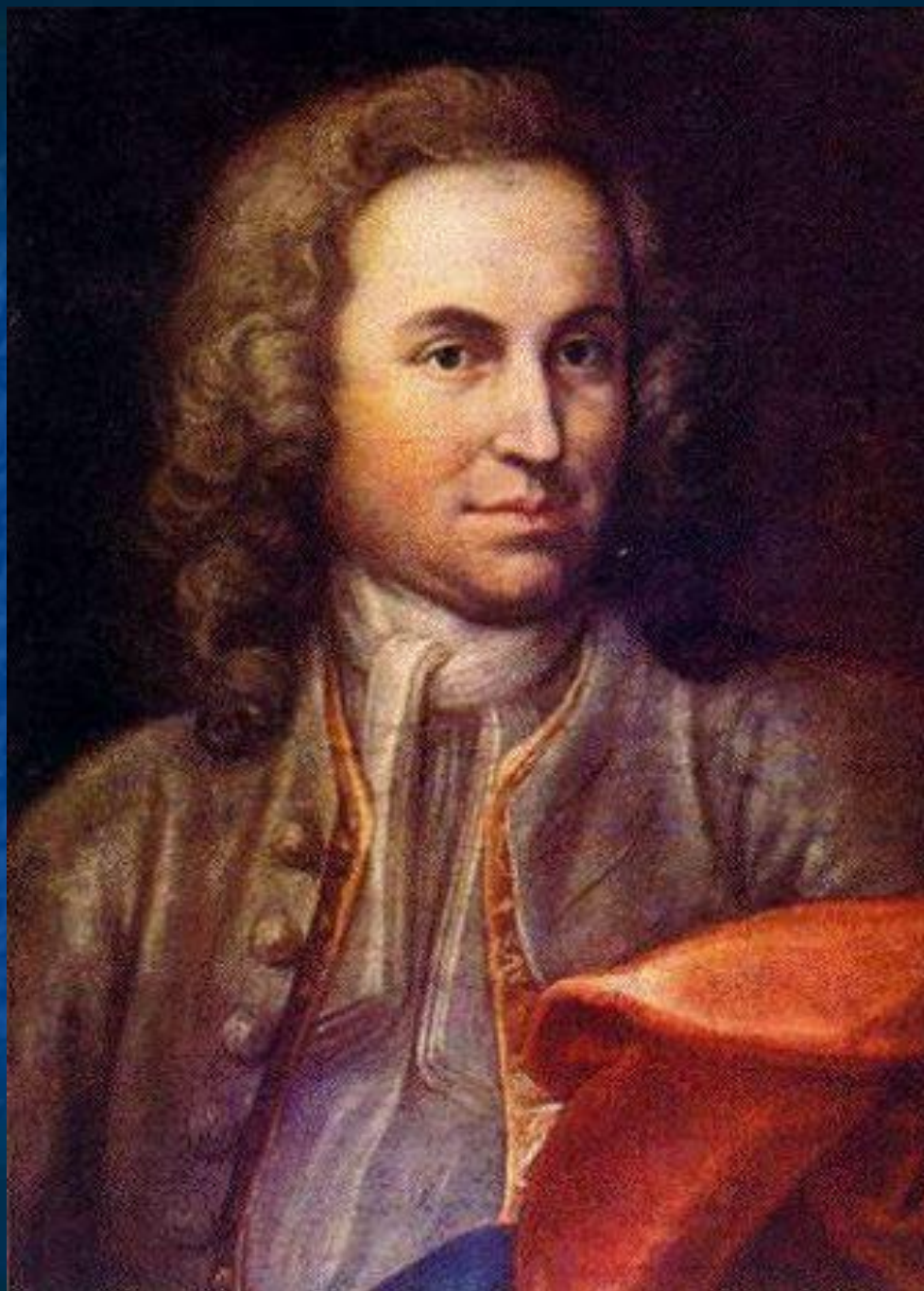
ИОГАНН СЕБАСТЬЯН БАХ (1685-1750)