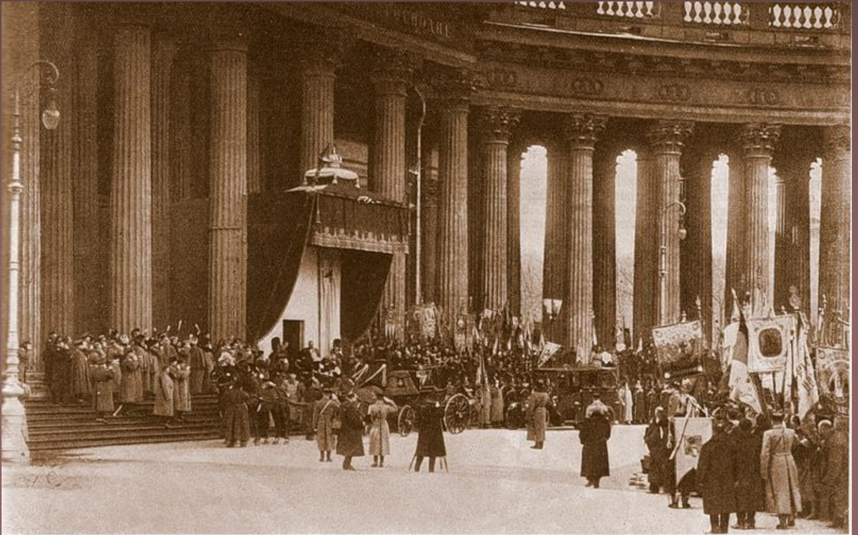
Отбытіе Ихъ Императорскихъ Величествъ изъ Казанскаго собора послѣ торжественнаго богослуженія.