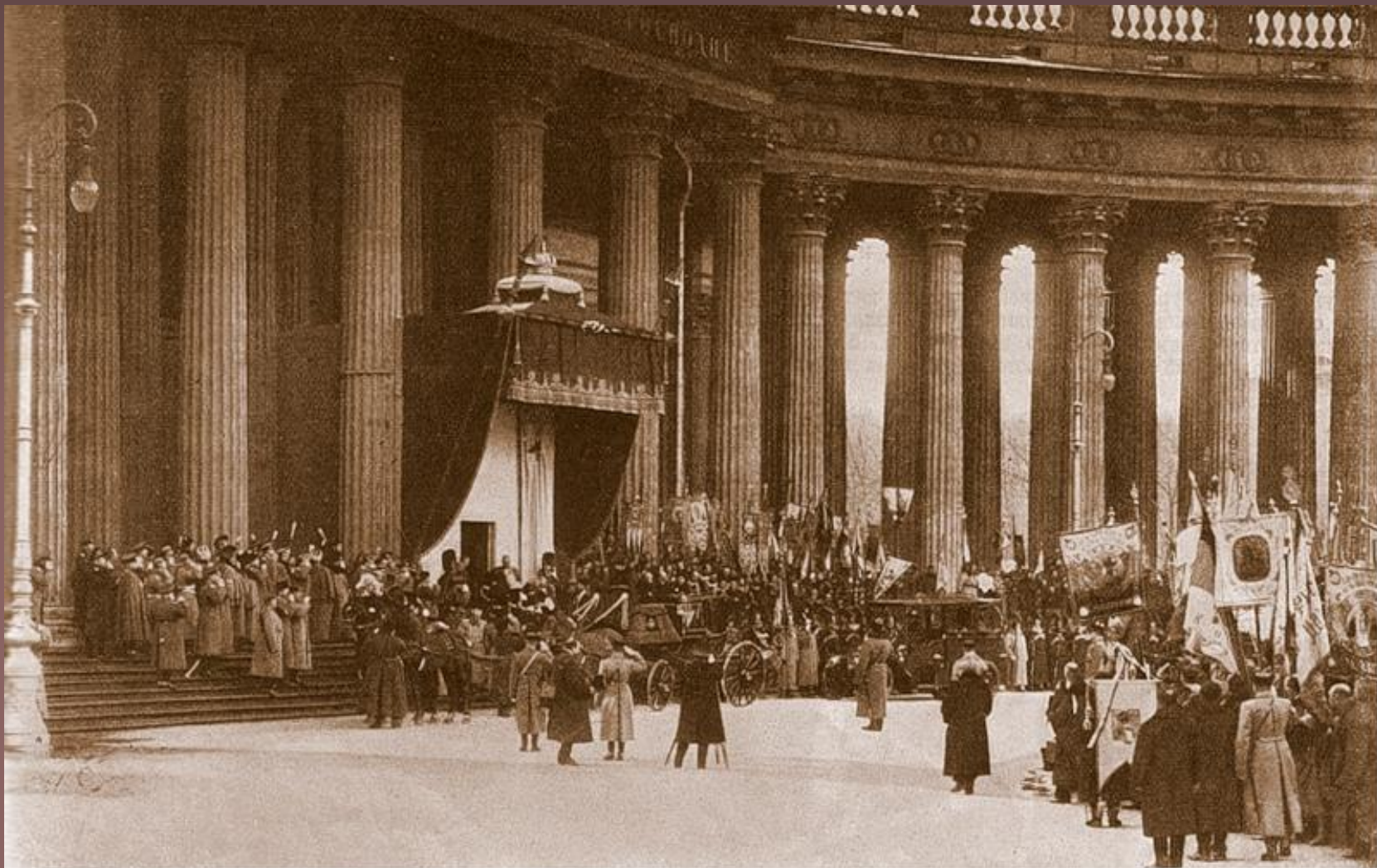
Отбытіе Ихъ Императорскихъ Величествъ изъ Казанскаго собора послѣ торжественнаго богослуженія.