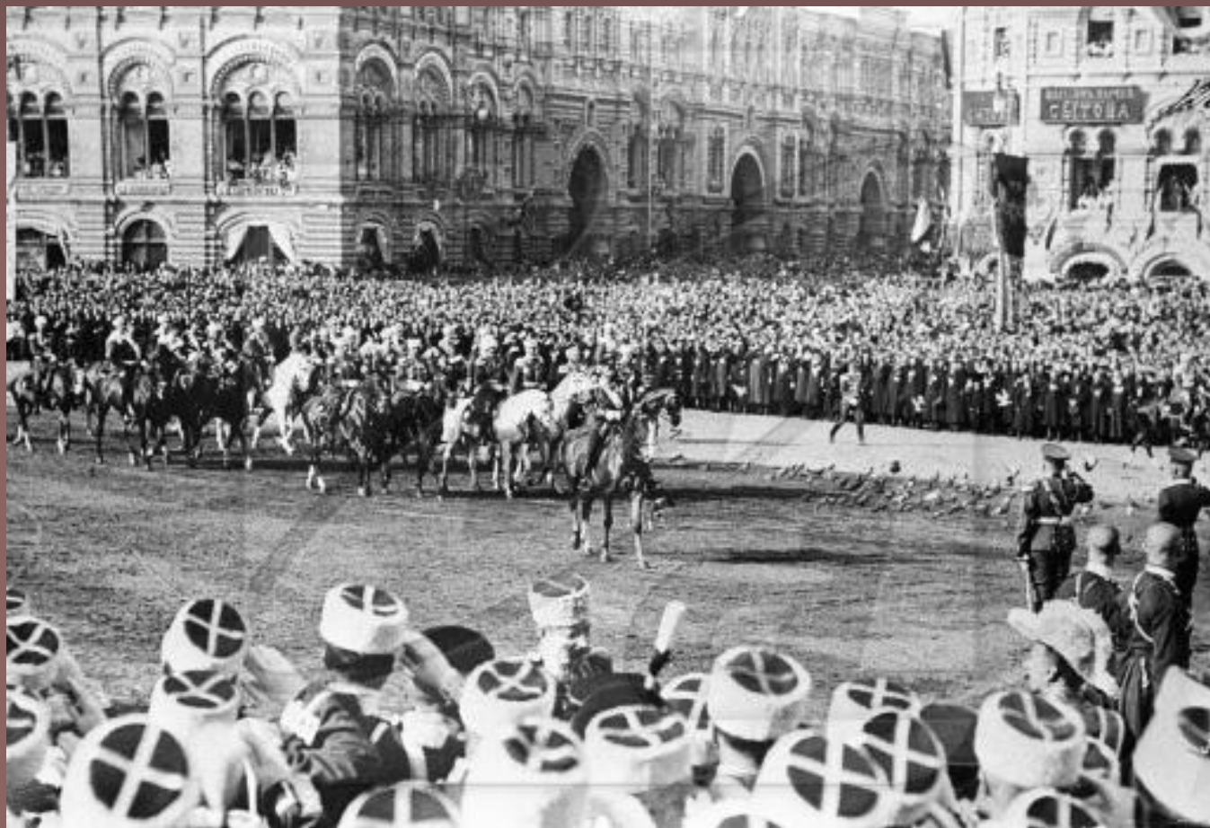
В Москве (Красная площадь)