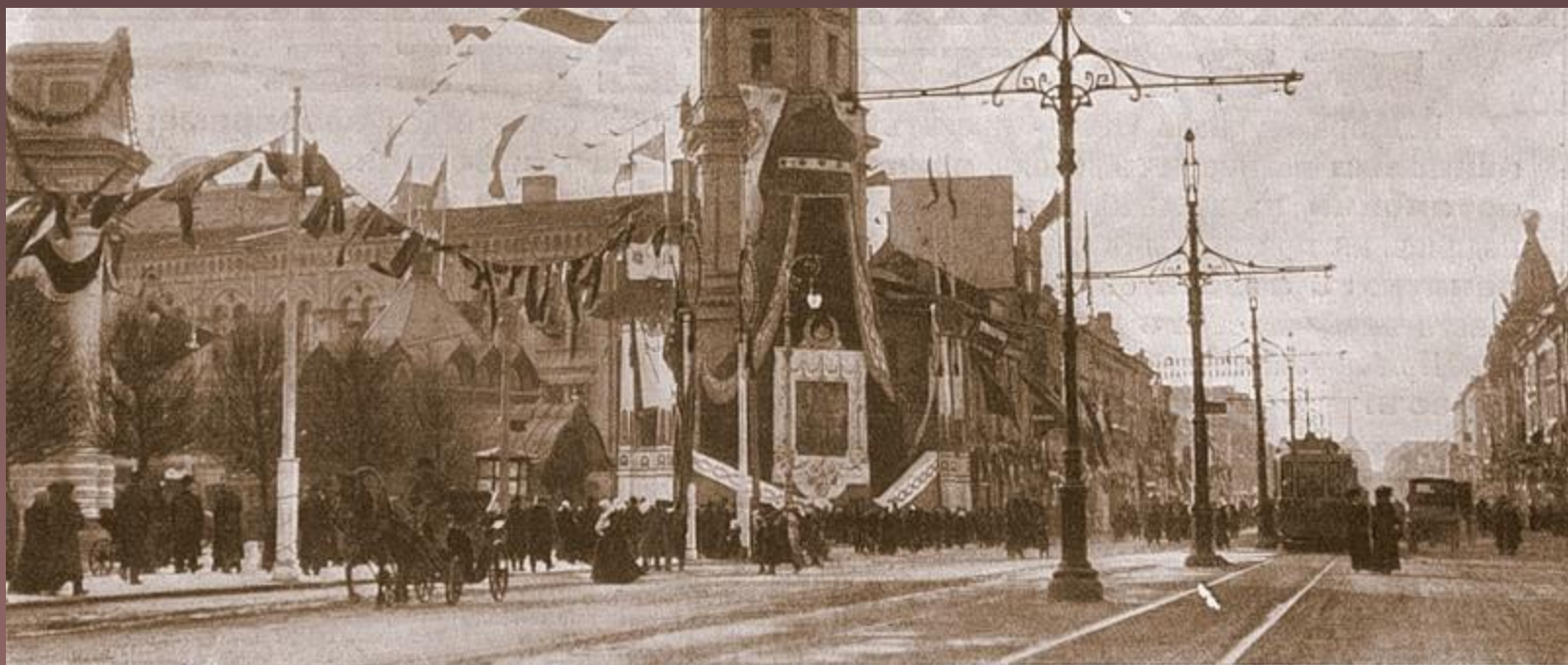
Украшение зданий въ С.-Петербургѣ въ дни юбилейныхъ торжествъ 21—24 февраля с. г. Зданіе городской Думы. Невскій проспектъ.