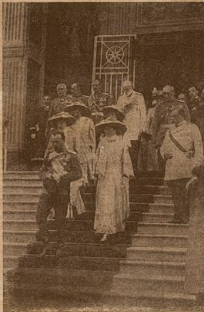
Высочайшій выходъ изъ кафедральнаго собора въ Н. и немъ-Новгородѣ съ кѣс нымъ ходомъ въ мѣсту вѣдѣннѣю памятника Минину и Пожарскому.