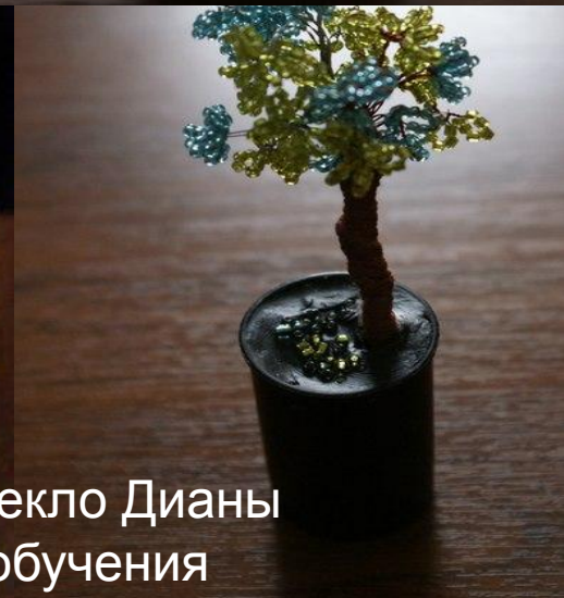
Работы Пекло Дианы 2 год обучения