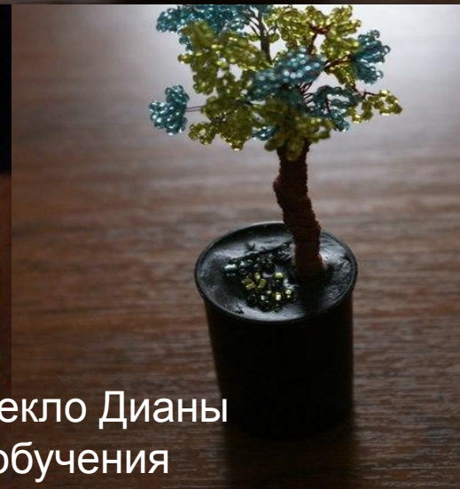
Работы Пекло Дианы 2 год обучения