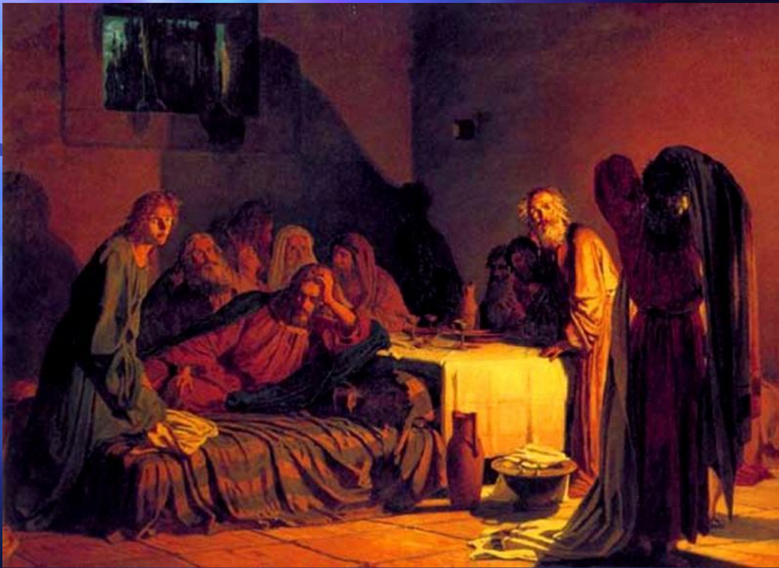
Н.Н.Ге. Тайна вечера