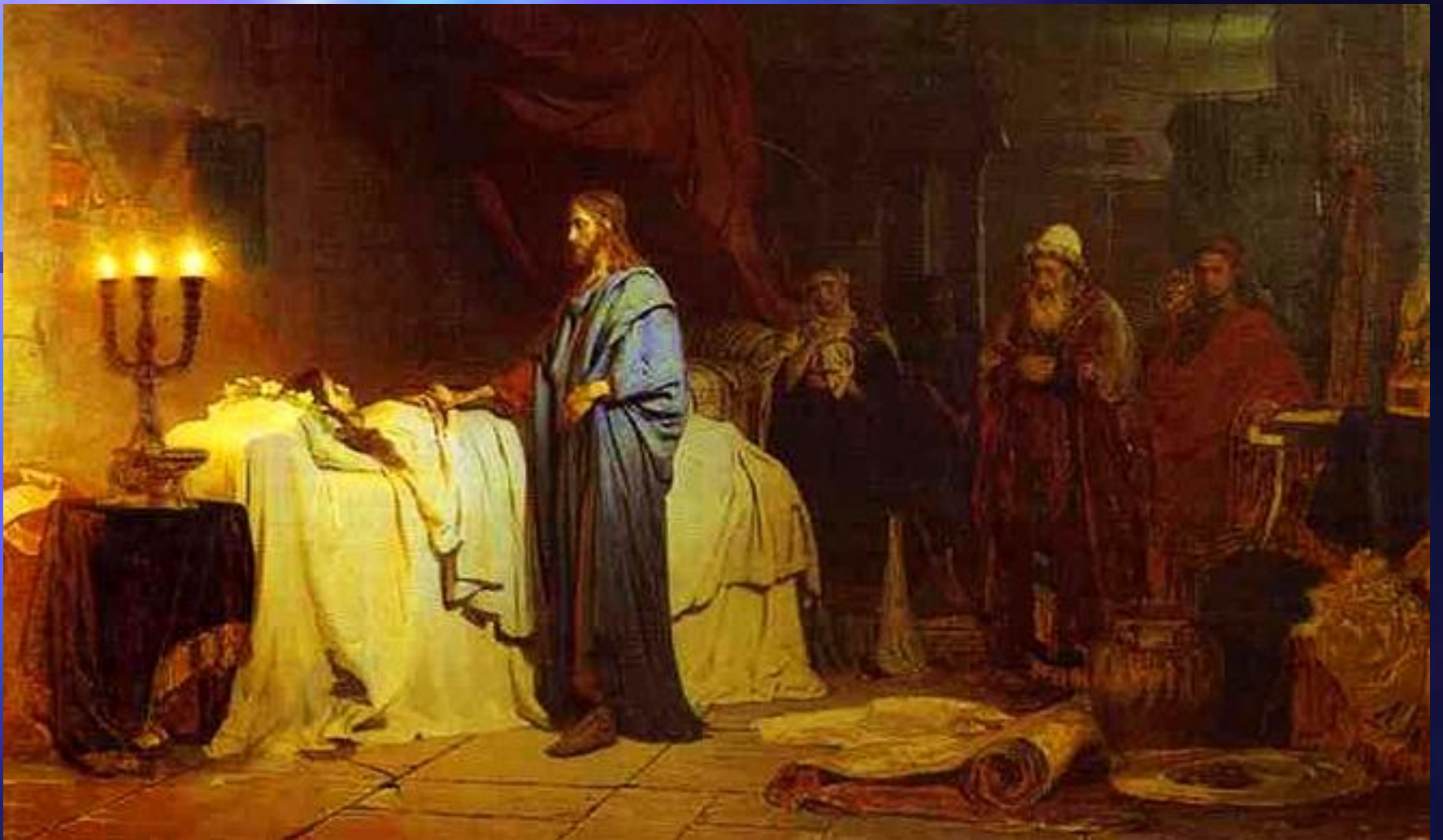
И.Е.Репин. Воскрешение дочери Иаира. 1871