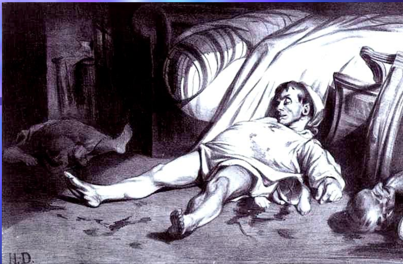
Оноре Домье. Улица Транснонен. 1834 г. Британский музей. Лондон.

Выдающийся мастер литографии (разновидность графики) французский художник Оноре Домье, который ненавидел угнетение и насилие, всегда откликался на злободневные вопросы давая им свою оценку. «Улица Транснонен» была воспринята как протест против террора и насилия. В основу картины легли реальные события революции 1834 г. Из дома №12 по улице Транснонен кто-то выстрелил в солдат, разгоняющих демонстрацию. В ответ солдаты убили всех жильцов дома.