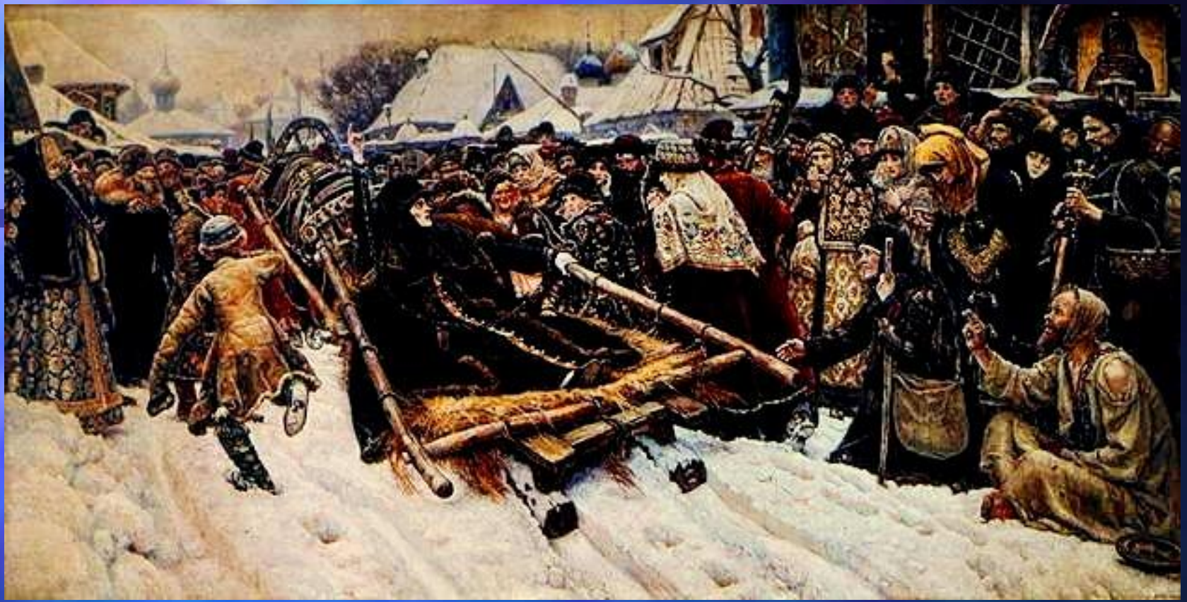
В. И. Суриков. «Боярыня Морозова». 1886 год. Третьяковская галерея.