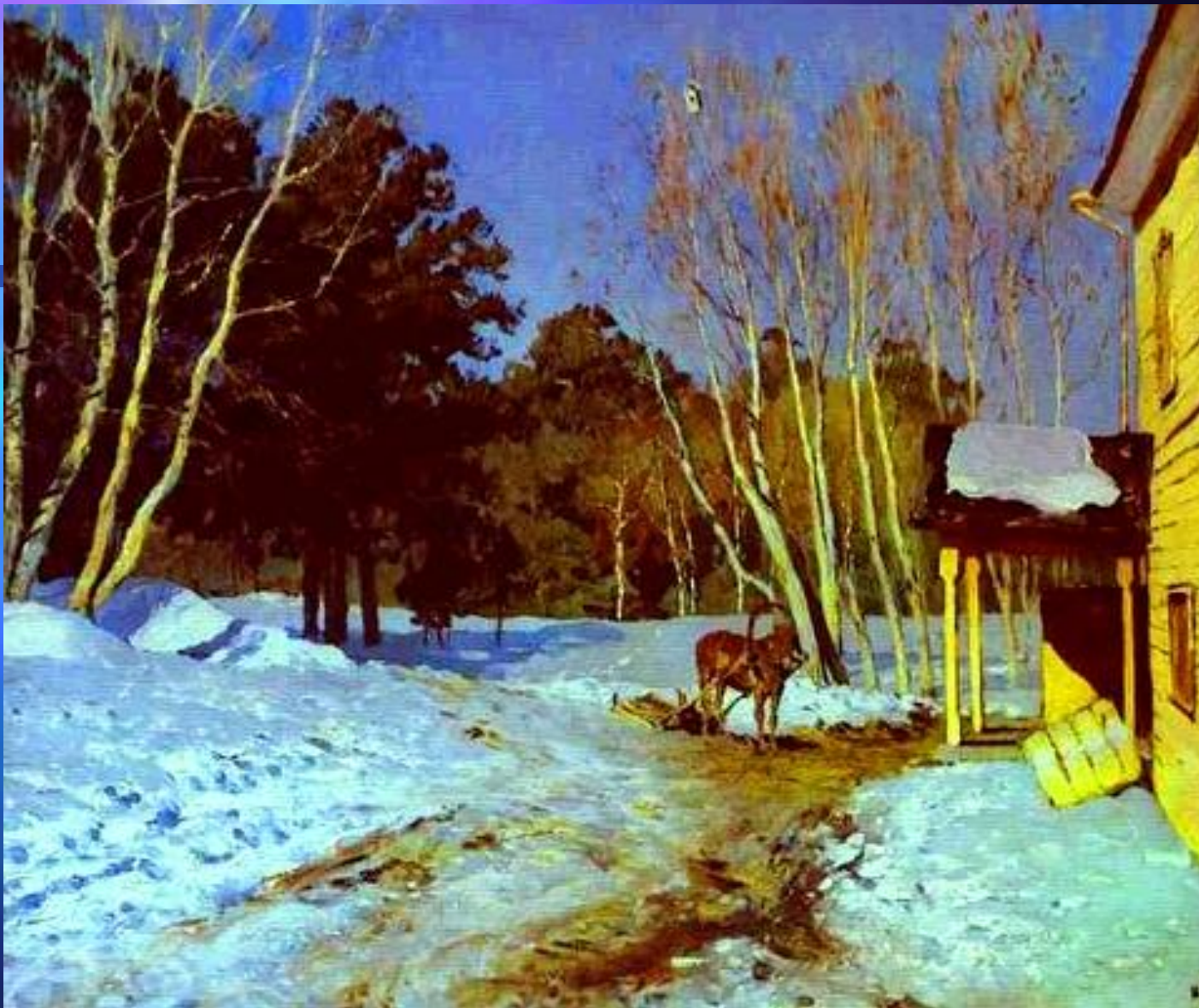
И. И. Левитан. «Март». 1895 год. Третьяковская галерея.