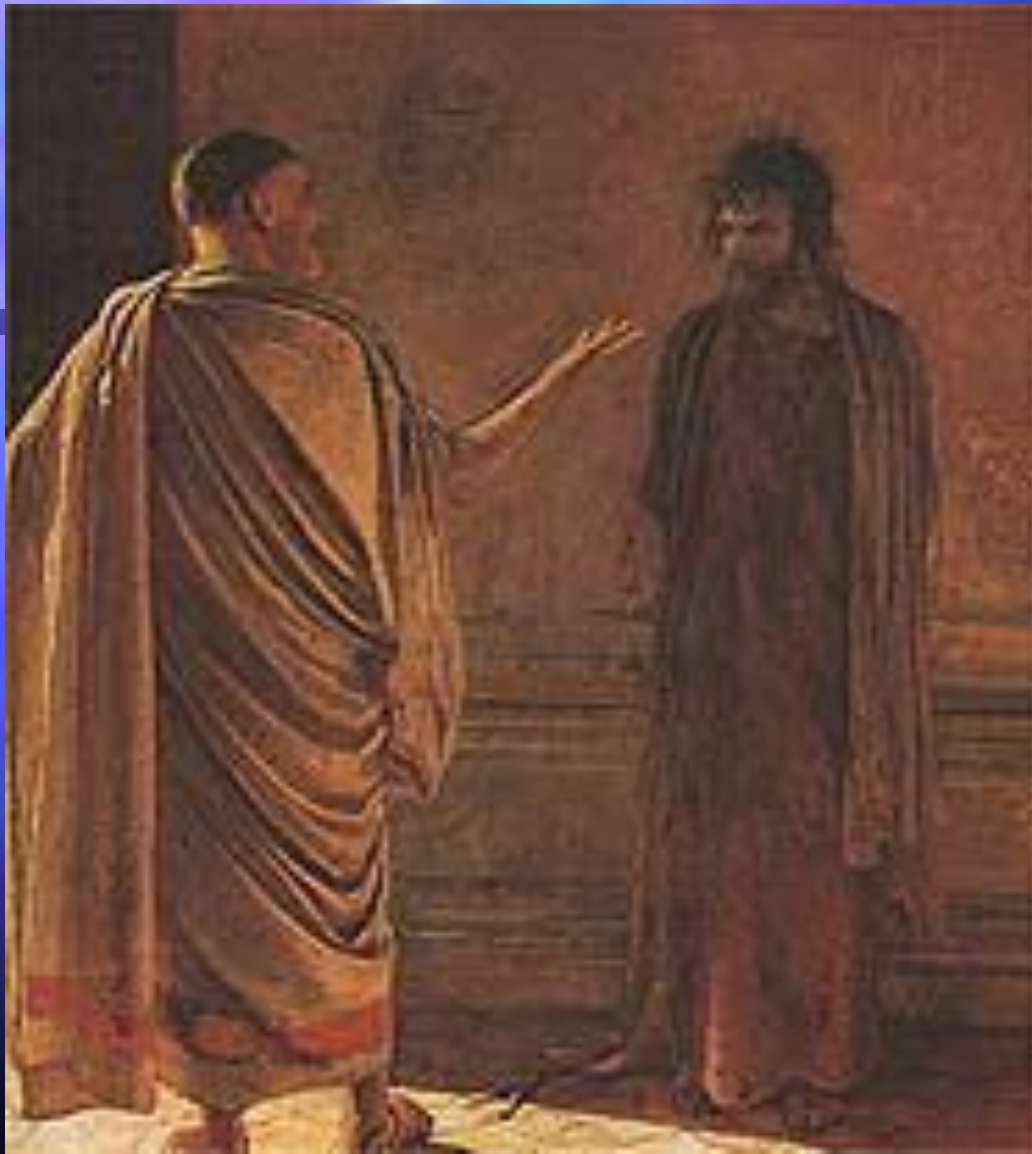
Н.Н. Ге. «Что есть истина?» (Понтий Пилат и Христос). 1890 год. Третьяковская галерея