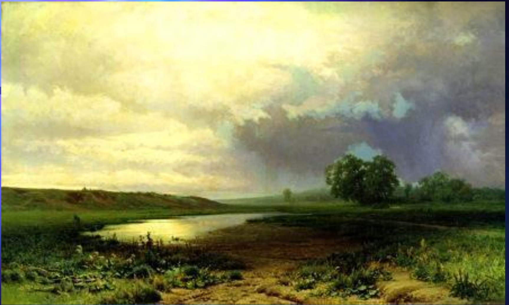
Ф. А. Васильев. «Мокрый луг». 1872. Третьяковская галерея.