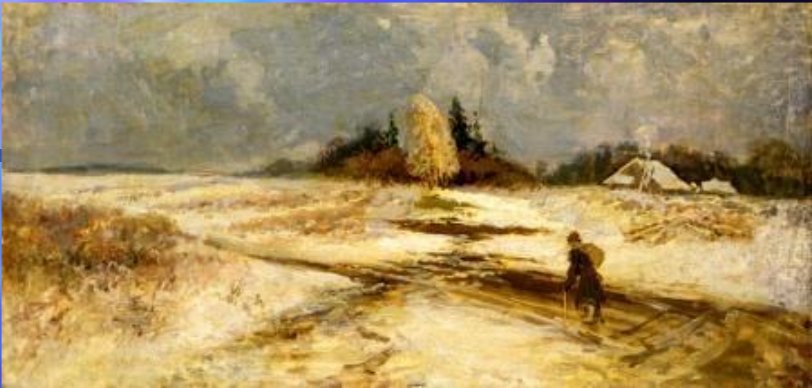
Ф. А. Васильев. Оттепель. 1871 г. Государственная Третьяковская галерея, Москва

Именно такие чувства пробуждает картина Федора Александровича Васильева «Оттепель». Сумрачен и неприветлив заиндеветый от инея лес. Снег уже утратил свою белизну, и на дальние поля легли синеватые тени. Резкие порывы ветра сгибают голые ветви деревьев. Талая вода залила узкую проселочную дорогу. даже луч солнца, сумевший прорваться сквозь мрачные тучи, не в силах изменить тоскливый облик пейзажа. Зброшенной и сиротливой кажется одинокая крестьянская избушка, стоящая в стороне от дороги. Как мучительно медленно пробуждается природа от тяжелого зимнего сна! Но к чувству бесприютности одновременно присоединяется и надежда на скорое весеннее пробуждение жизни. Все потеплело, оттаяло в природе. Пришла долгожданная оттепель..