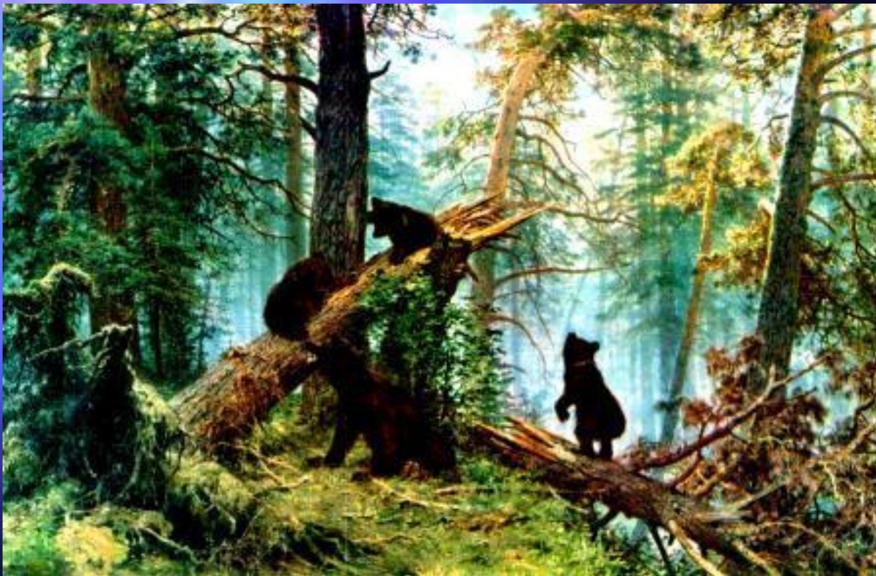
И. И. Шишкин. «Утро в сосновом лесу». 1889. Третьяковская галерея.