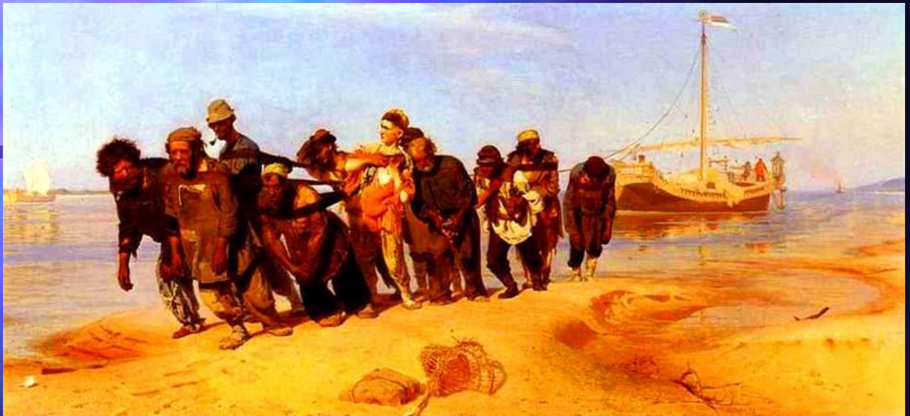
И.Е.Репин Бурлаки на Волге.