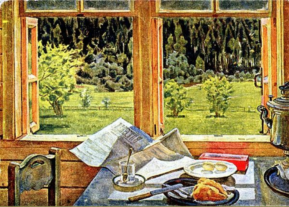
«Окно в природу»