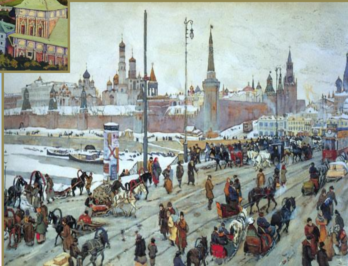
«Москворецкий мост. Старая Москва»