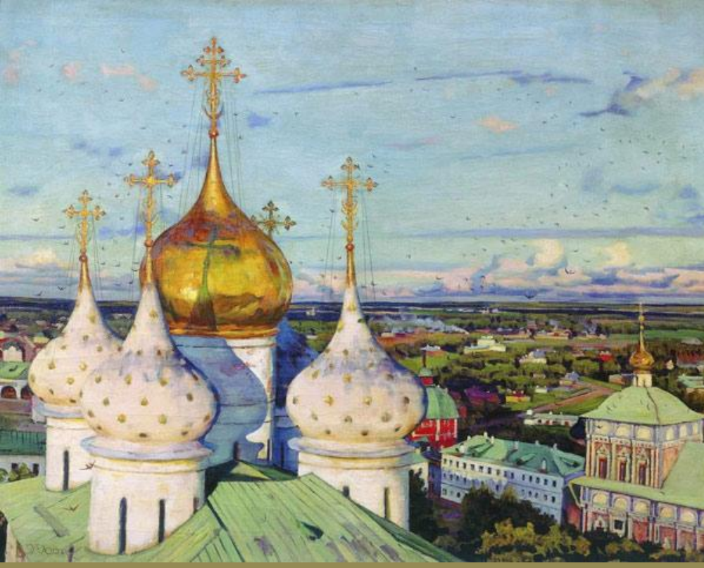
«Купола и ласточки»