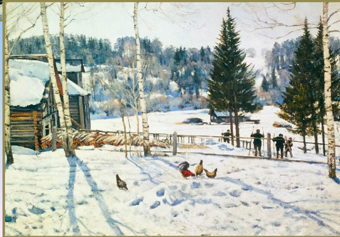
«Весенний солнечный день»