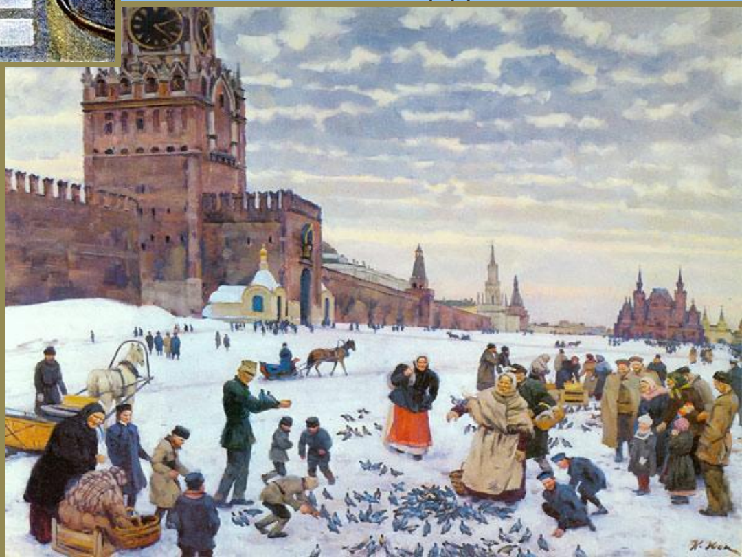
«Кормление голубей на Красной площади»