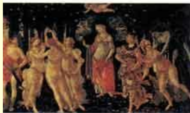
С. Боттичелли. Весна