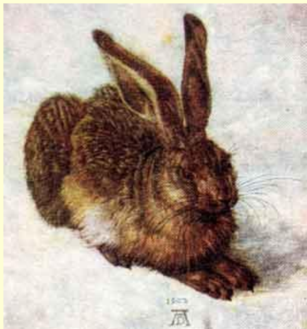
А. Дюрер. Кролик.

Это изображение животных «анимал» (лат.) «животное». Этот жанр возник ещё у первобытных художников. Они изображали сцены охоты на оленей, мамонтов, бизонов. В Россию анималистический жанр пришёл лишь в 19 веке. Художники :Суриков, А. Дюрер, В. Ватагин, В. Сутеев, Е. Чарушин.