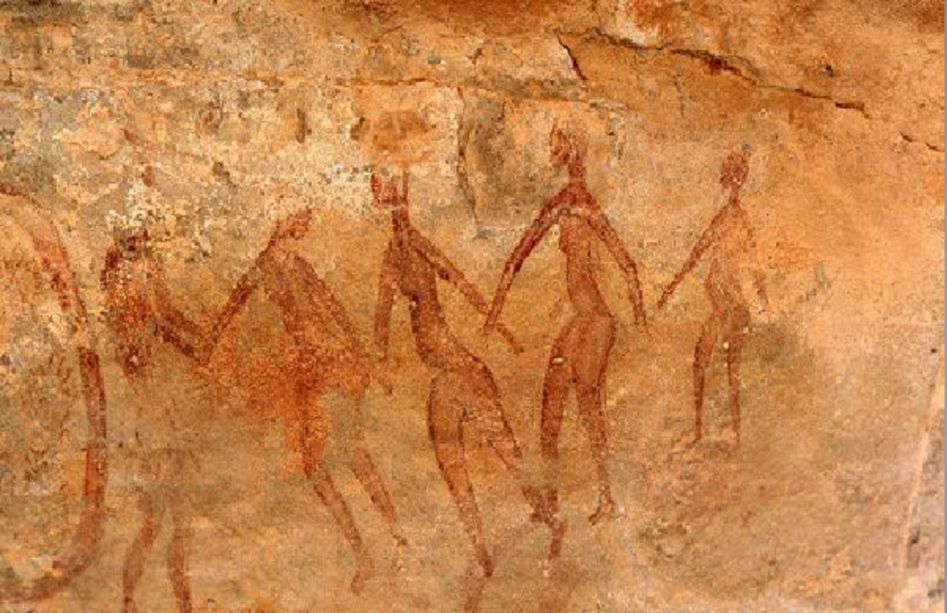
Танцующие женщины, 6-7 тыс. до н.э. плато Тассилин-Аджер.