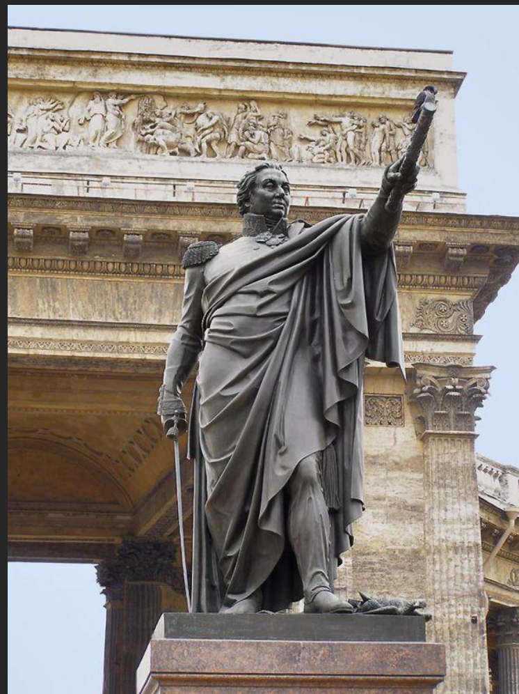
Б. Орловский, архитектор В. Стасов Памятник М.И.Кутузову. 1837