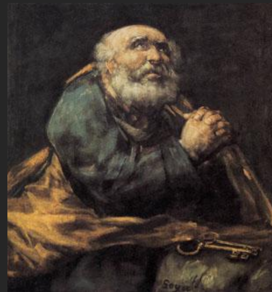
Ф. Гоя. Раскаяние святого Петра. 1825