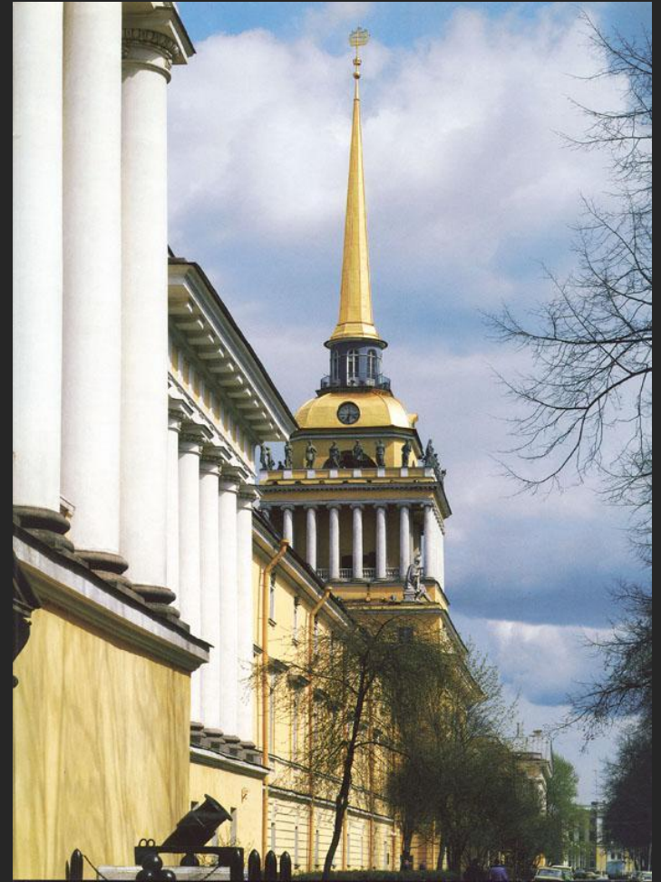
Коробов, А. Захаров, скульпторы И. Тербенев, Ф. Щедрин Адмиралтейство. 1728–1823