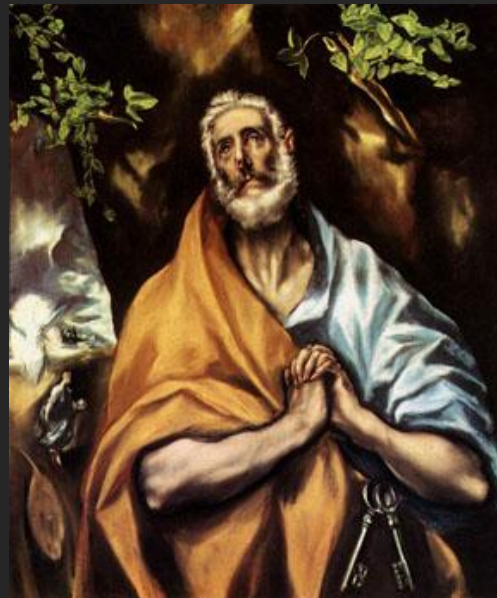
Эль Греко. Раскаяние святого Петра. 1605

Количество ключей у святого Петра – это метафора, с помощью которой творцы искусства пытаются подсказать нам, что путь в райские кущи не один.