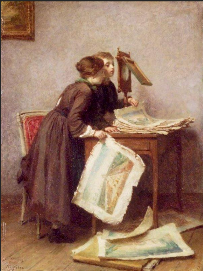
Э. Фрер. Дети, рассматривающие гравюры. 1855

Многоканальная модель освоения культурного наследия