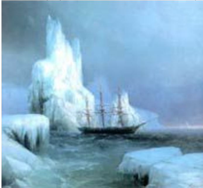
"Ледяные горы" 1870

АИВАЗОВСКИЙ, КАК НИКТО ДРУГОЙ СУМЕЛ ПОКАЗАТЬ ЖИВУЮ, ПРОНИЗАННУЮ СВЕТОМ, ВЕЧНО ПОДВИЖНУЮ ВОДНУЮ СТИХИЮ.