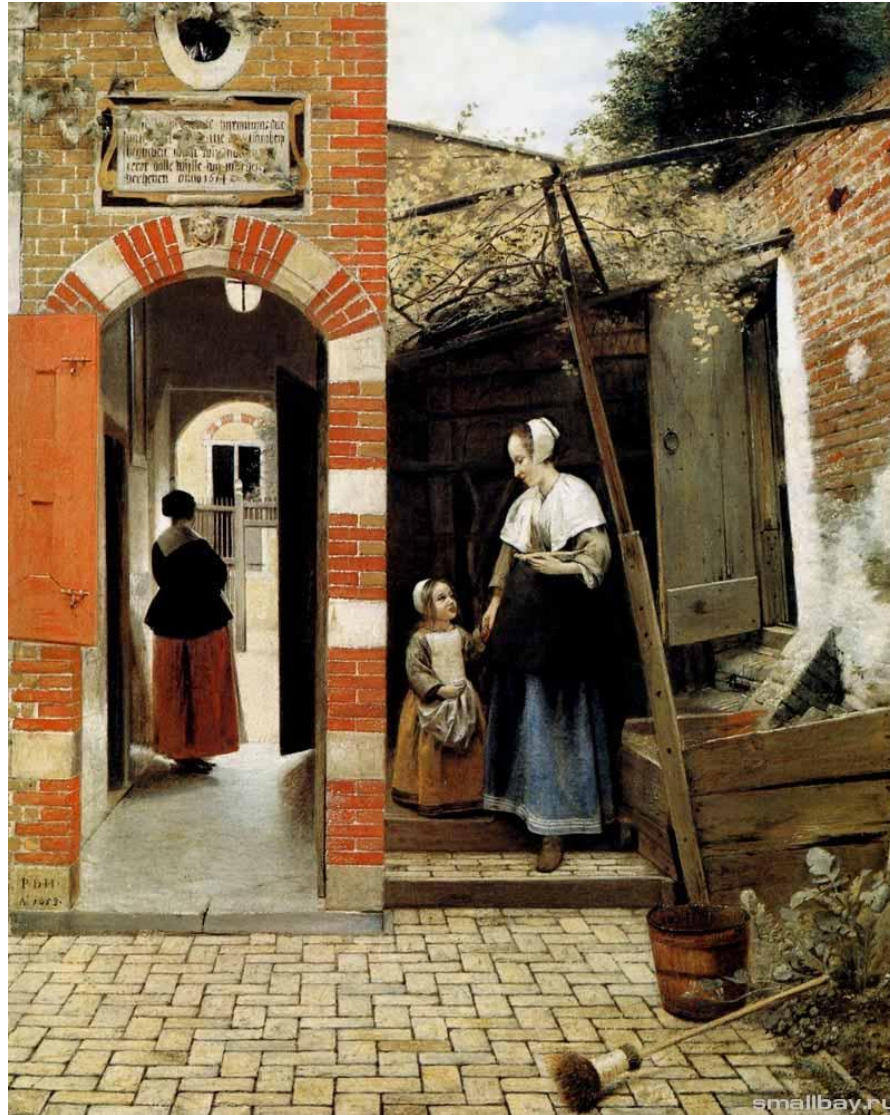
Западный дворик. 1568