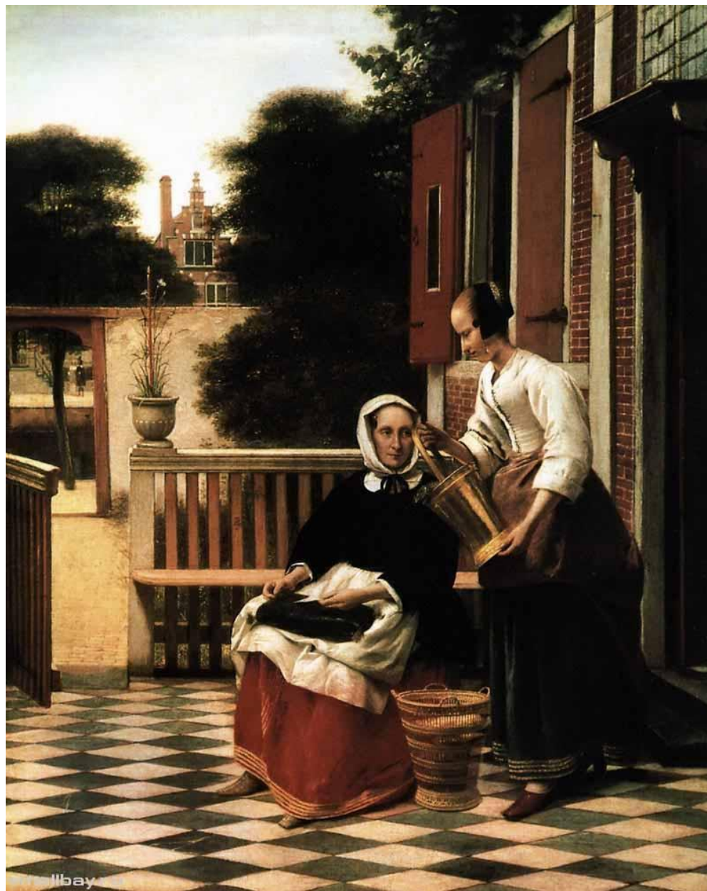
Хозяйка и её служанка. 1657