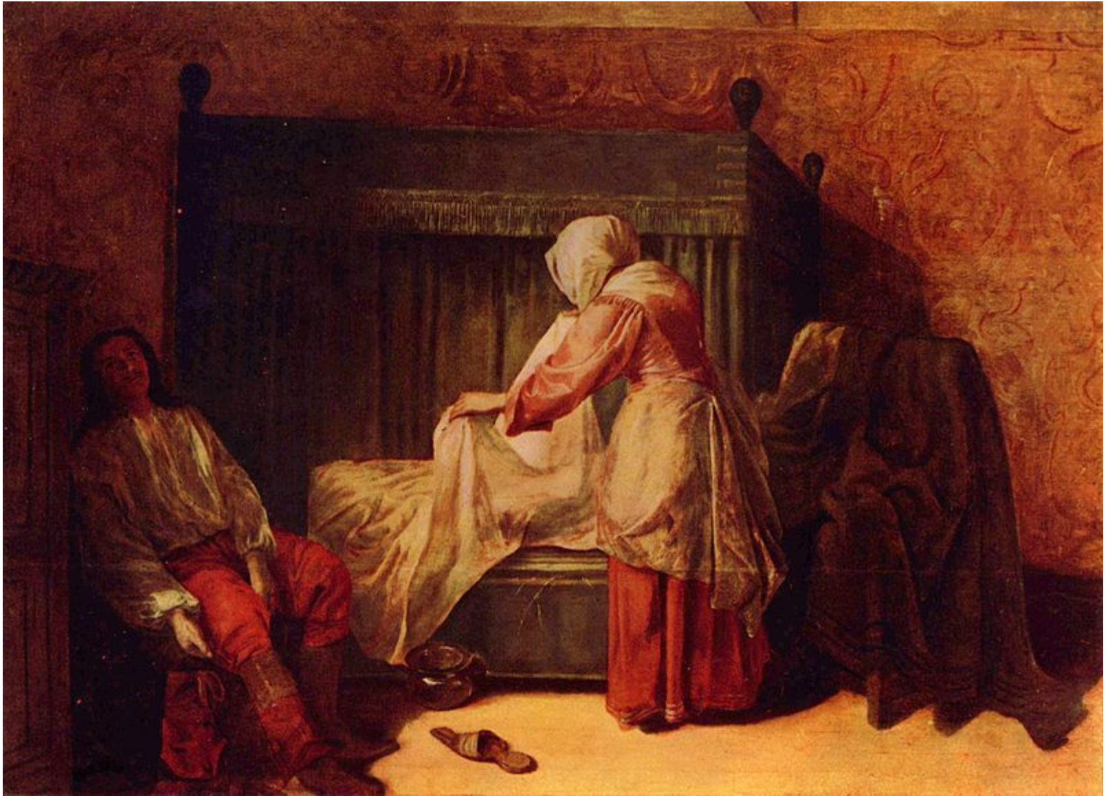
Утро молодого человека. 1655-1657.