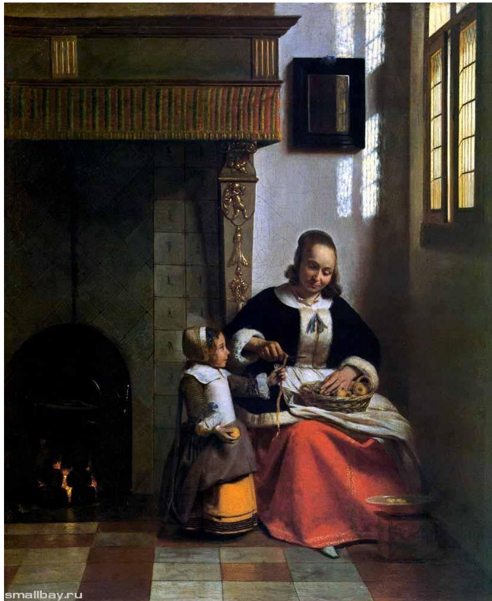
Женщина, чистящая апельсин.1663.