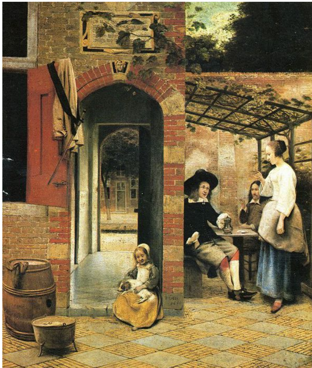
Два пьющих вино мужчины и женщина в беседке. 1658.