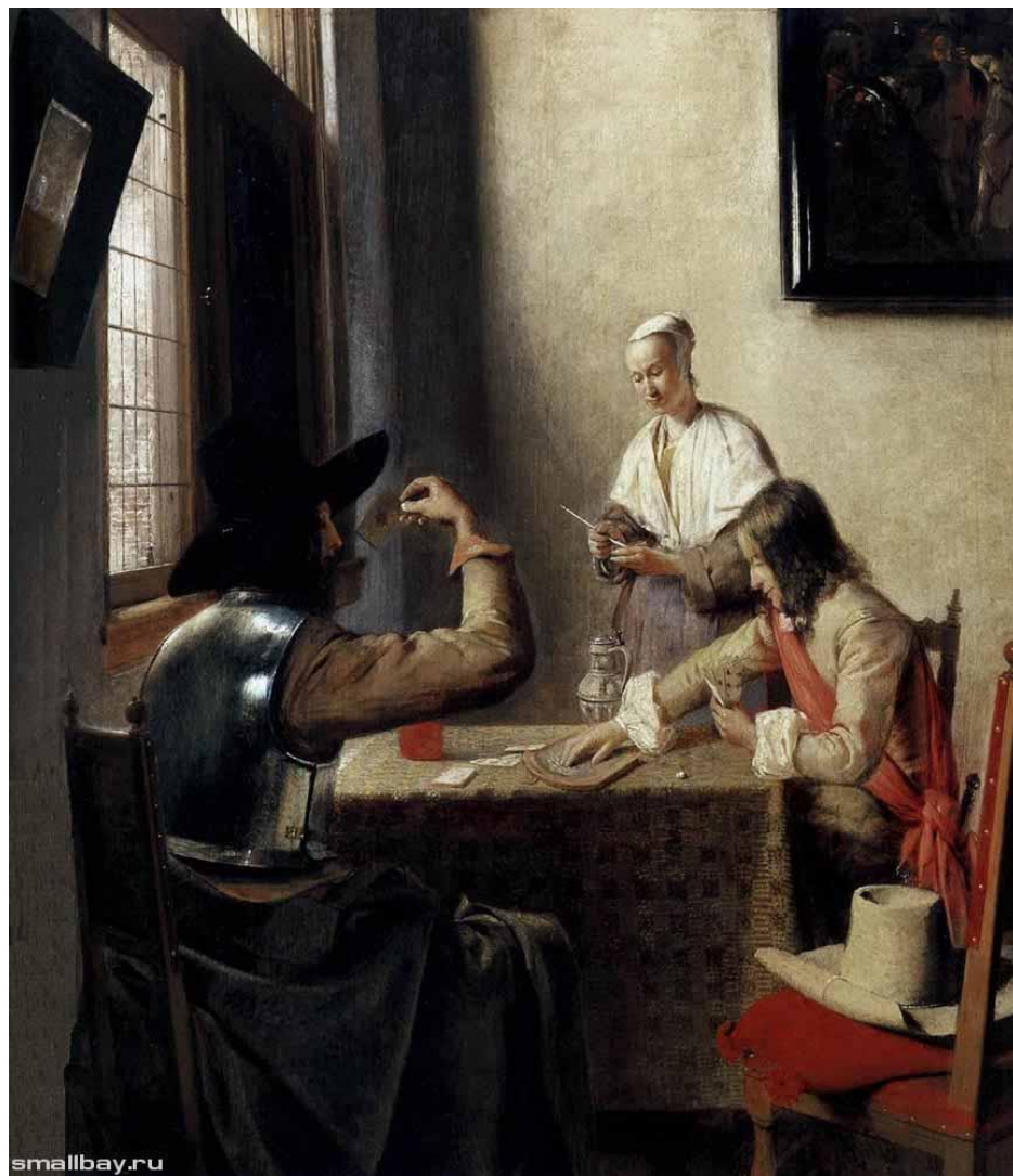
Солдаты, играющие в карты. 1658.