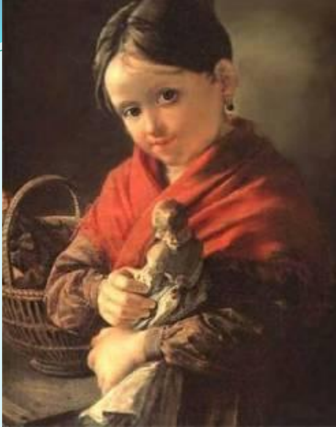
Тропинин «Девочка с куклой»