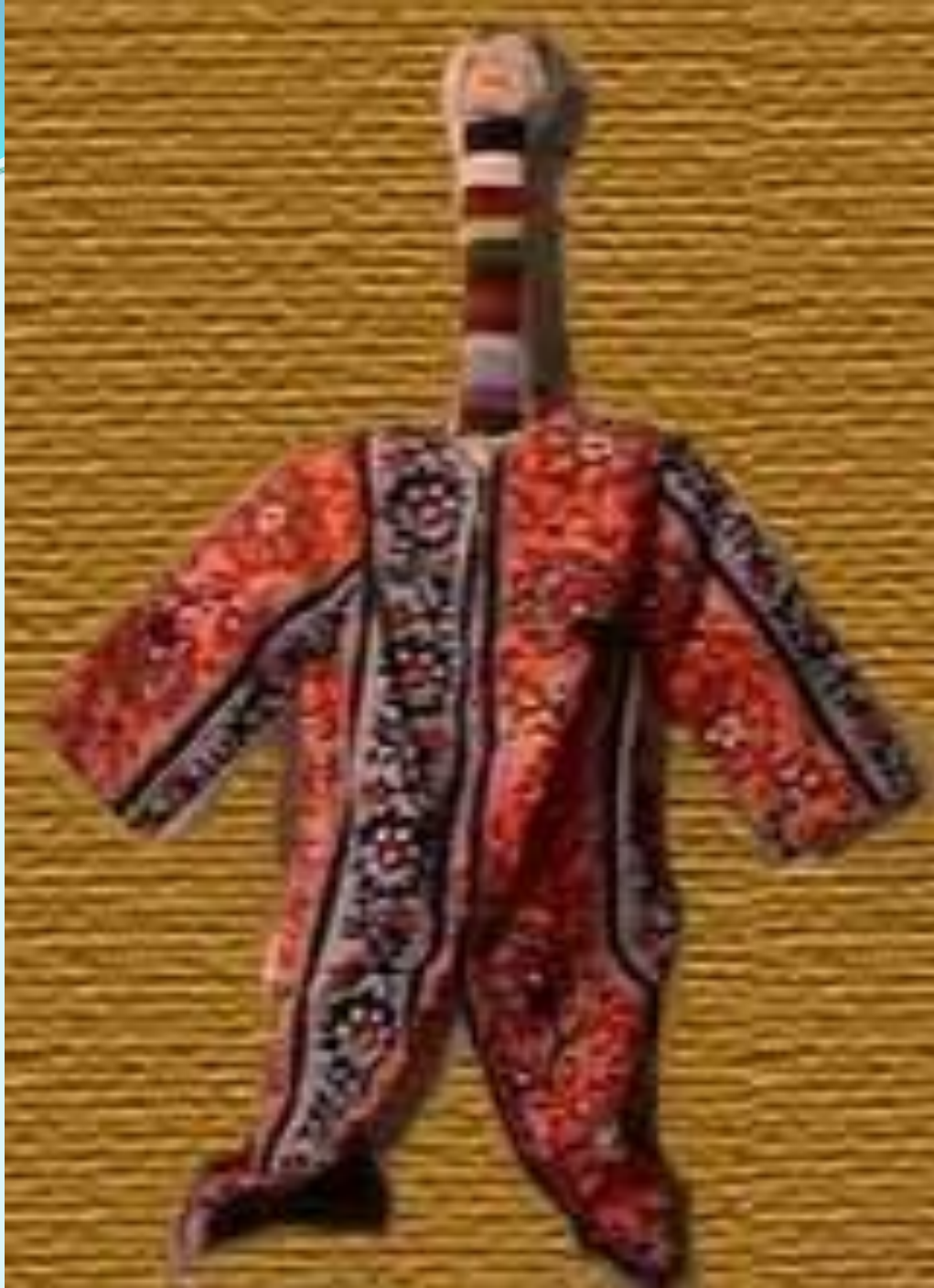
Таджикская кукла «Лухтак»