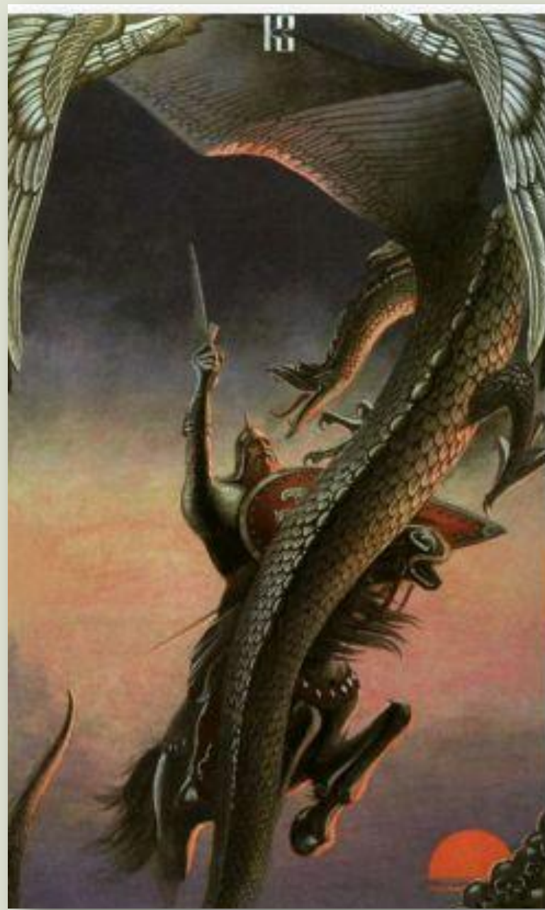
Константин Васильев «Бой со Змием» 20в.