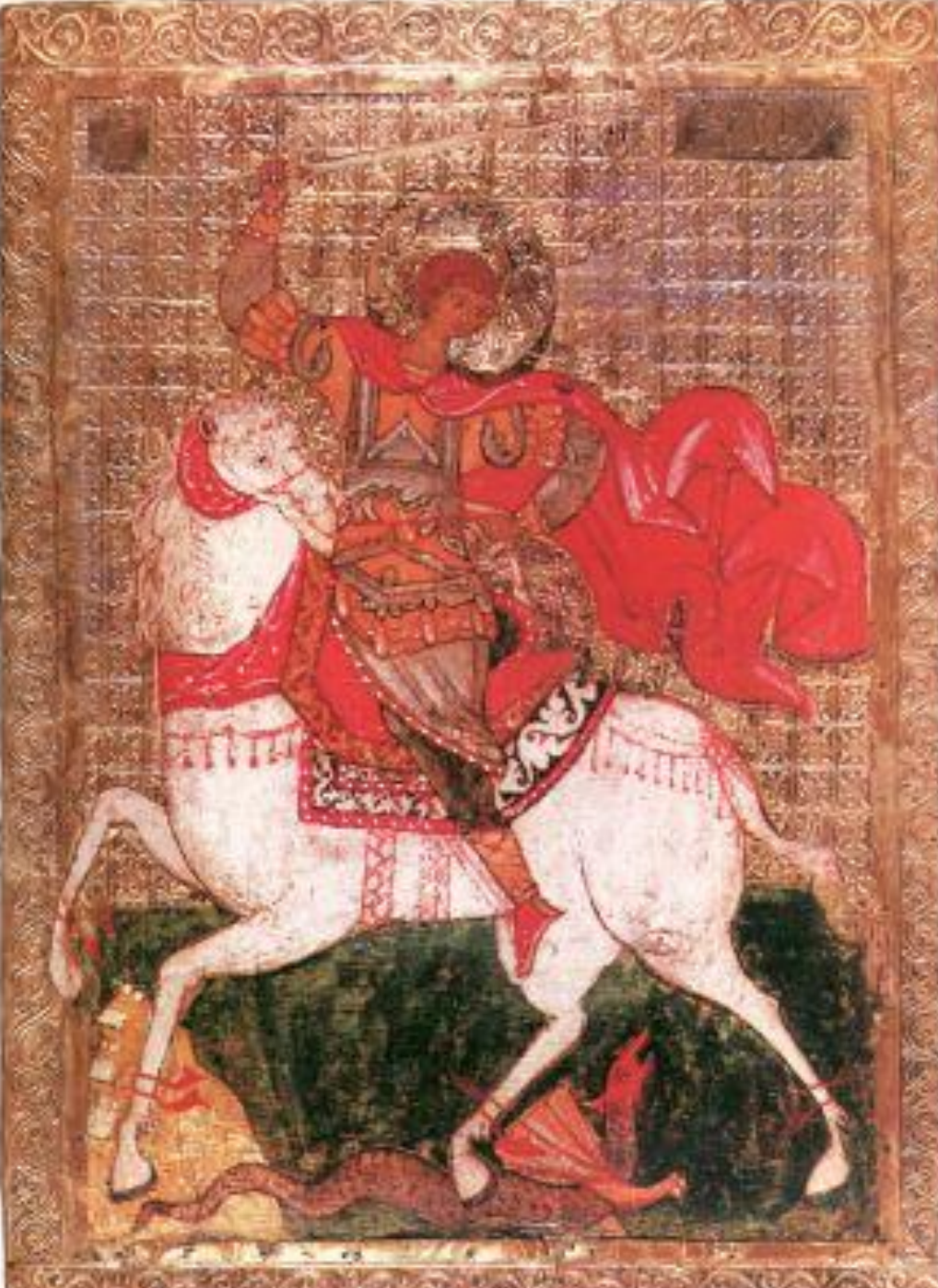
Чудо Георгия о Змие, 15в