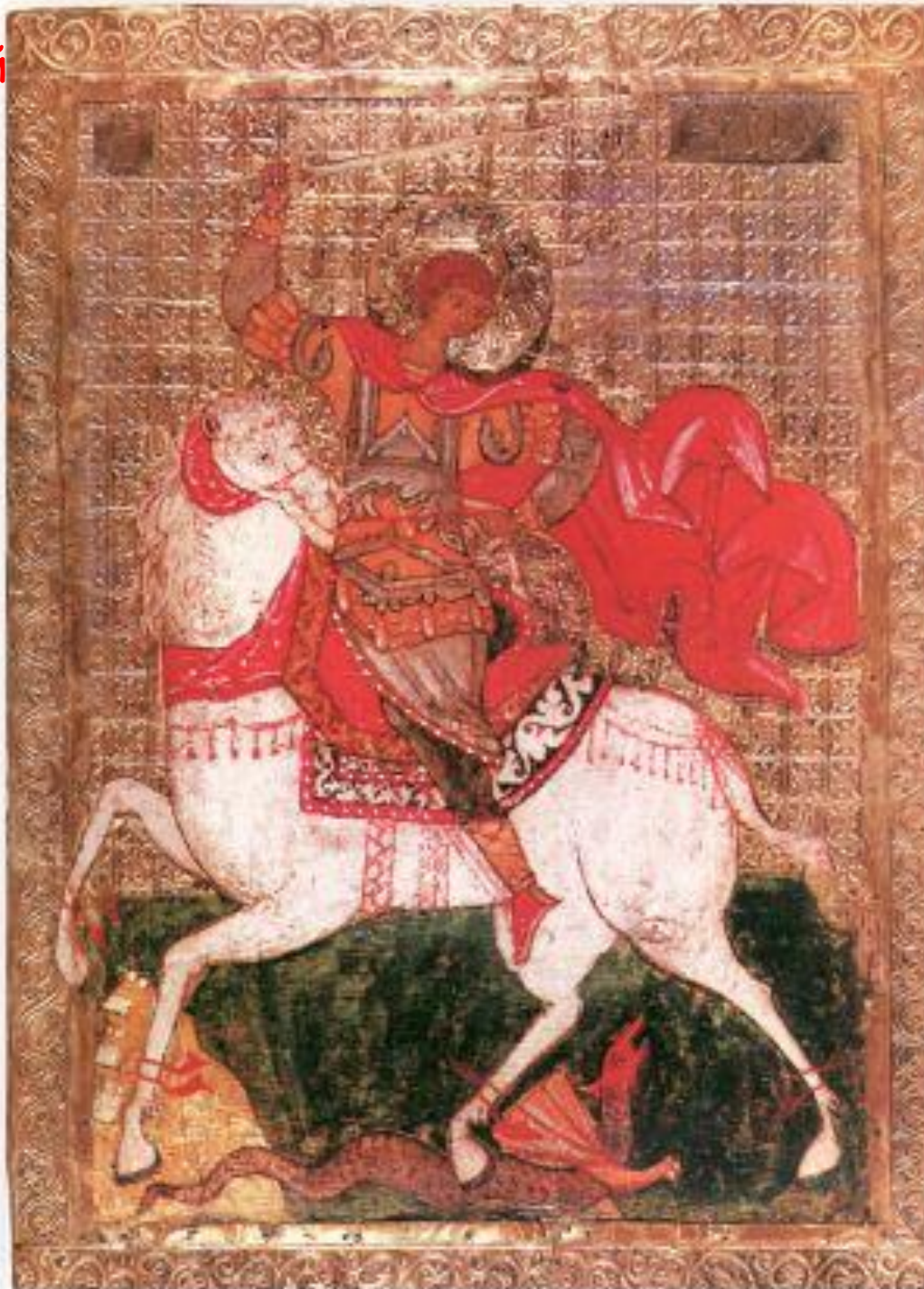
Чудо Георгия о Змие, 15в