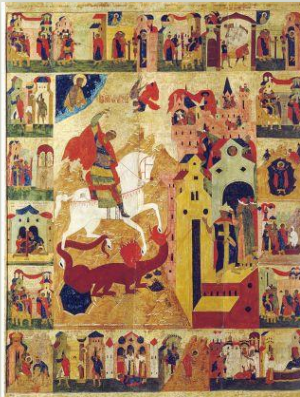
Житийный образ Георгия- Победоносца 16в.