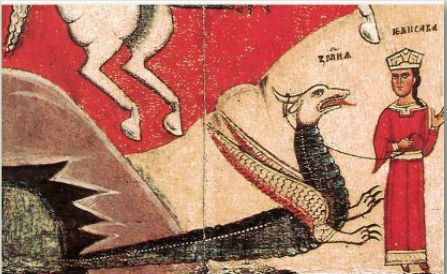
Царевна Елисава ведет Змия