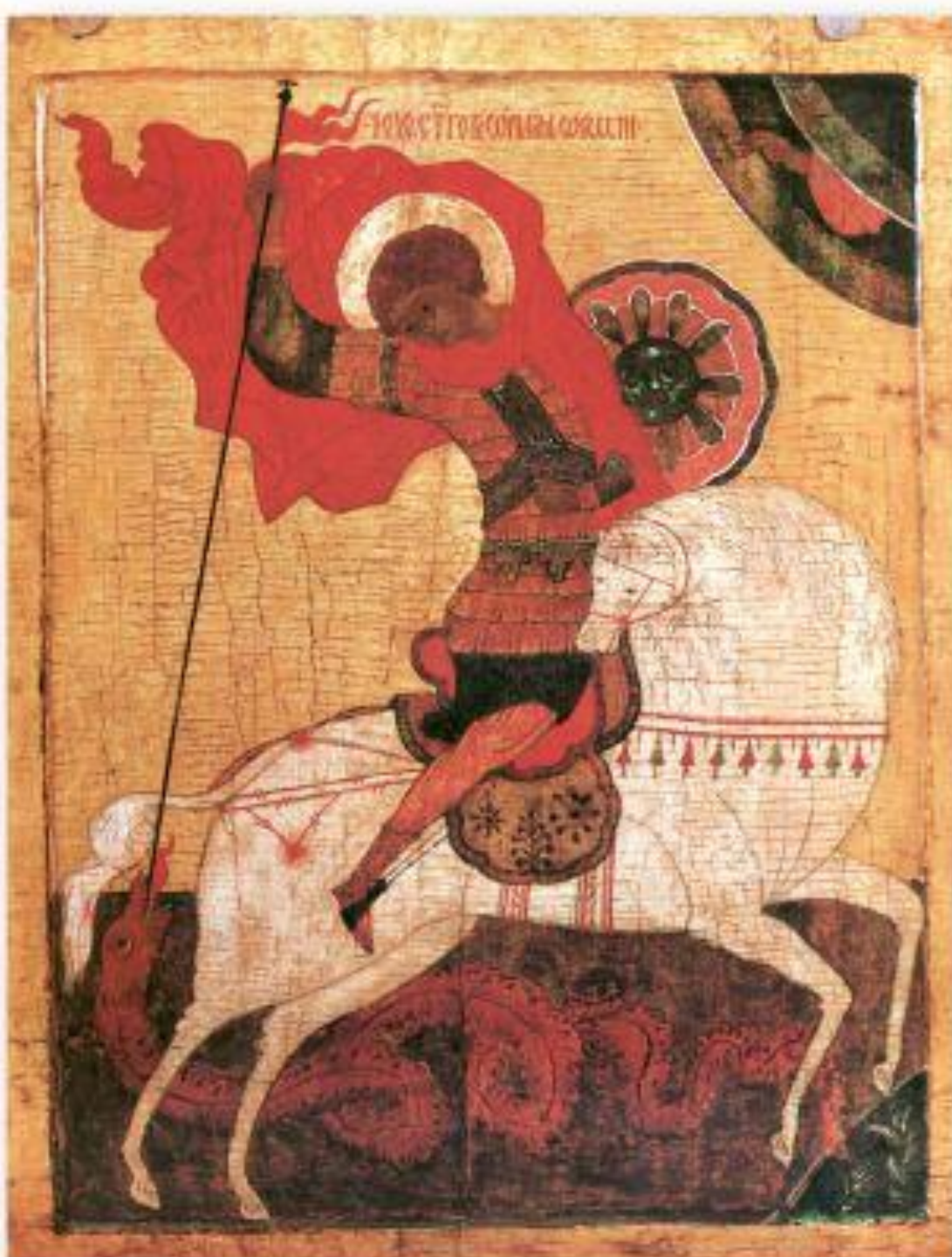
Новгородский образ - Чудо Георгия о змие 15в.