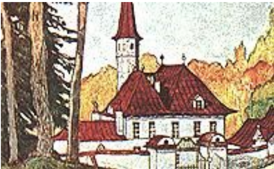
Добужинский М.В. Гатчино Приорат 1914 г