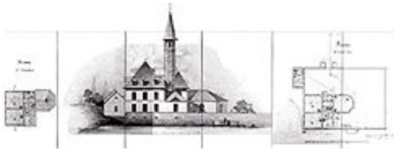
Дмитриев Н.В. Чертежи дворца