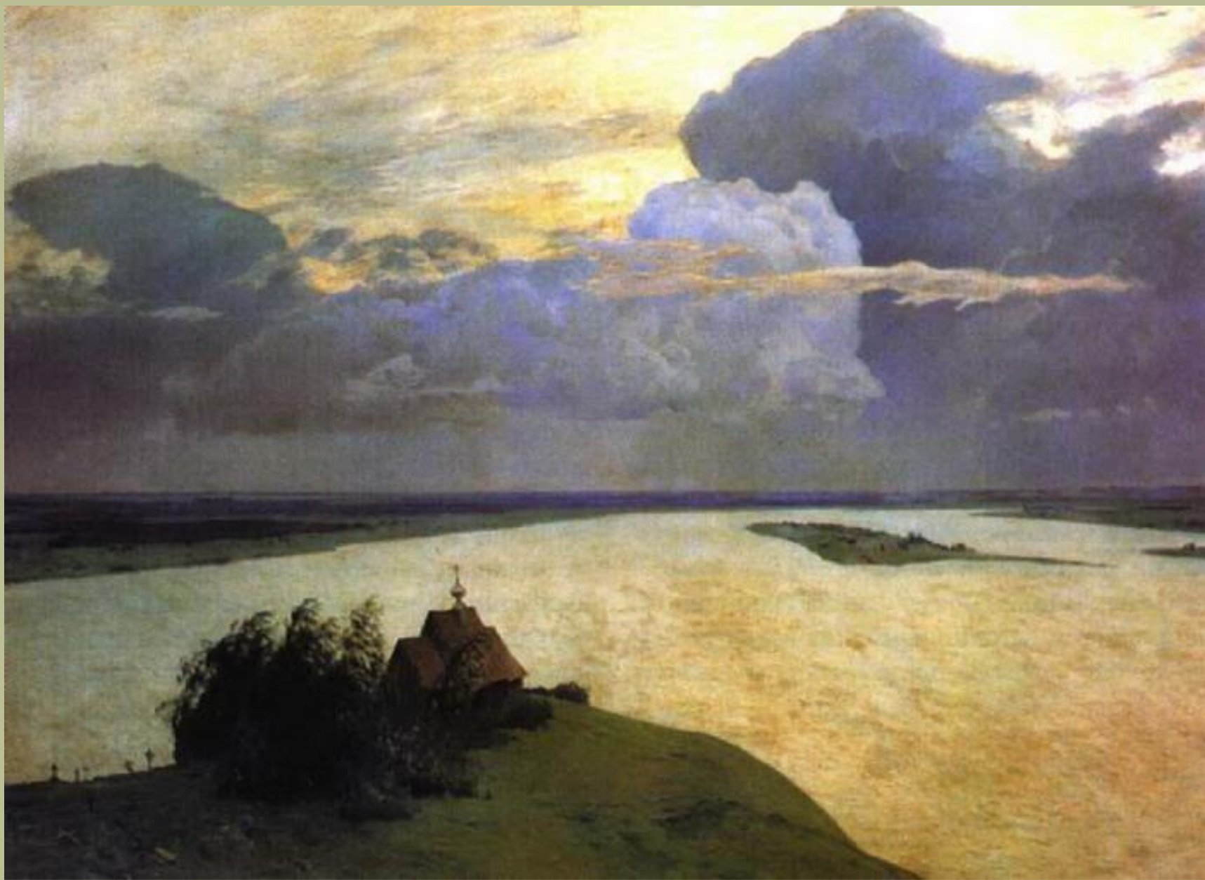
Исаак Ильич Левитан. «Над