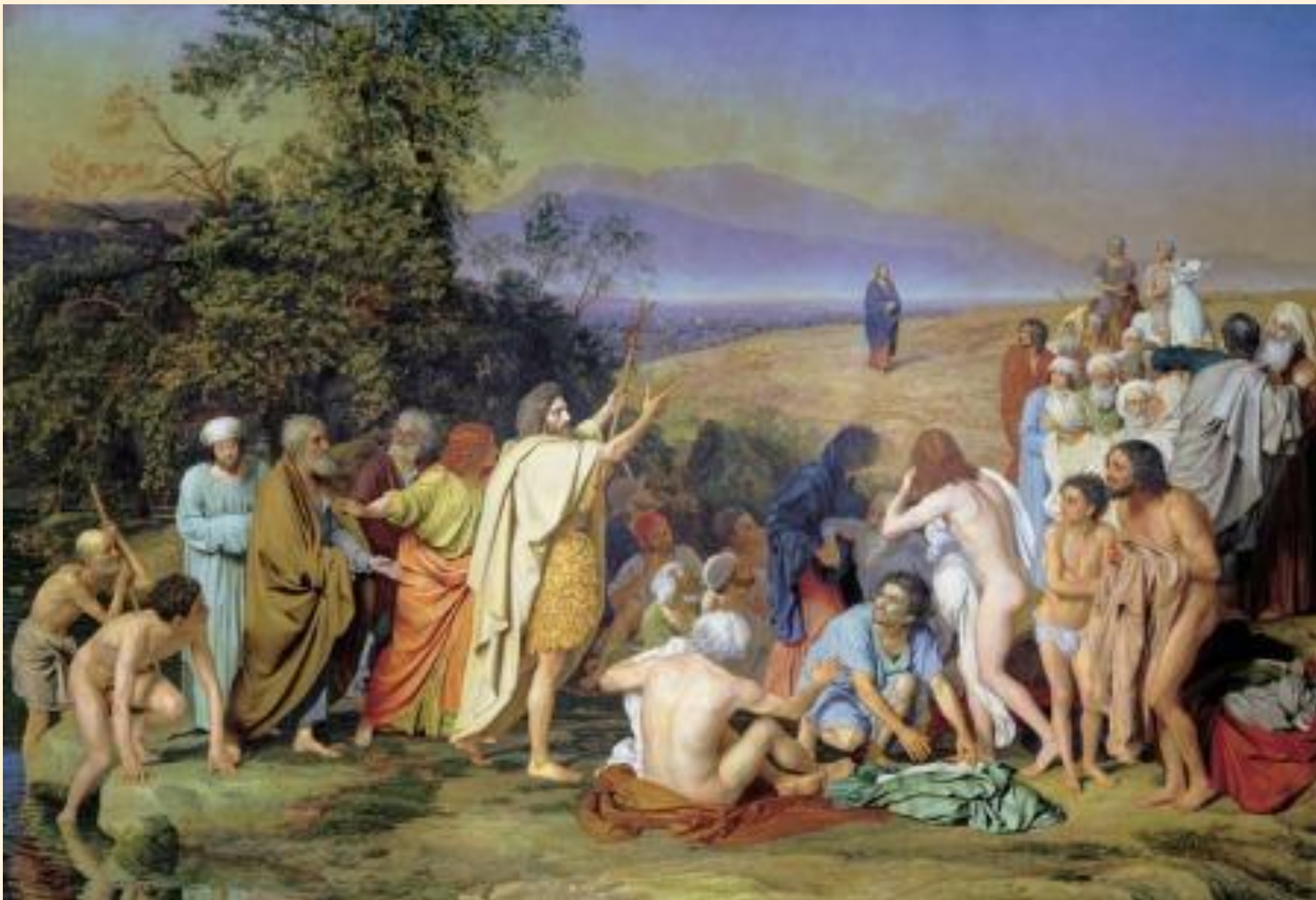
Явление Христа народу. Иванов А. А.