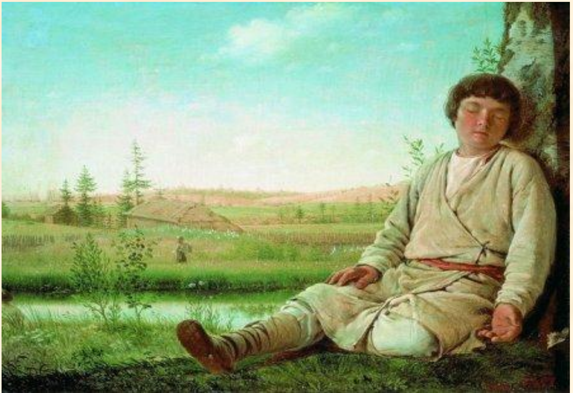
Спящий пастушок. Венецианов А. Г.