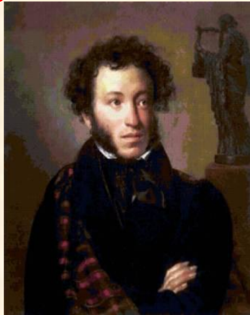
Кипренский О. А.