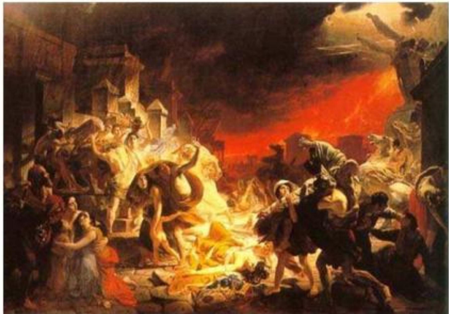
Брюллов: Последний день Помпеи