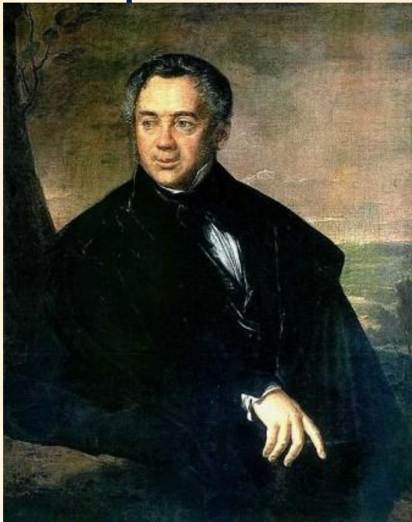
Тропинин В. А.