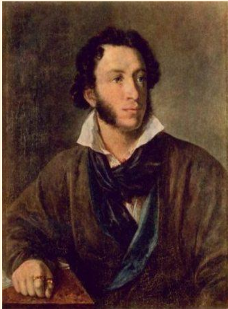
Тропинин В. А.