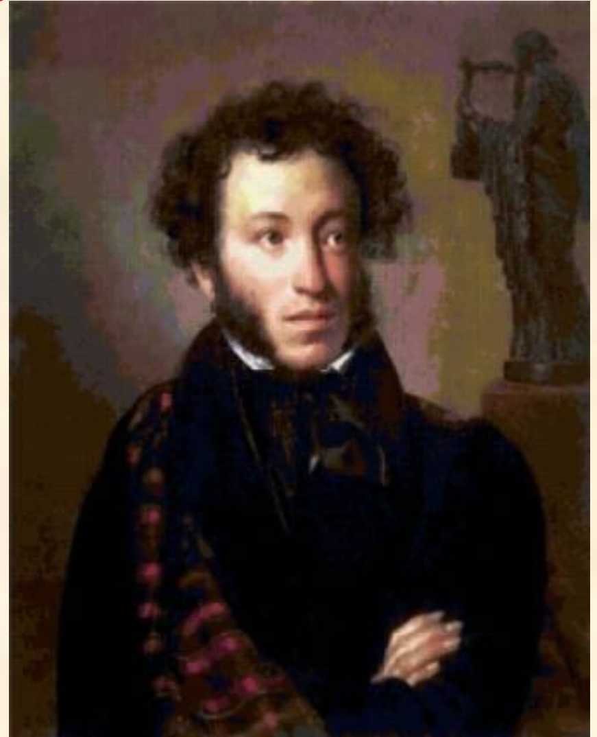
Кипренский О. А.