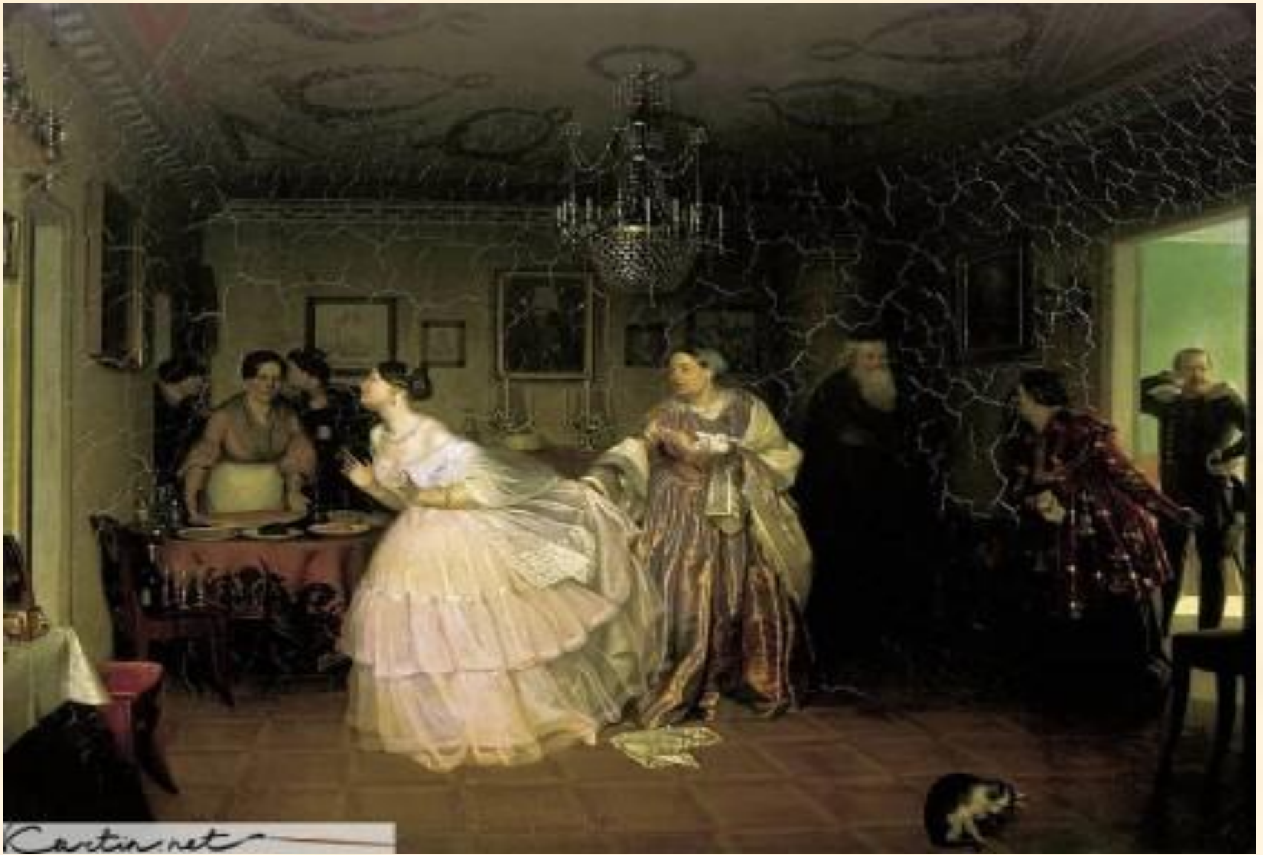
Сватовство майора. Федотов П. А.