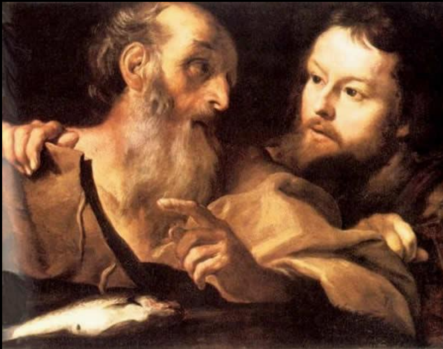
Святой Андрей (Эндрю) и Святой Томас Масло, холст 59 x 76 см Лондонская национальная галерея