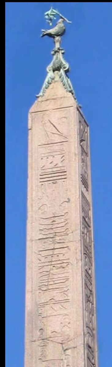
Фонтан Четырех Рек на площади Навона в Риме