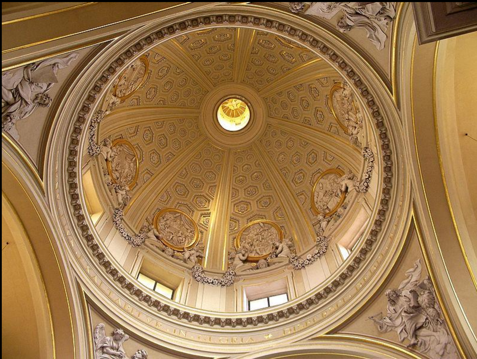
Купол храма в Капель-Гандольфо Приходская церковь, посвященная Святому Томасу Вильянове была разработана Бернини (1658—1661) по заказу Киджи — папы римского Александра VII. Она имеет квадратный план и в ней размещена известная черта Пьетро да Кортоня изображение Распятия на кресте Христа..