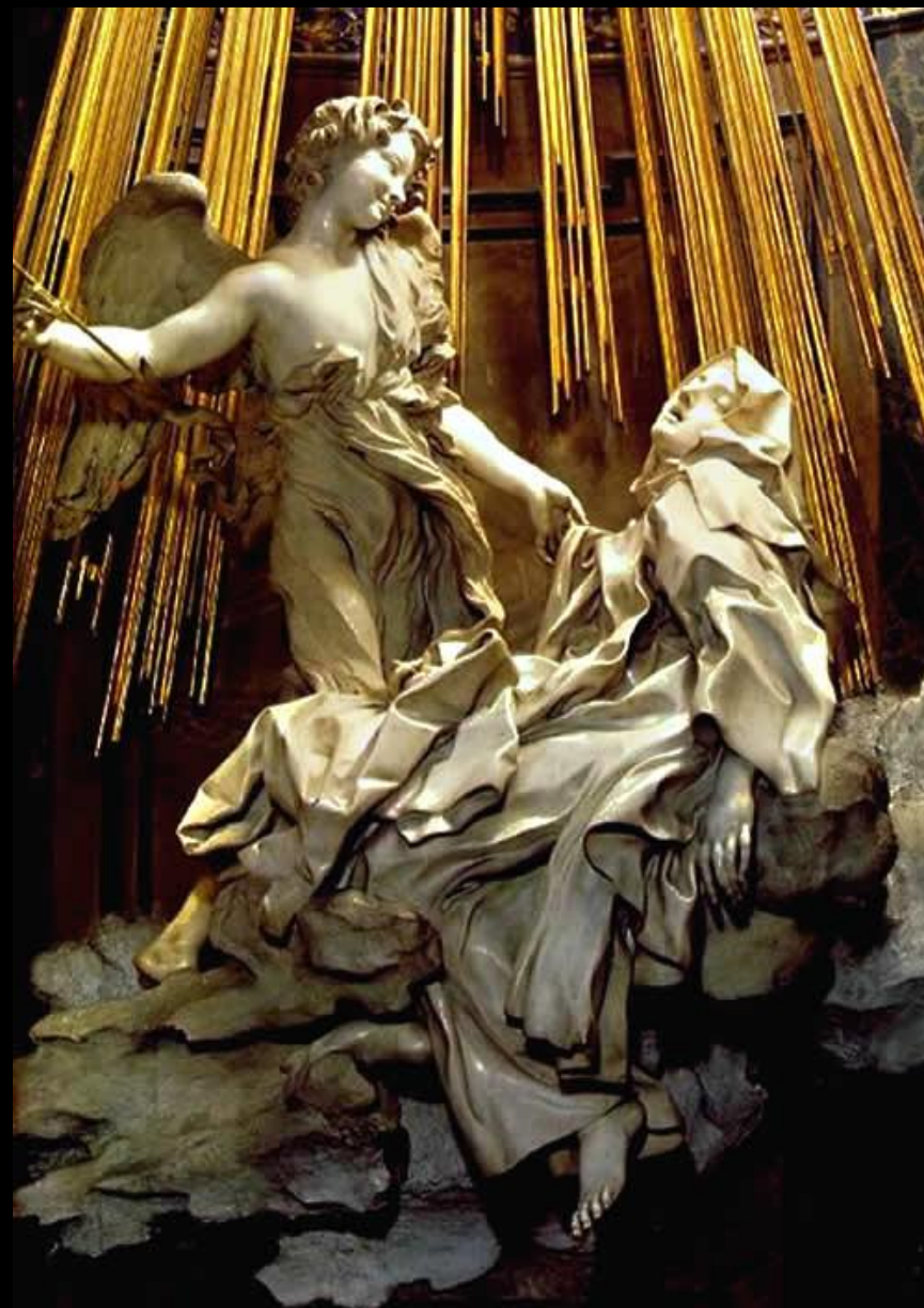
В капелле Корнаро, в Церкви Санта Мария делла Виттория находится алтарная группа «Экстаз святой Терезы», выполненная в 1652 г. Бернини. Тереза, которой в состоянии экстаза является ангел с золотой стрелой, полулежит на мраморном облаке.