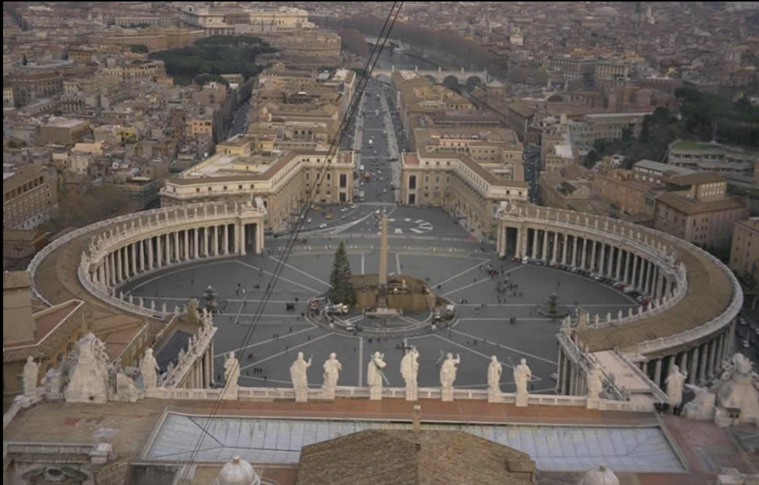
Колоннада собора святого Петра в Риме

Площадь обрамляют спроектированные Бернини полукруглые колоннады тосканского ордера. Посередине — египетский обелиск, привезённый в Рим императором Калигулой. Это единственный обелиск в городе, который простоял в неизменном виде вплоть до Возрождения. Средневековые римляне полагали, что в металлическом шаре на вершине обелиска хранится прах Юлия Цезаря. От обелиска по брусчатке расходятся лучи из травертина, устроенные так, чтобы обелиск выполнял роль гномона.