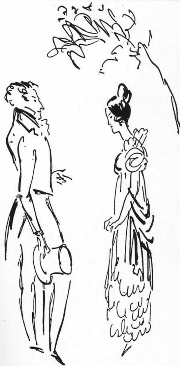
Татьяна и Онегин.