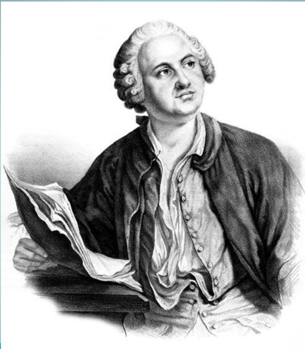
Михаил Ломоносов (1711-1765)