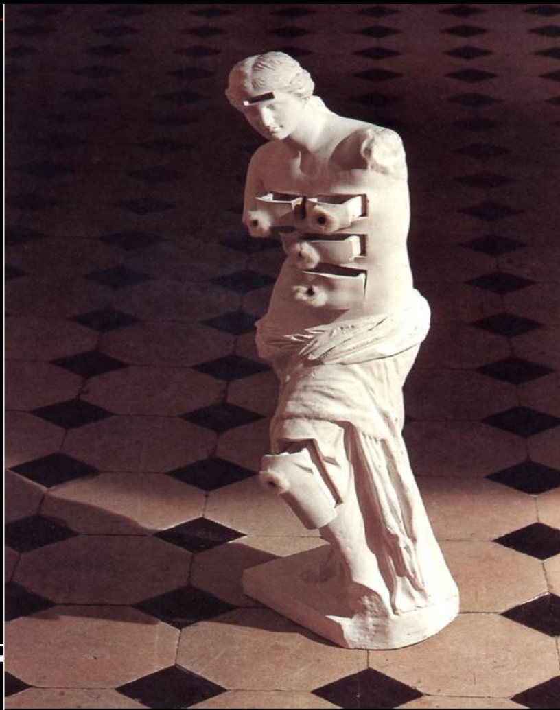
Венера Милосская с ящичками, 1936. Гипс.