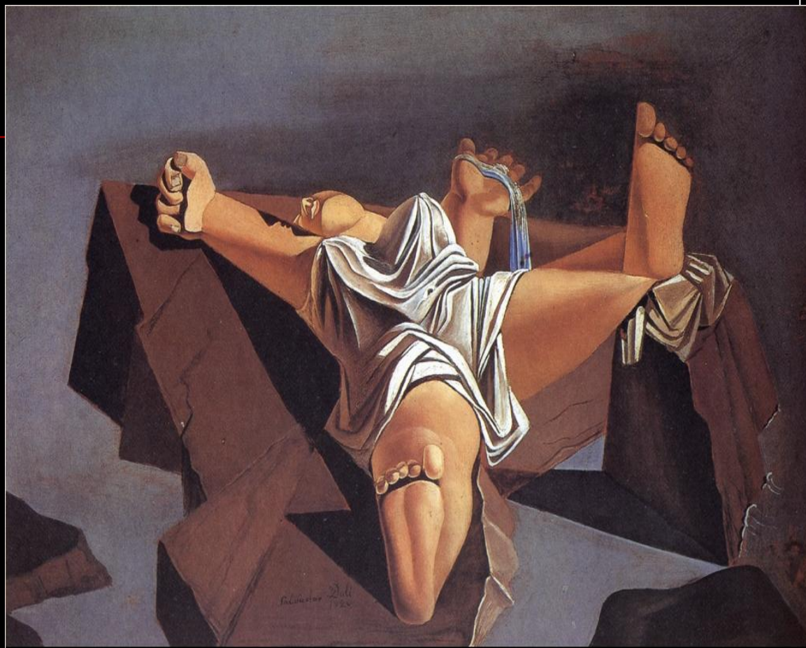
Плоть на камнях, 1926. Дерево, масло.

Данное полотно выполнено в несвойственной Сальвадору кубистической манере, как и ранее написанный «Кубистический автопортрет» (1923). Кроме того, Сальвадором были написаны и несколько портретов Пикассо.