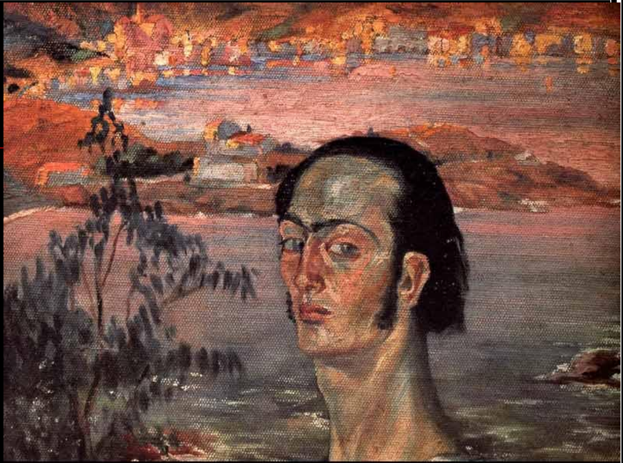
Автопортрет с рафаэлевской шеей, ок. 1920-1921. Холст, масло.

Это одна из первых работ Сальвадора. Выполнена в импрессионистском стиле.