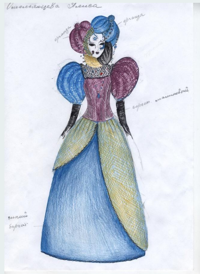
Придворная дама Короля карнавала