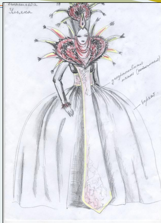
Пиковая дама или королева карт