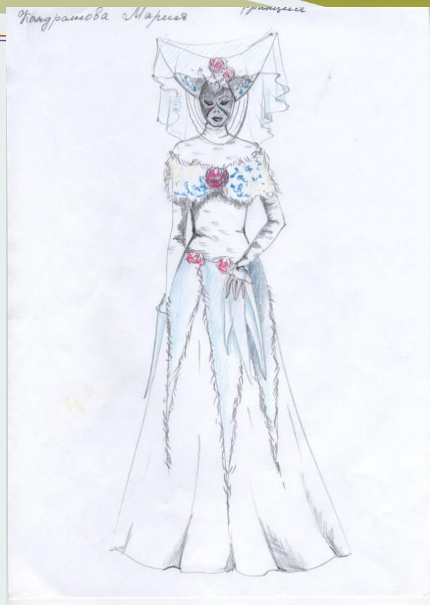
Участницы Цветочной Баталии