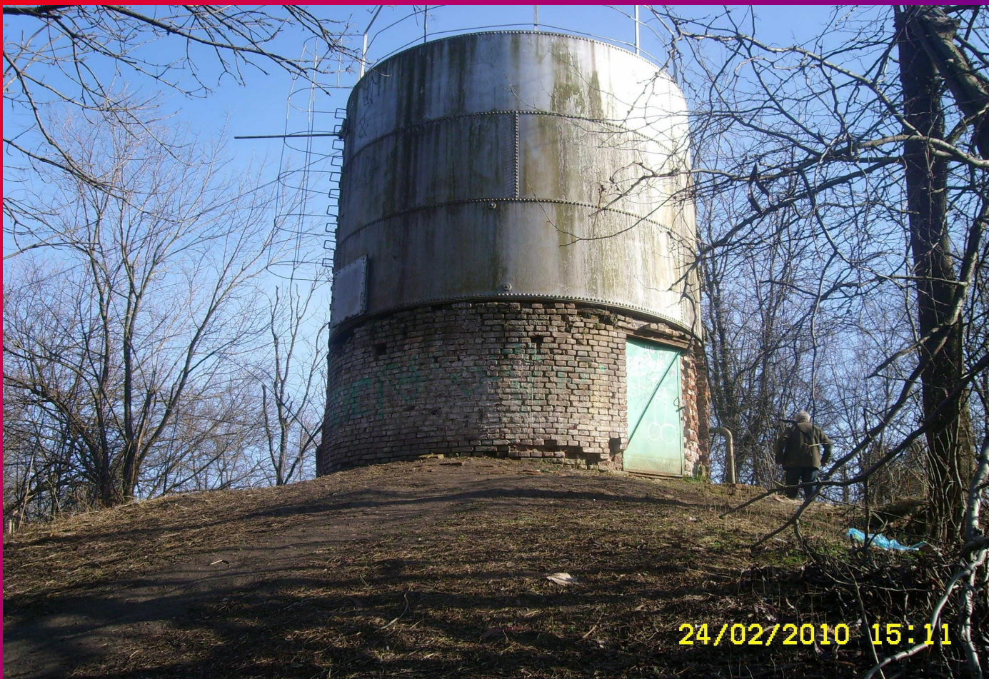
Водонапорная башня .