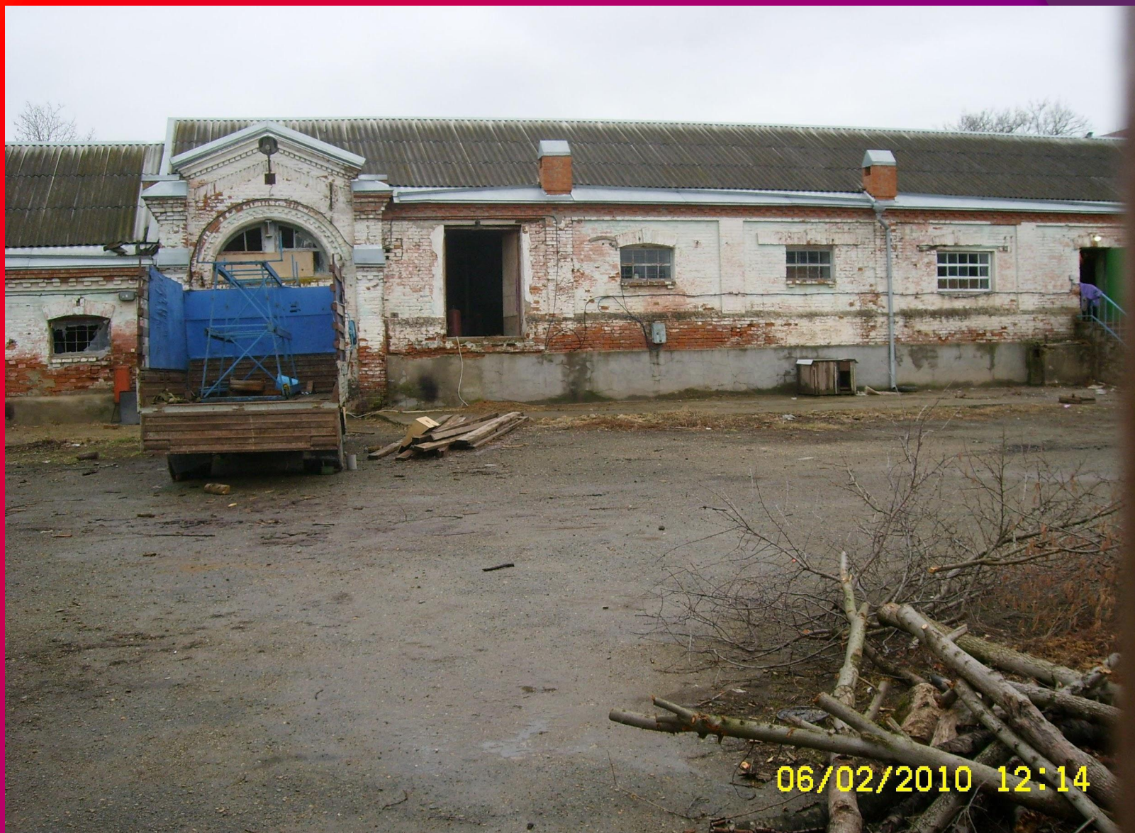
Бароновские подвалы используются до сих пор.