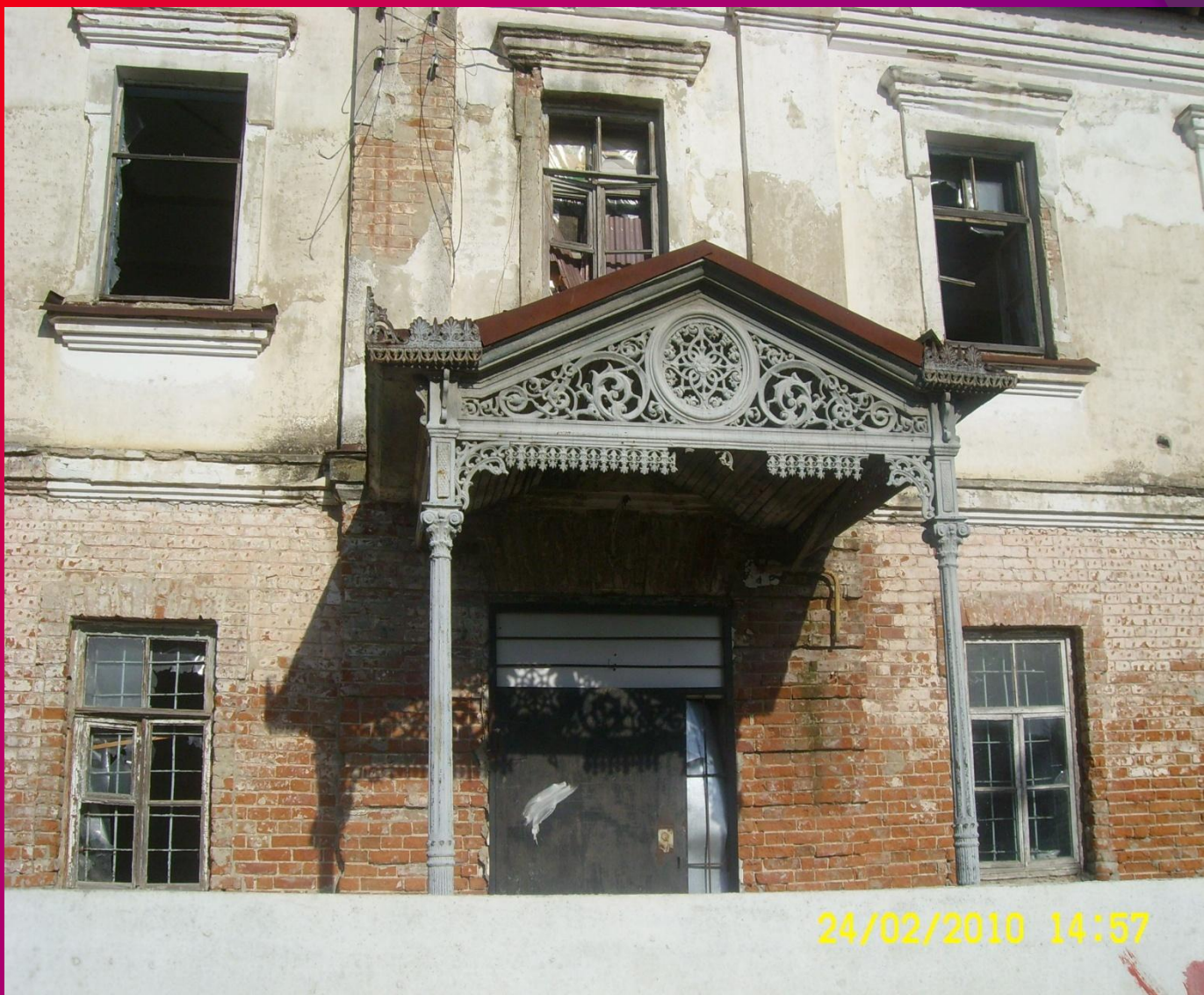
Один из домов барона.