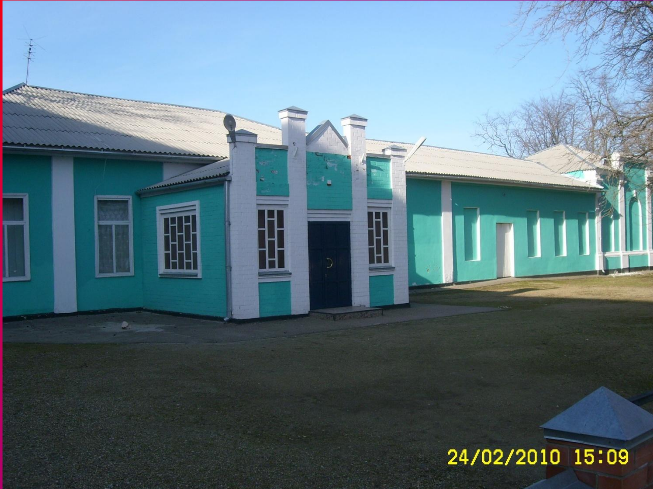
Здание клуба совхоза «Хуторок».