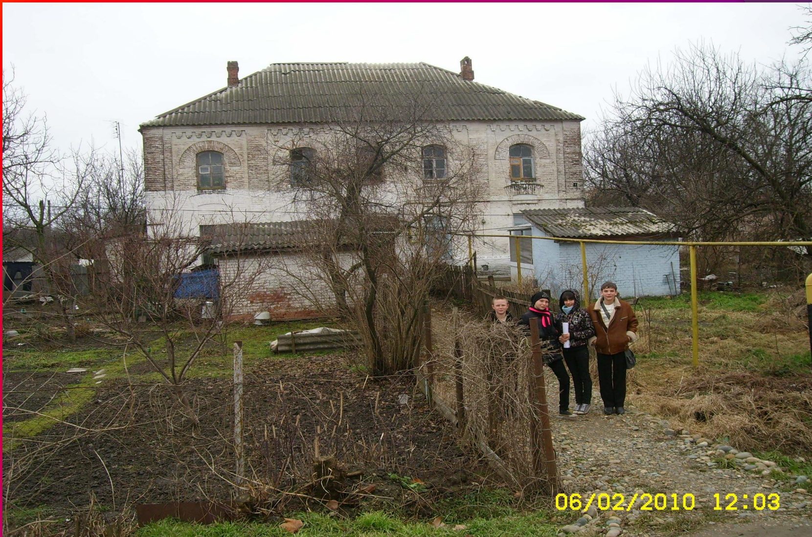
Обветшалый жилой дом по улице Ленина.