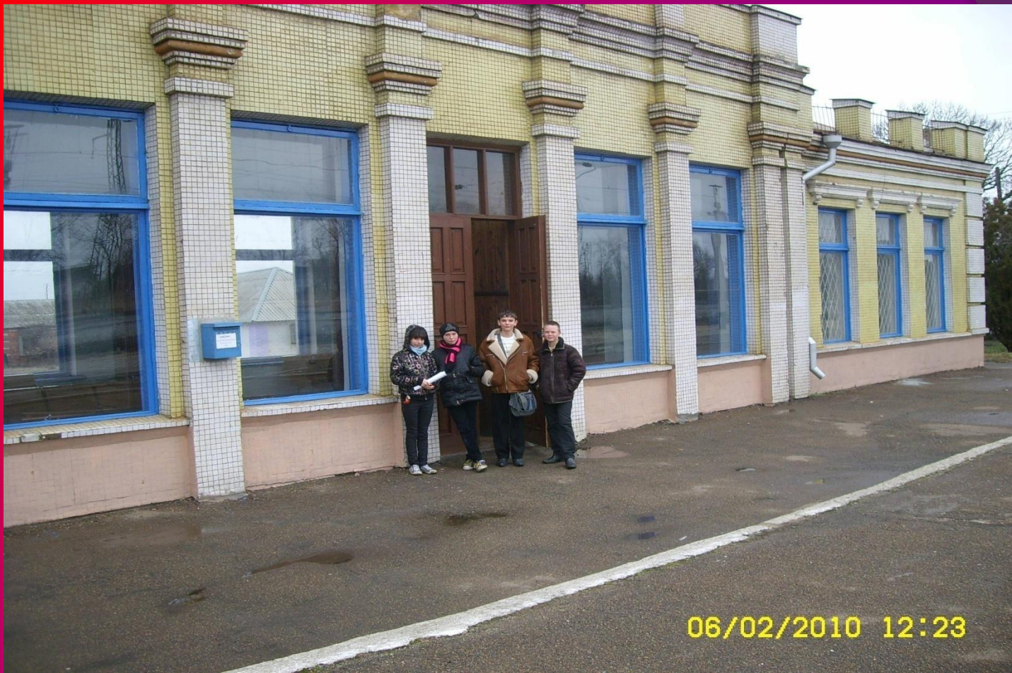
Здание Кубанской станции построено также бароном Штенгелем.