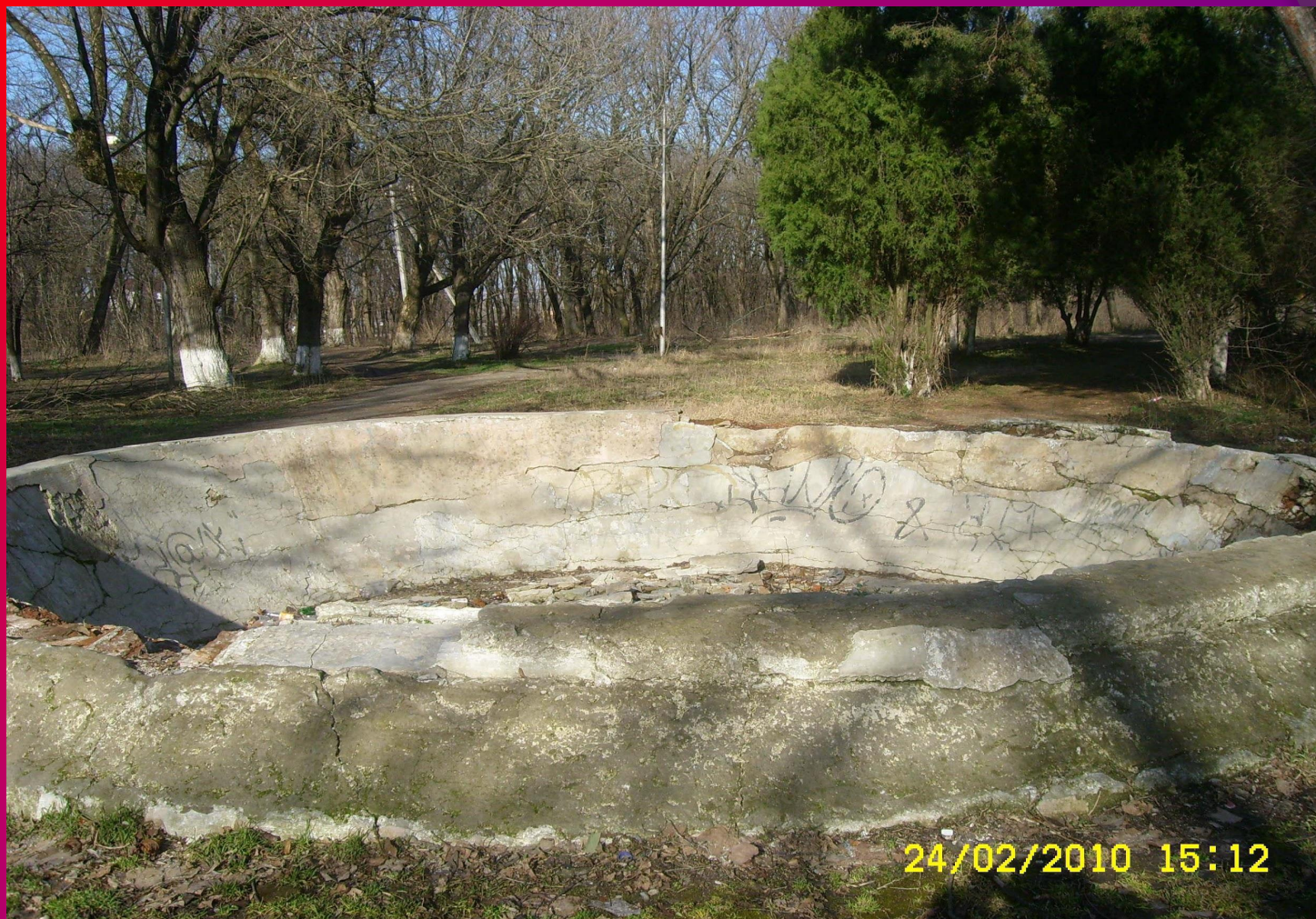
Останки бароновского фонтана.