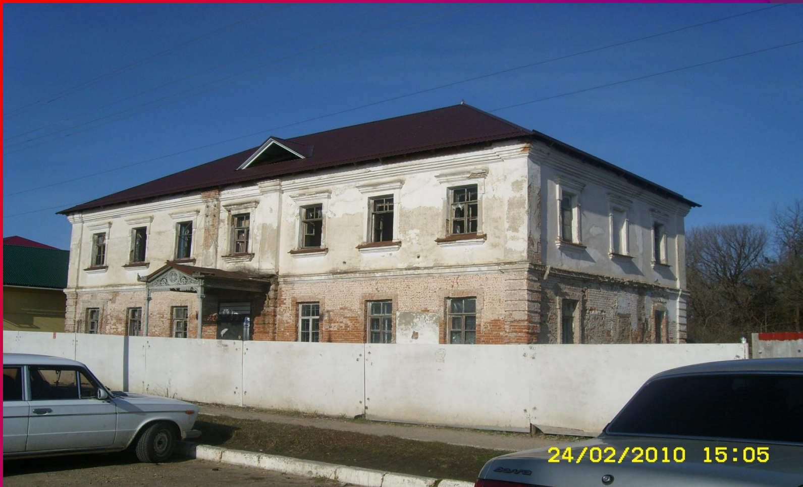
Общий вид здания.