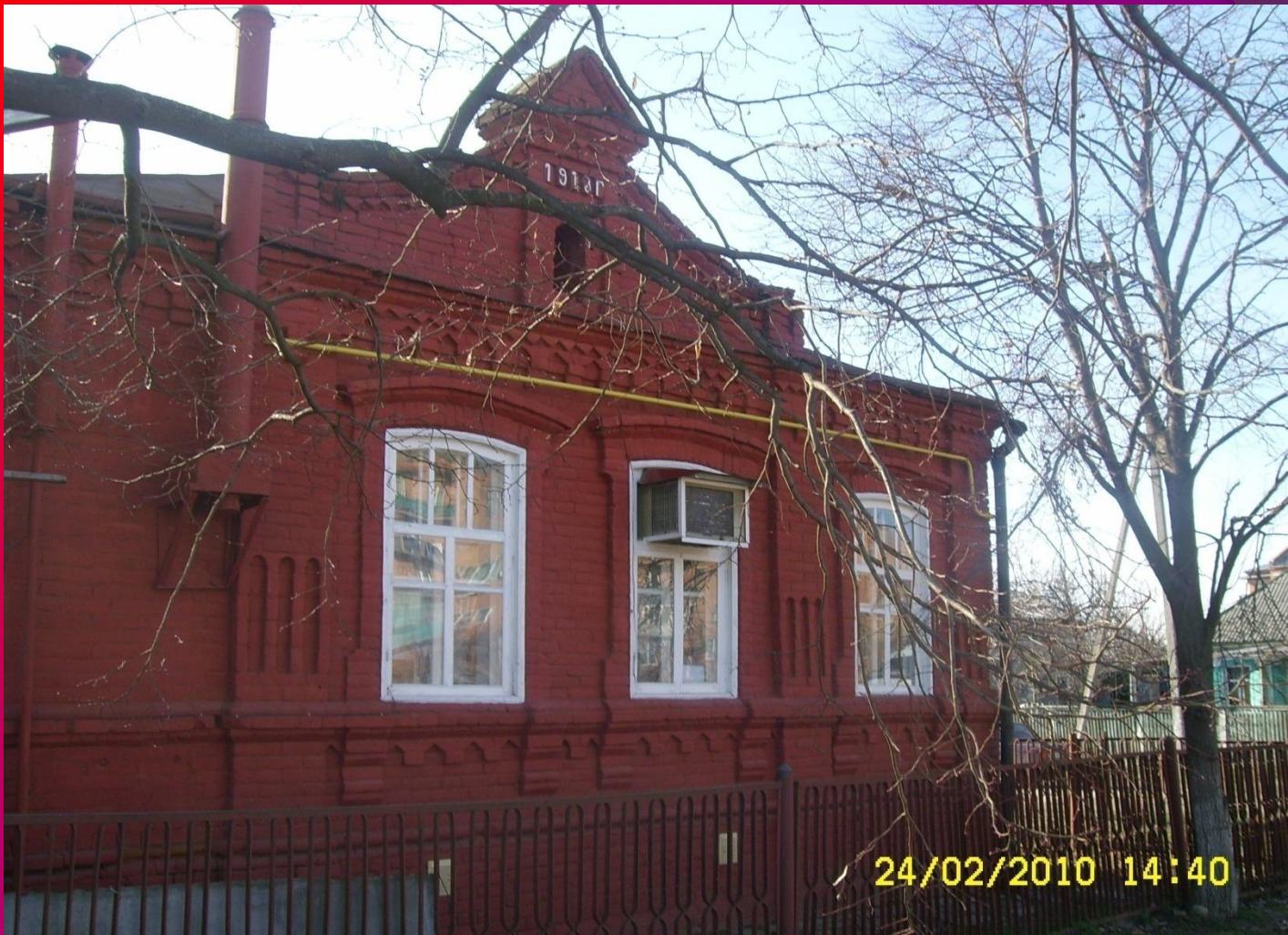
Дом помещика Николенко.