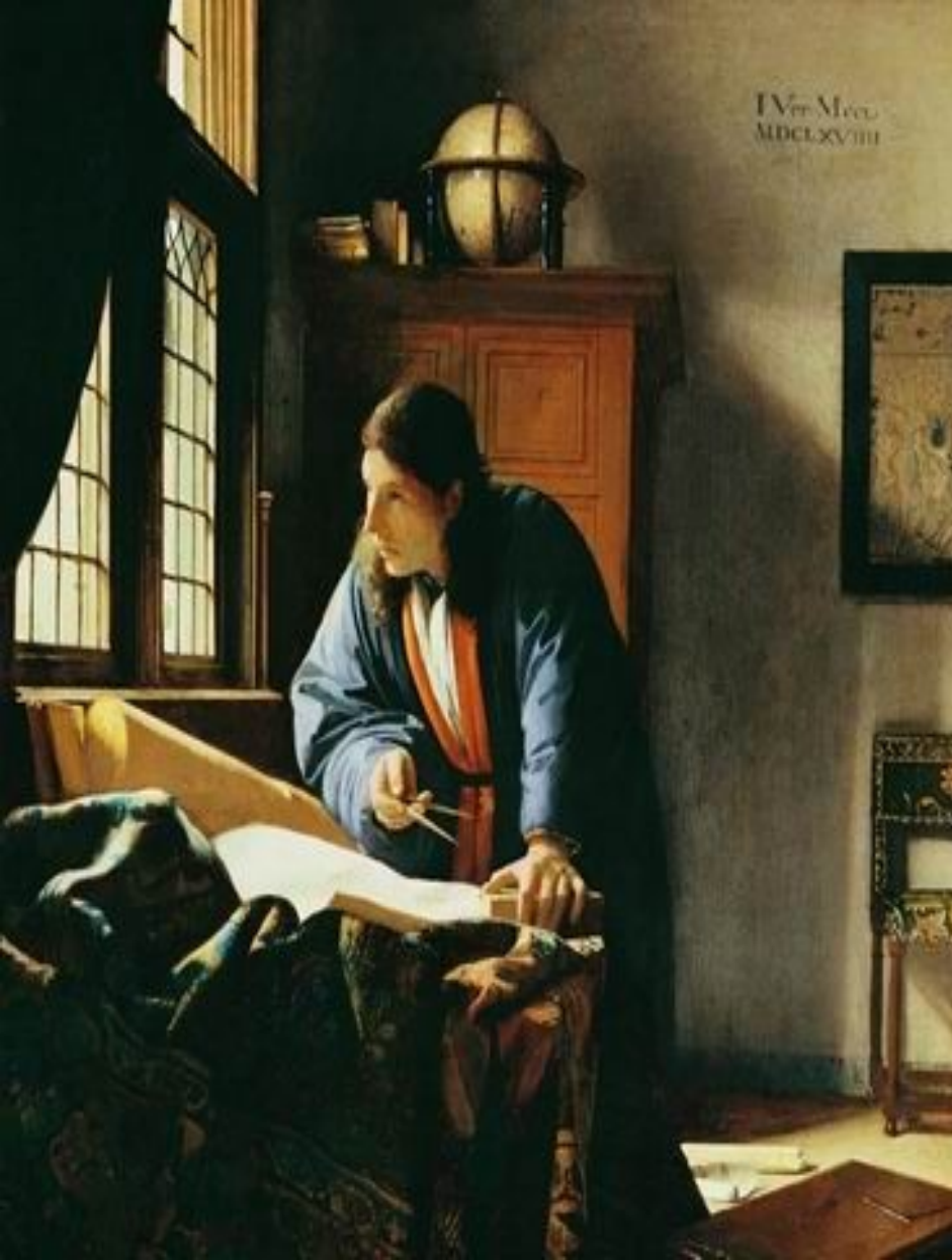
Географ. Ок. 1668—1669