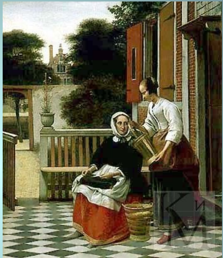
Питер де Хох. «Хозяйка и служанка» (около 1660, Эрмитаж). Голландские живописцы, в том числе и Питер де Хох, в своих картинах стремились воссоздать атмосферу скромного бюргерского быта.