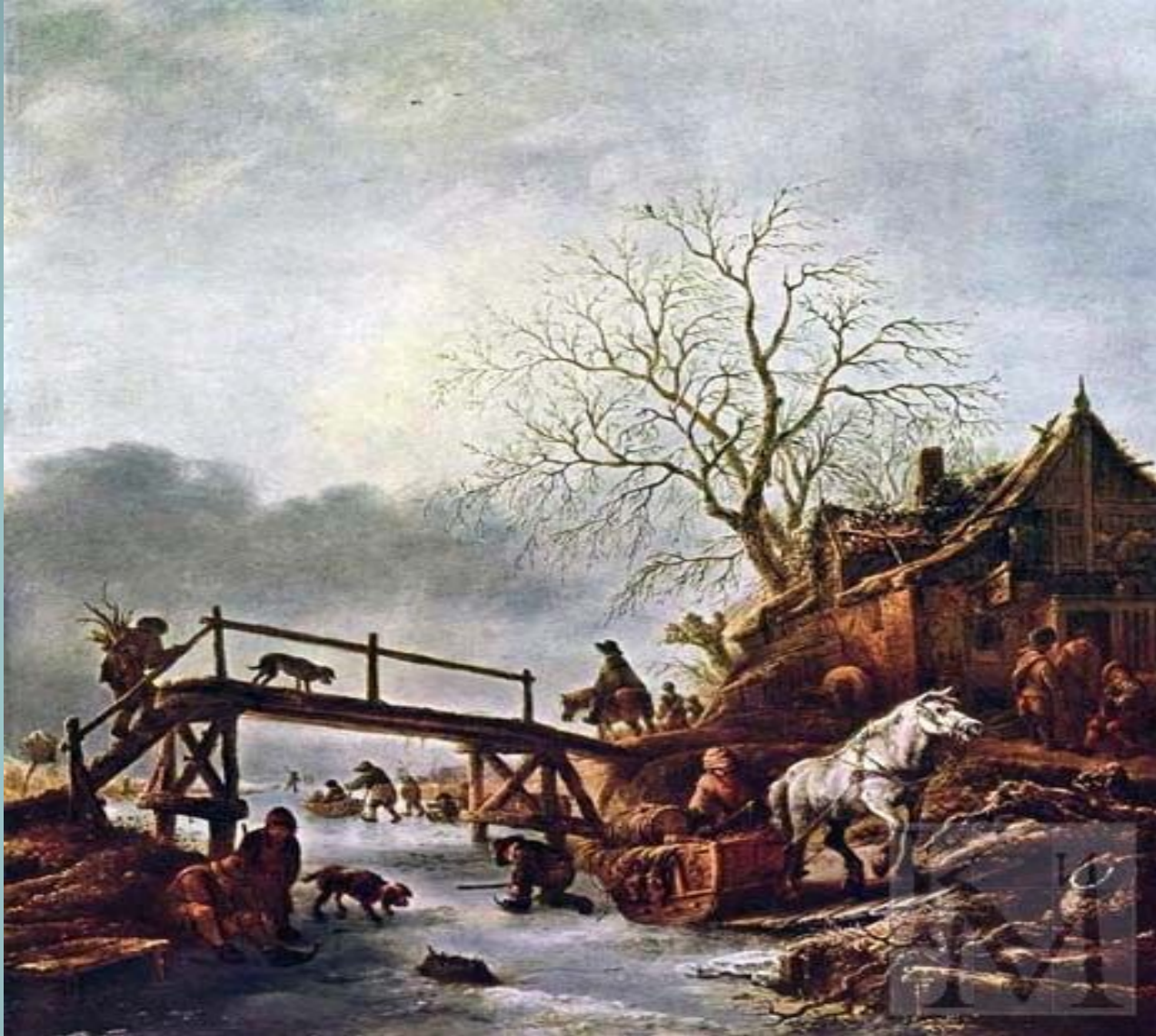
ОСТАДЕ Исаак (Постоялый двор на замерзшей реке)

2) Исаак ван Остаде (1621-49), брат и ученик Адриана ван Остаде. Жанровые сцены на открытом воздухе, зимние пейзажи («Замерзшее озеро», 1642).