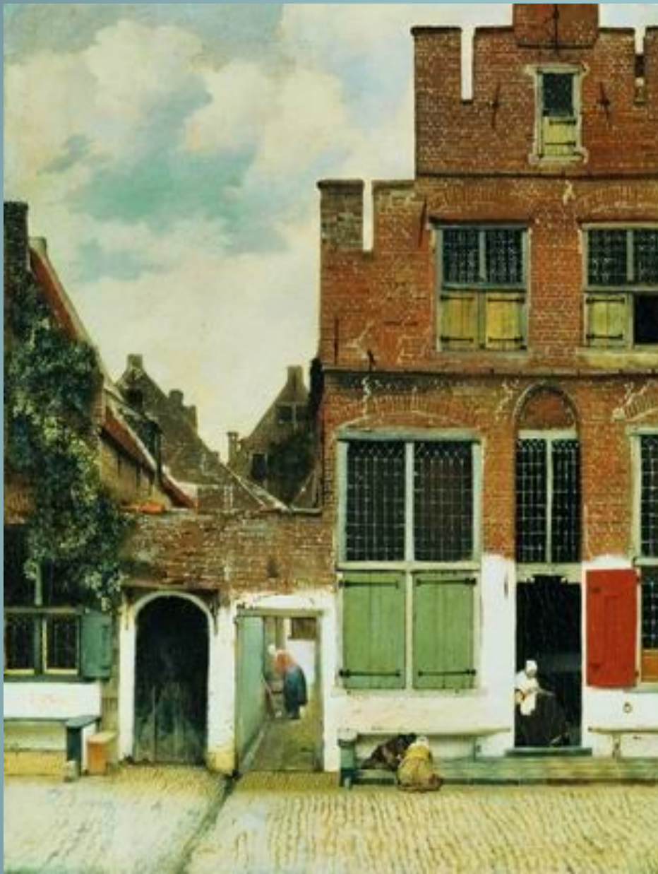
Улочка. Ок. 1657—1658

Если бы Вермер написал только два пейзажа «Улочка» (ок. 1657—1658, Амстердам, Рейксмузеум) и «Вид Делфта» (ок. 1660—1661, Гаага, Маурицхейс), то он уже вошел бы в число великих европейских живописцев. В Улочке изображен частный мотив, возможно, художник увековечил свой собственный дом. Летний пасмурный день. Фасад здания из красного кирпича с побелкой в нижнем этаже и зелеными ставнями занимает правую часть композиции, слева открывающийся проход создает впечатление пространственной глубины. Весомость архитектуры подчеркивает движение проносящихся облаков.