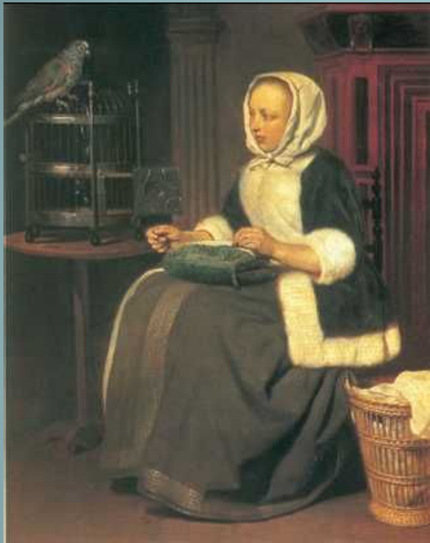
Г. Метсю. «Девушка за работой». Государственный музей изобразительных искусств им. А. С. Пушкина Москва.