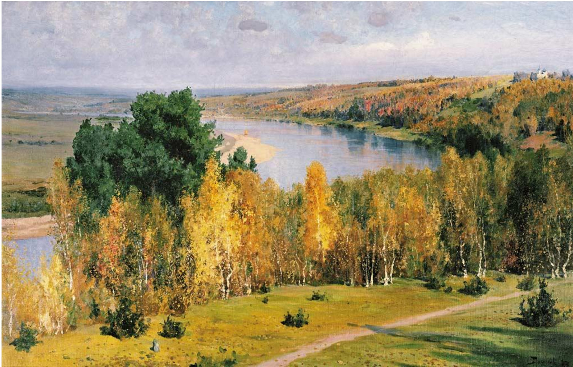
Поленов. Золотая осень