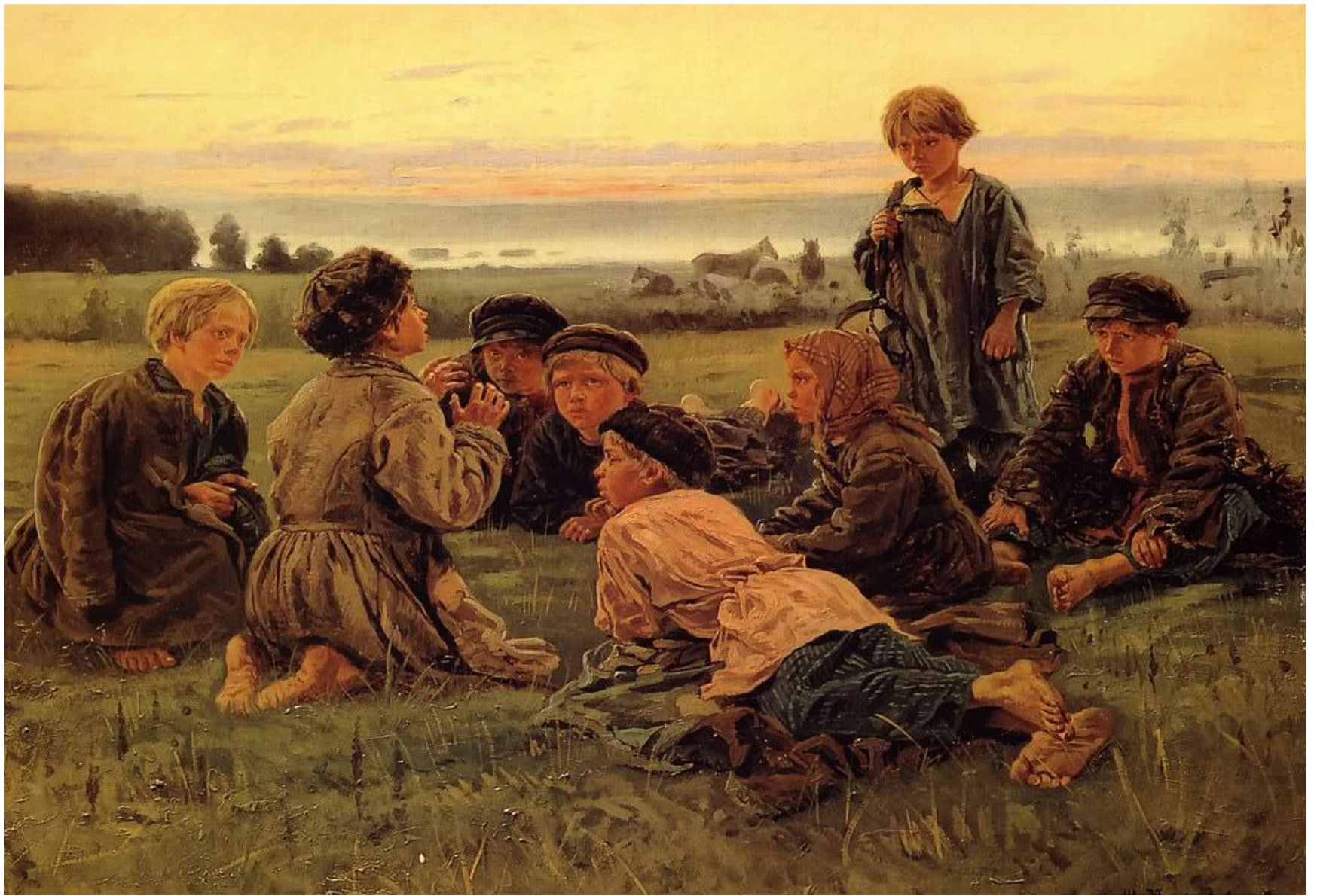
Маковский. Крестьянские мальчики в ночном стерегут лошадей