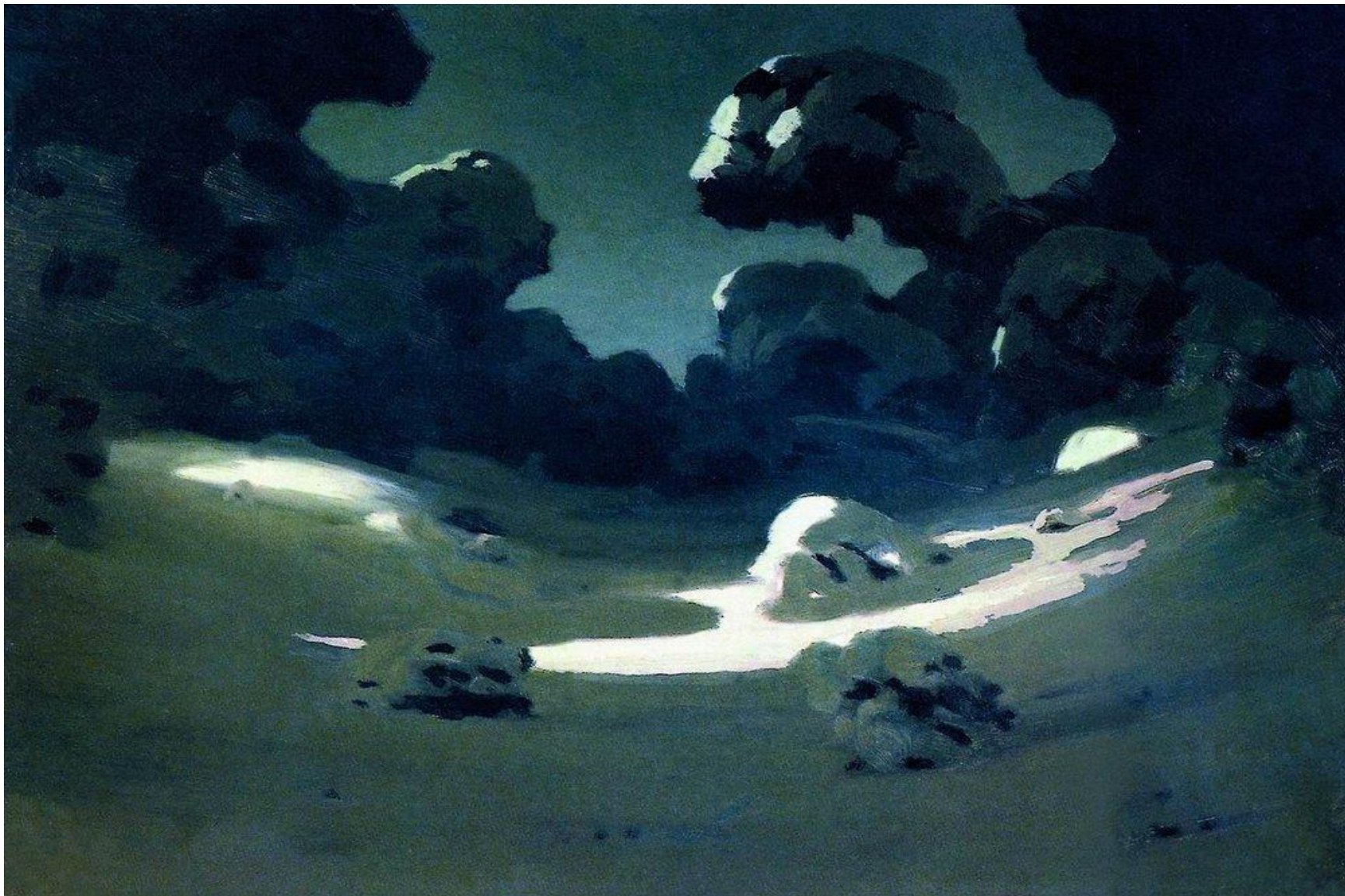
Куинджи. Пятна лунного света . Зима