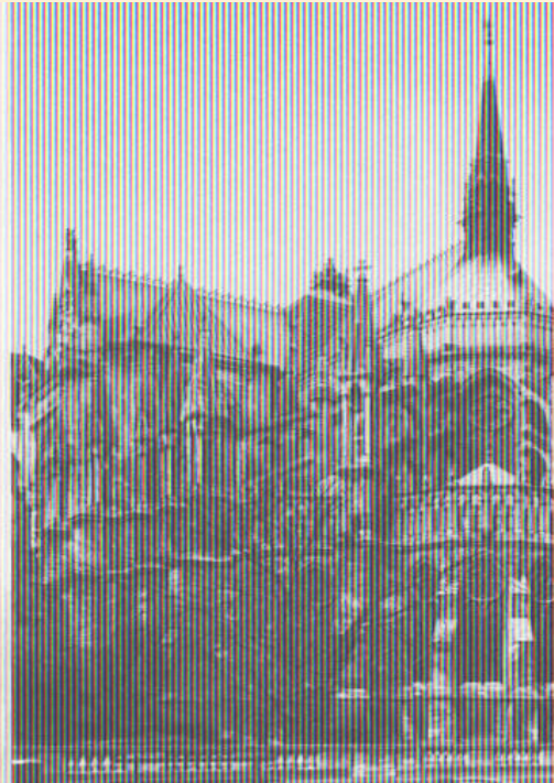
Собор в Реймсе

Готический стиль в основном проявился в архитектуре храмов, соборов, церквей, монастырей. Для готики характерны арки с заострённым верхом, узкие и высокие башни и колонны, богато украшенный фасад с резными деталями (вымперги, тимпаны, архивольты) и многоцветные витражные стрельчатые окна. Все элементы стиля подчёркивают вертикаль.