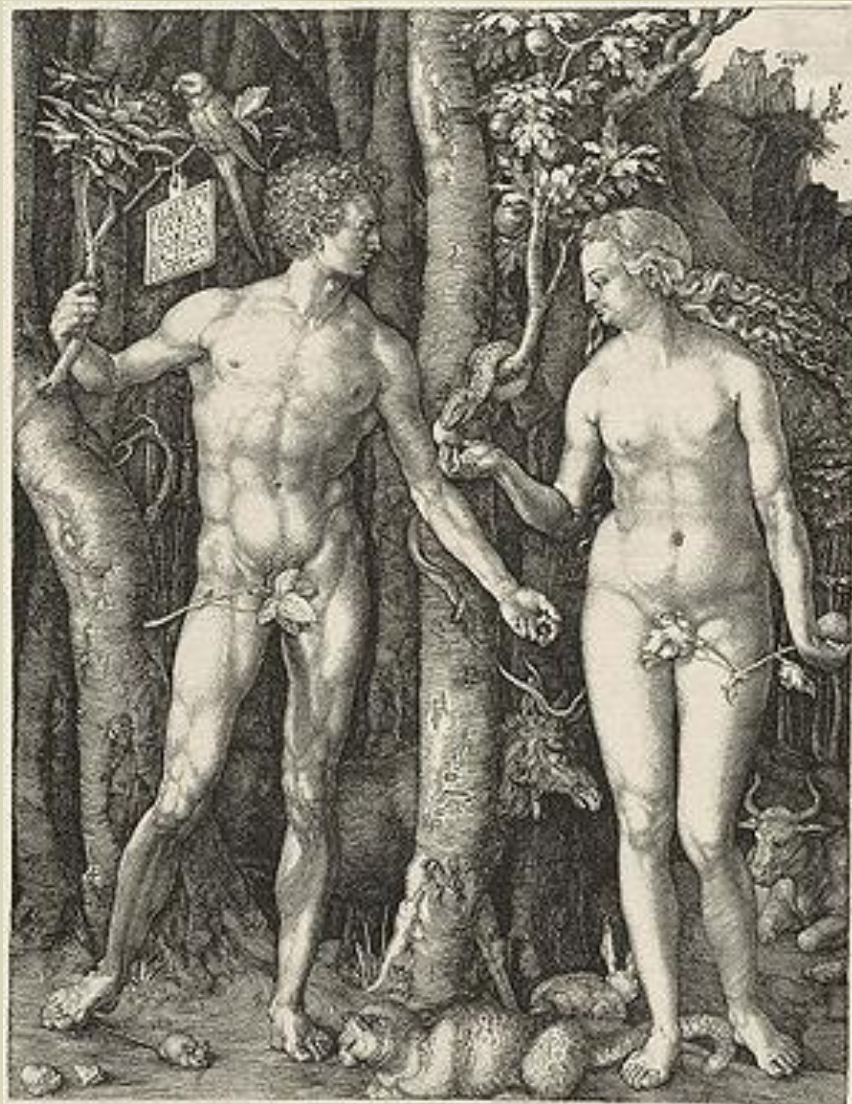
гравюра на меди