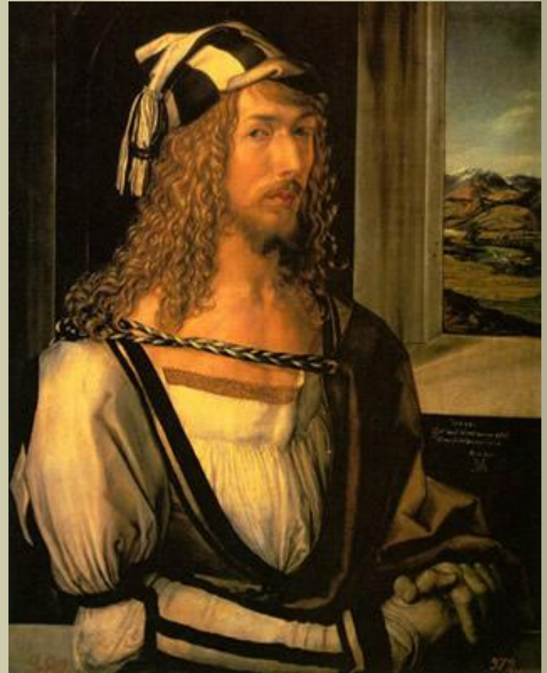
АВТОПОРТРЕТ, ПРАДО, 1498

Альбрехт Дюрер (1471–1528) – немецкий художник, гравер и теоретик. Это был самый влиятельный художник немецкой школы.