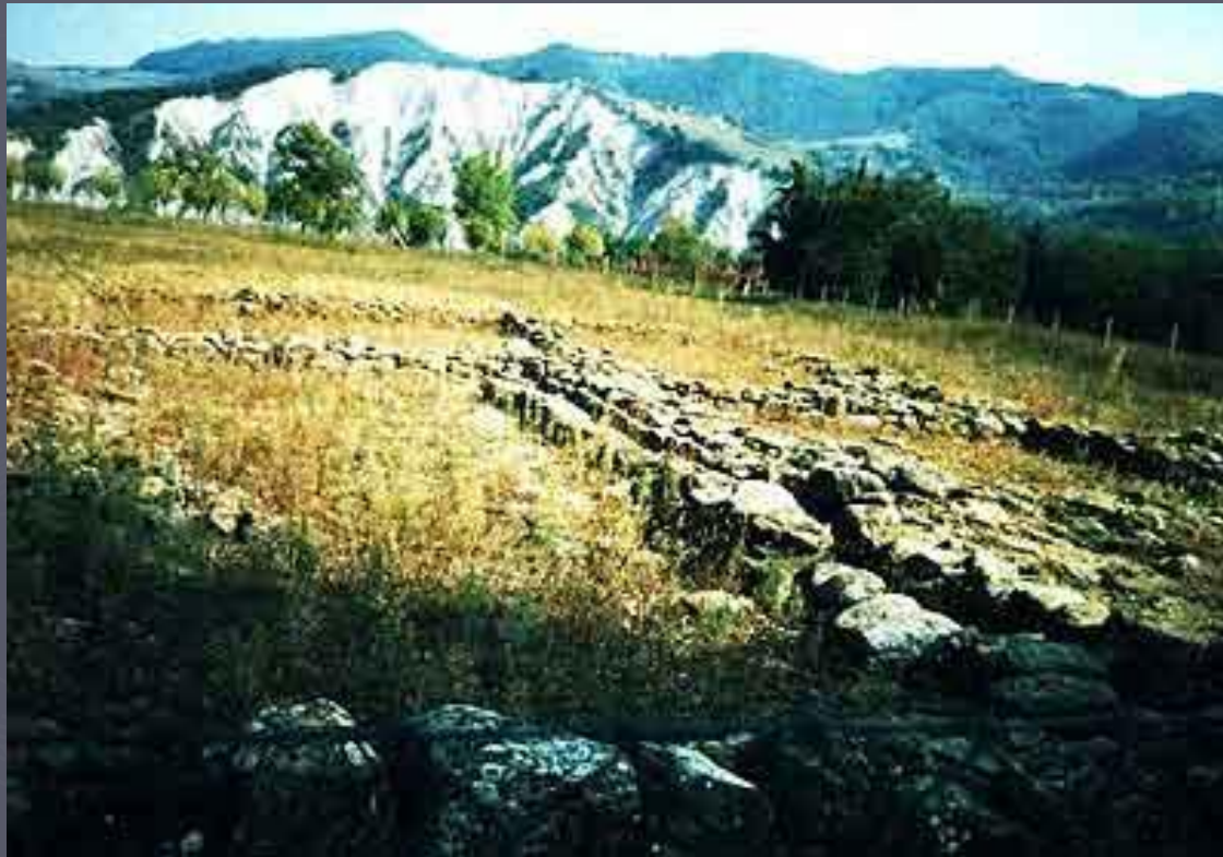
Марцаботто. Общий вид.

Одними из наиболее исследованных северных городов являются порт Спина на Адриатике и колония Марцаботто, контролировавшая торговый путь с севера на юг через Апеннины, связывавший Этрурию с Болоньей и долиной р. По. Марцаботто был основан в VI в до н.э., но формально его становление произошло в следующем столетии. Планировка города была удивительно регулярной.