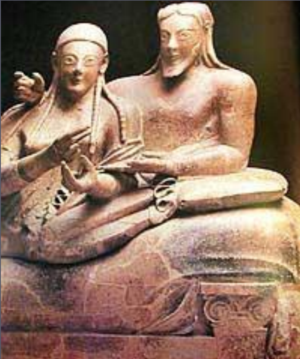
Этруски. Надгробие саркофага. Черветери.

Широко известно искусство этрусских саркофагов , которые украшались скульптурными изображениями умерших.