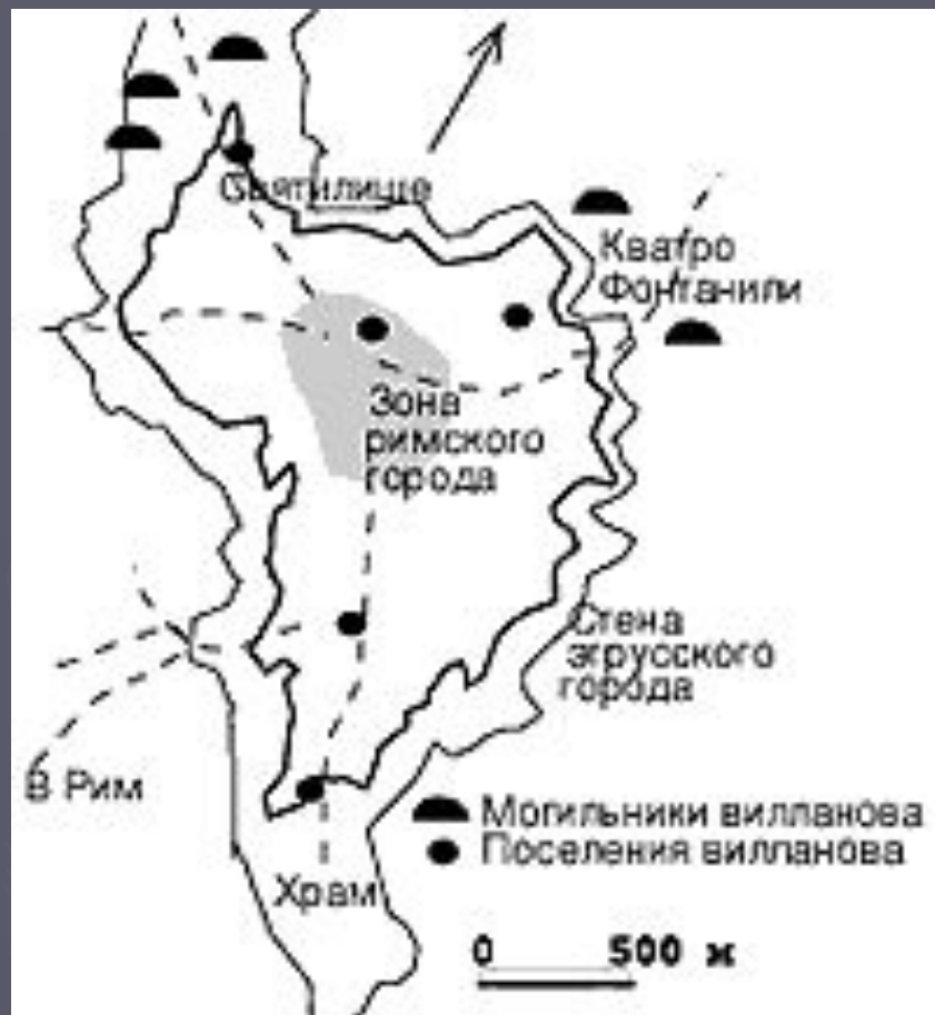
Схема расположения памятников в окрестностях г. Вей

На примере уже упоминаемого комплекса Вей , можно видеть, что города формировались из скопления маленьких деревень и кладбищ в рамках естественно укрепленных участков возвышенных плато. Однако примерно до VII или VI в. до н.э. в их планировке отсутствовала какая-либо регулярность. Позже – около V в. до н.э. – такие агломерации начали расширяться за счет включения новых земель и обноситься массивными каменными стенами. Внутренняя планировка имела уличный характер. В центре строились общественные и религиозные здания. Вне Этрурии – в долине р. По, занятой этрусками в период между VI и IV вв. до н.э., города имели несколько другой вид, развиваясь по заранее выработанному строгому плану.