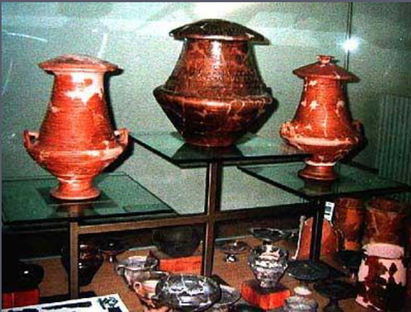
Керамика Марцаботто. Археологический музей

Город был расположен на естественно укрепленном возвышенном холме. Часть площади использовалась для производственных целей: обработки металла и изготовления керамики .