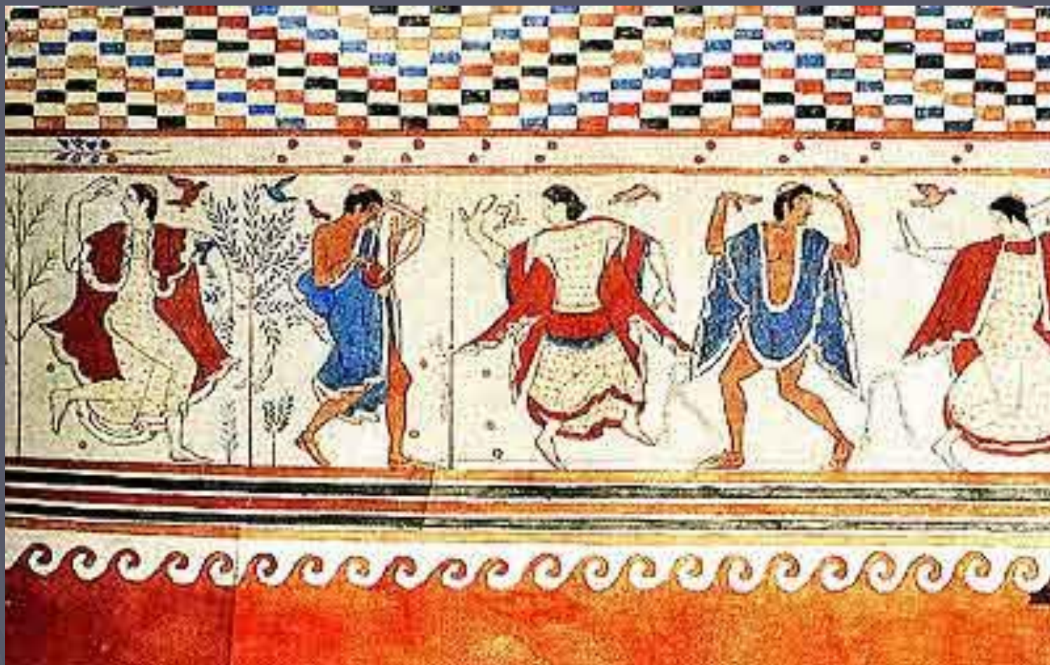
Этруски. Тарквиния. Томба делла Триклинио. (Steingraber 2000, p.15)

. Далее на север предпочитали строить наземные погребальные усыпальницы, в Тарквинии – в прибрежной зоне – широко известны богатые могильные склепы с расписанными стенами , на которых изображались сцены охоты , спортивные состязания или фестивали, по которым можно судить о жизнерадостном характере этрусков.