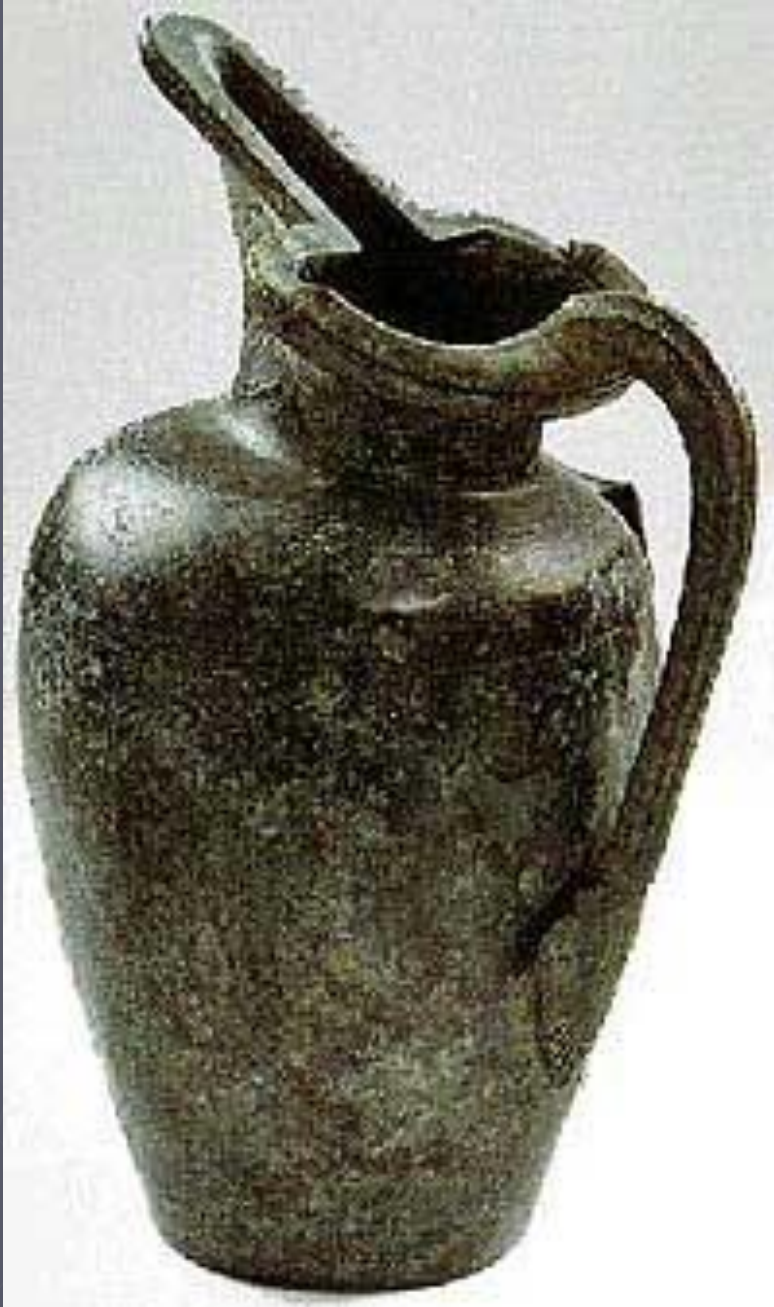
Сосуд из Безансона. 350 г. до н.э.

Многие предметы импортировались в Этрурию из стран Ближнего Востока и Африки через греческую или финикийскую торговые сети. Было очень распространено подражание греческой керамике геометрического стиля. Местное металлургическое производство достигло довольно высокого уровня развития, в нем стали употребляться новые технологические приемы, например, филигрань и зернь. Появилось много богато украшенных бронзовых сосудов, подобных широко распространенным к северу от Альп кувшинам с клювовидным сливом .