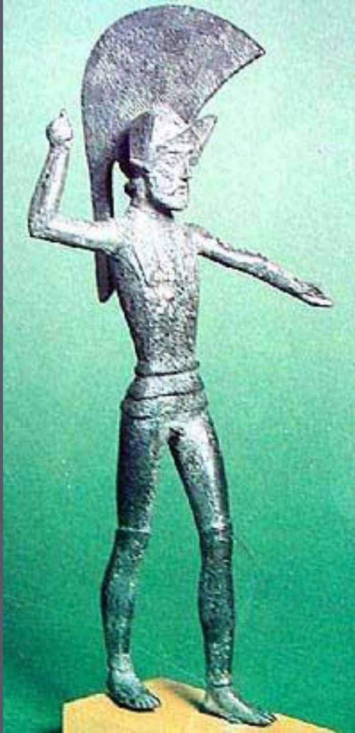
Бронзовая статуэтка этрuscoго воина из Умбрии. Италия. V в. до н.э. Ашмолиан музей. Оксфорд