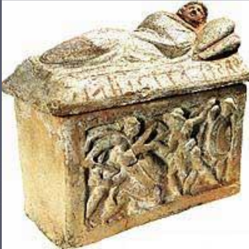
Этруски. Погребальная терракотовая урна. (Steingraber 2000, p.24)

В классический период этруски хоронили не только в гробницах, устроенных в скале или склоне реки, но и в ямах, ставя поверх них надгробные плиты или скульптуры .