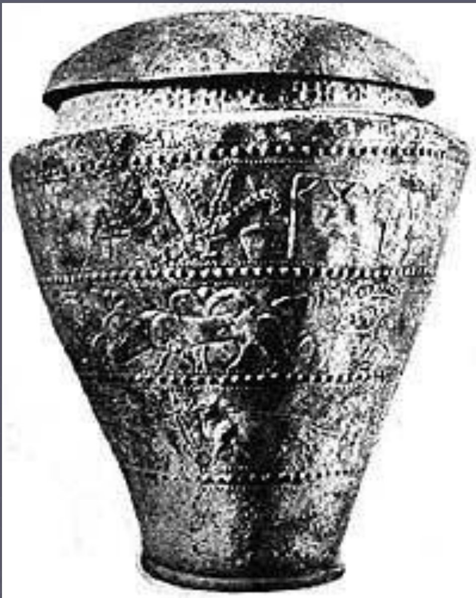
Ситула Бенвенути. VI в. до н.э. (по А.Л. Монгайту 1974, с.154)