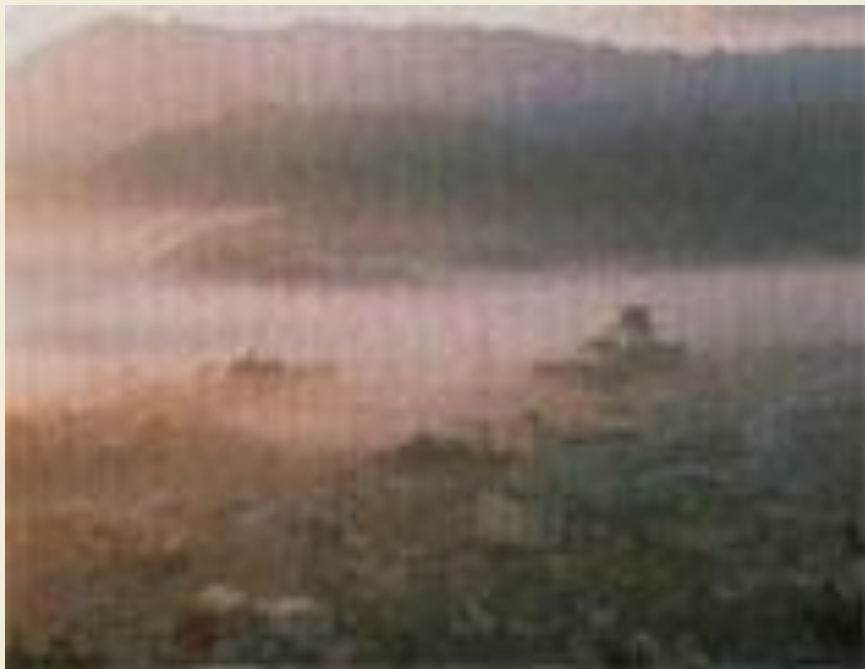
Курорт с горячими источниками Цикуока