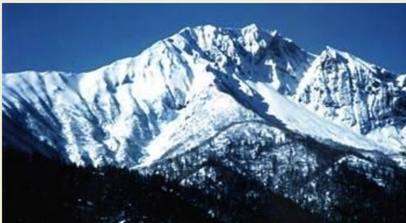
Восточный склон горы Нипесотсу