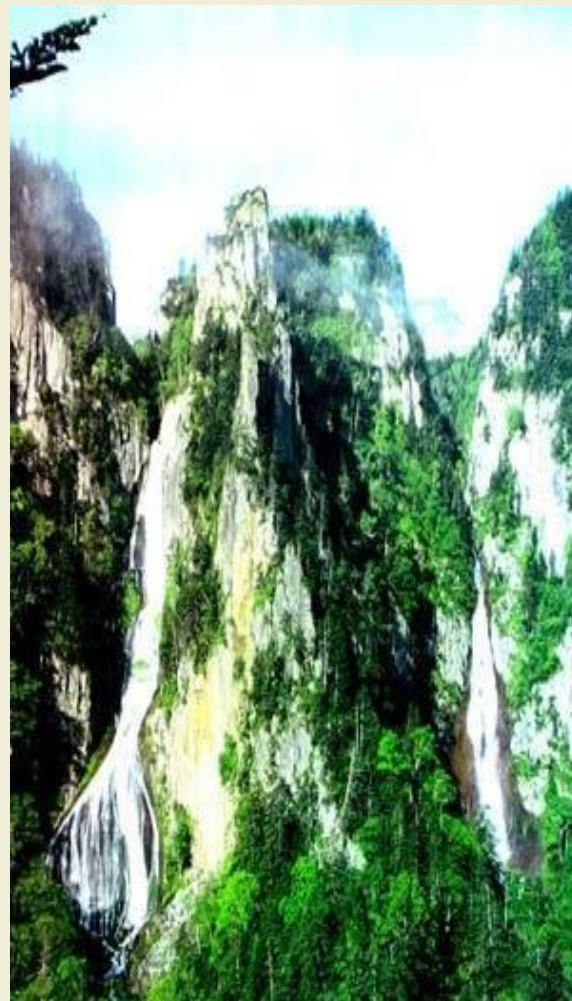
Водопад Гинга Рюзей