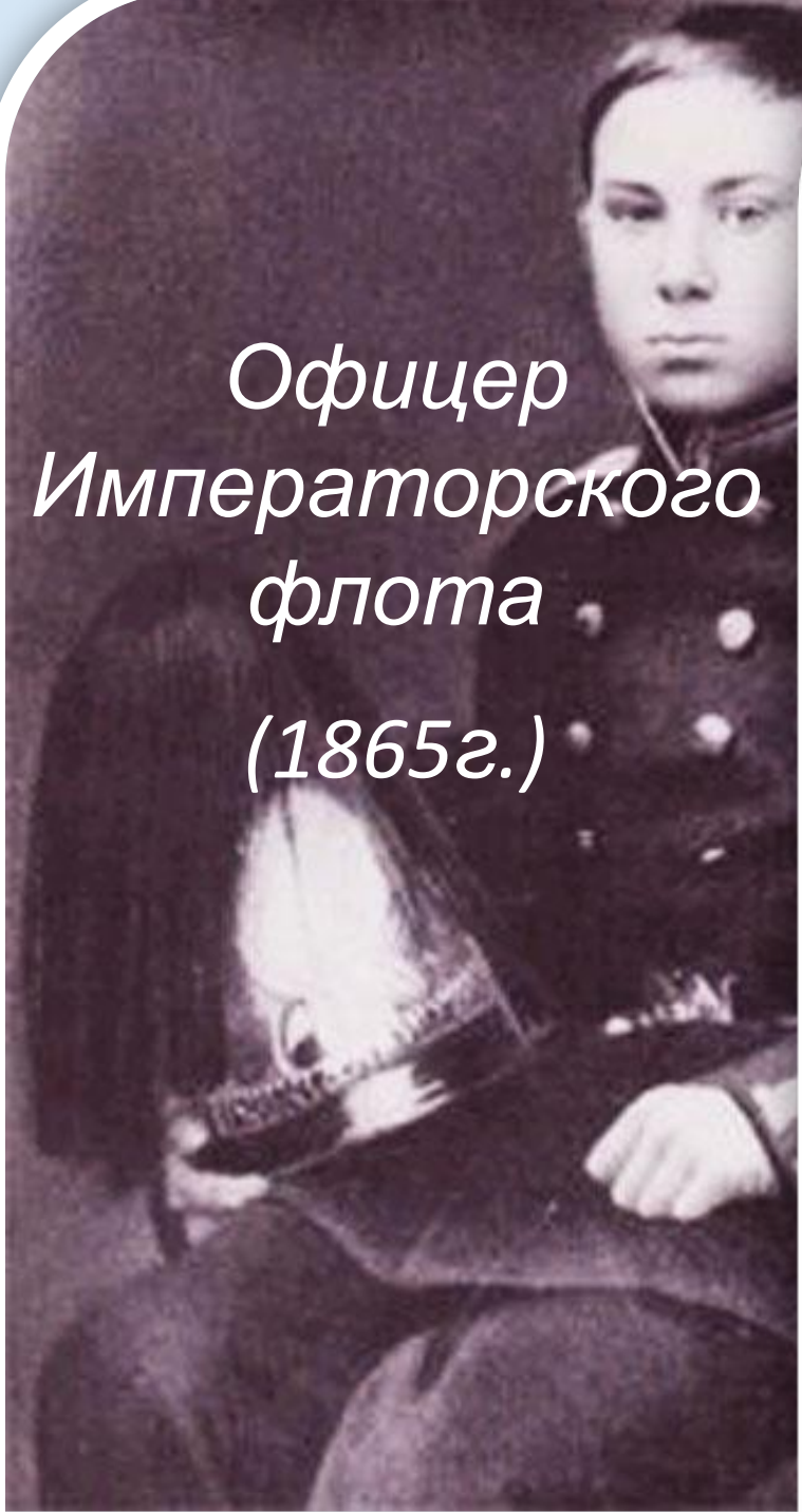
Офицер Императорского флота (1865г.)