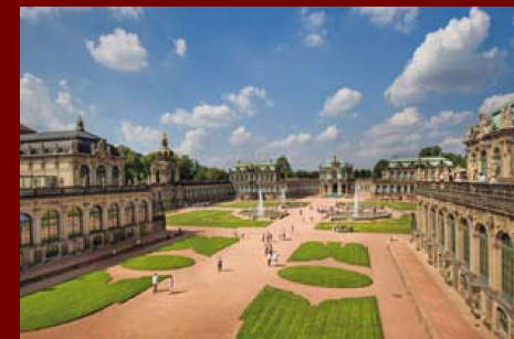
картинная галерея Дрезден, Германия