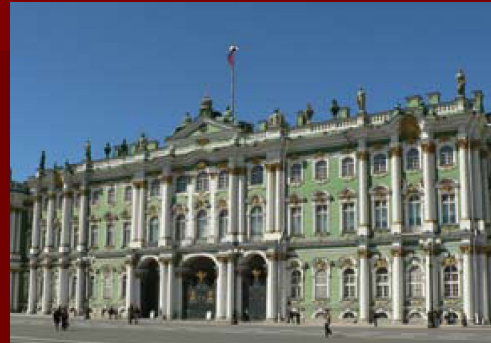
Эрмита́ж в Санкт-Петербурге