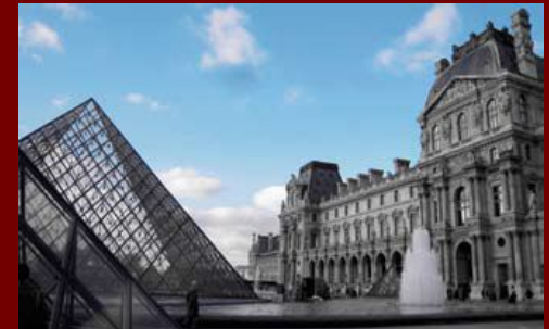
Лувр, Париж, Франция