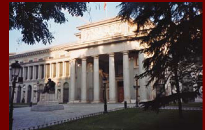
Прадо, Мадрид, Испания