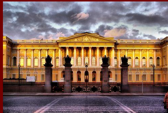
Русский музей в Санкт-Петербурге