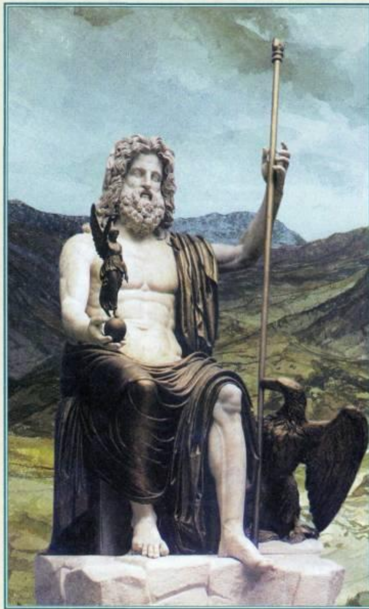
Зевс, держащий в руке богиню победы Никю Античная статуя