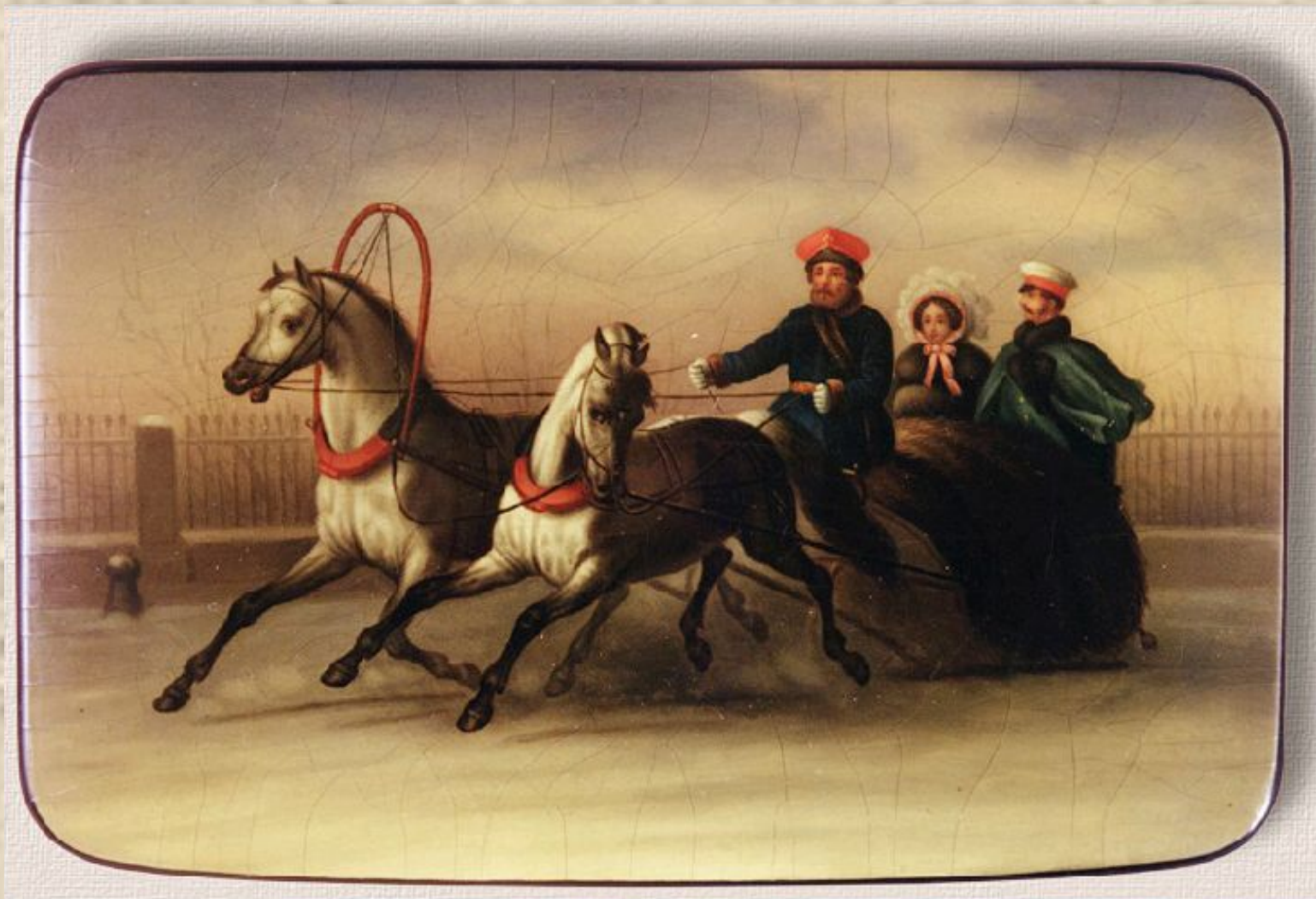
Федоскино. Коробочка «Императорская чета на зимней прогулке»