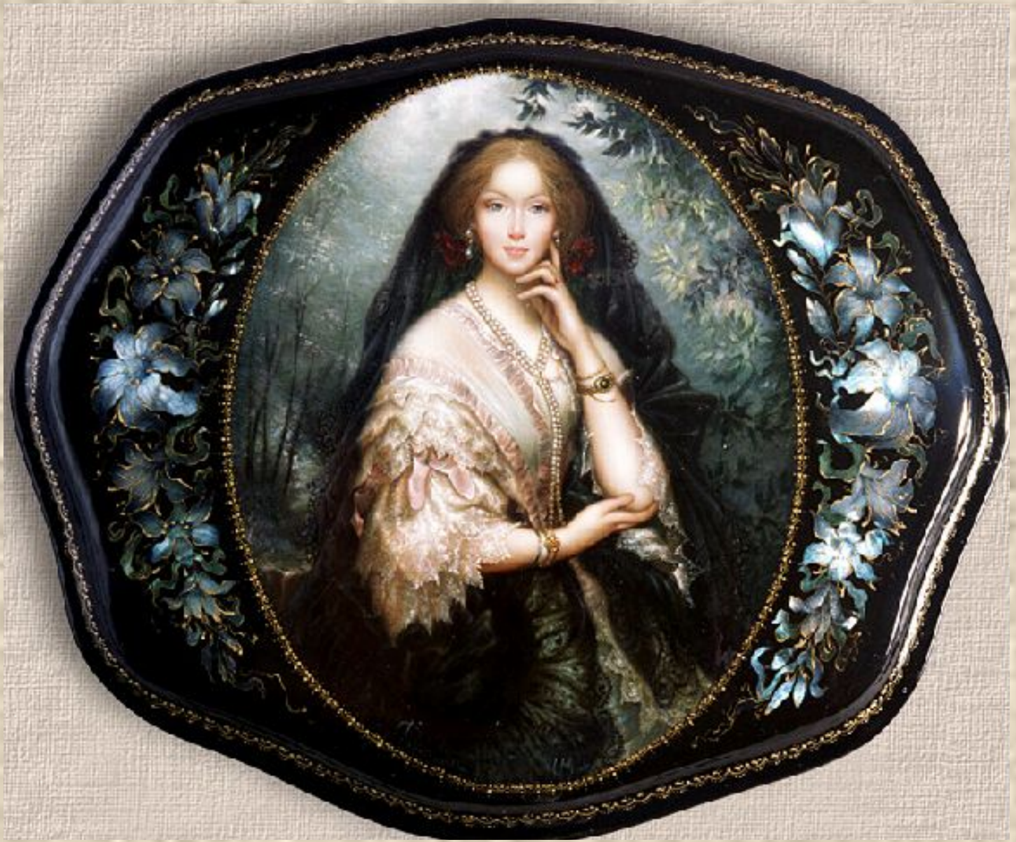
Федоскино. Шкатулка «Весна»