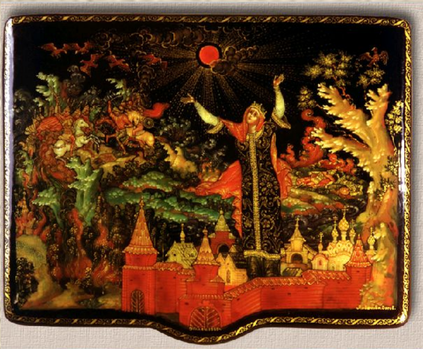
Палех. Табакерка «Плач Ярославны»