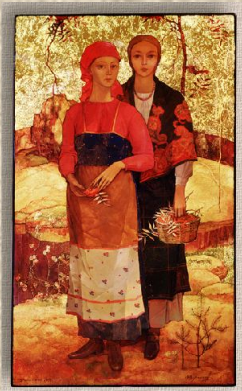
Федоскино. Коробочка «Рябина красная»