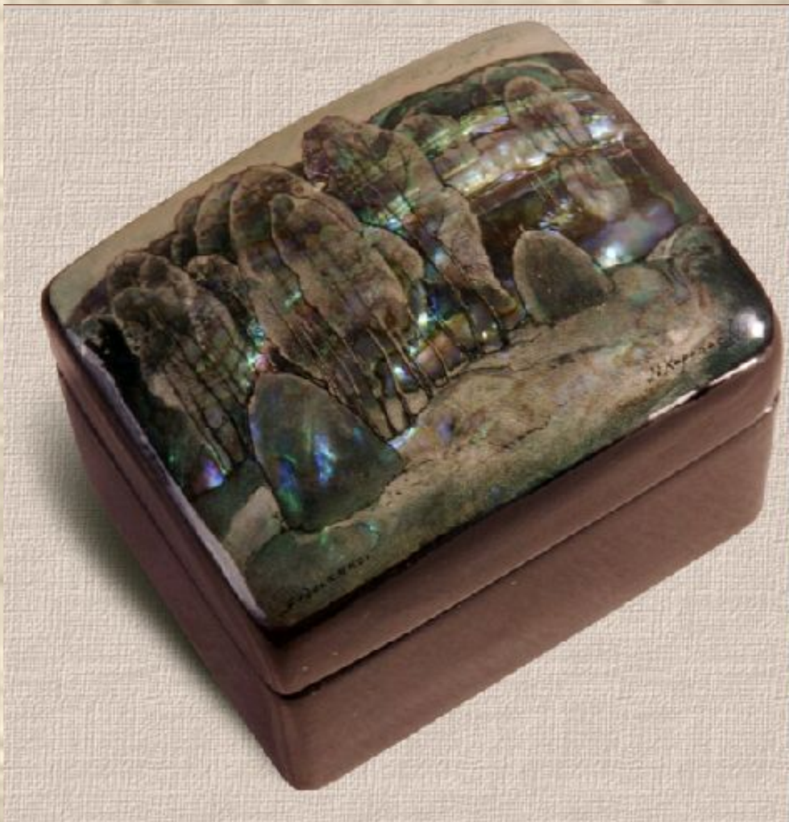
Федоскино. Коробочка «Роща»