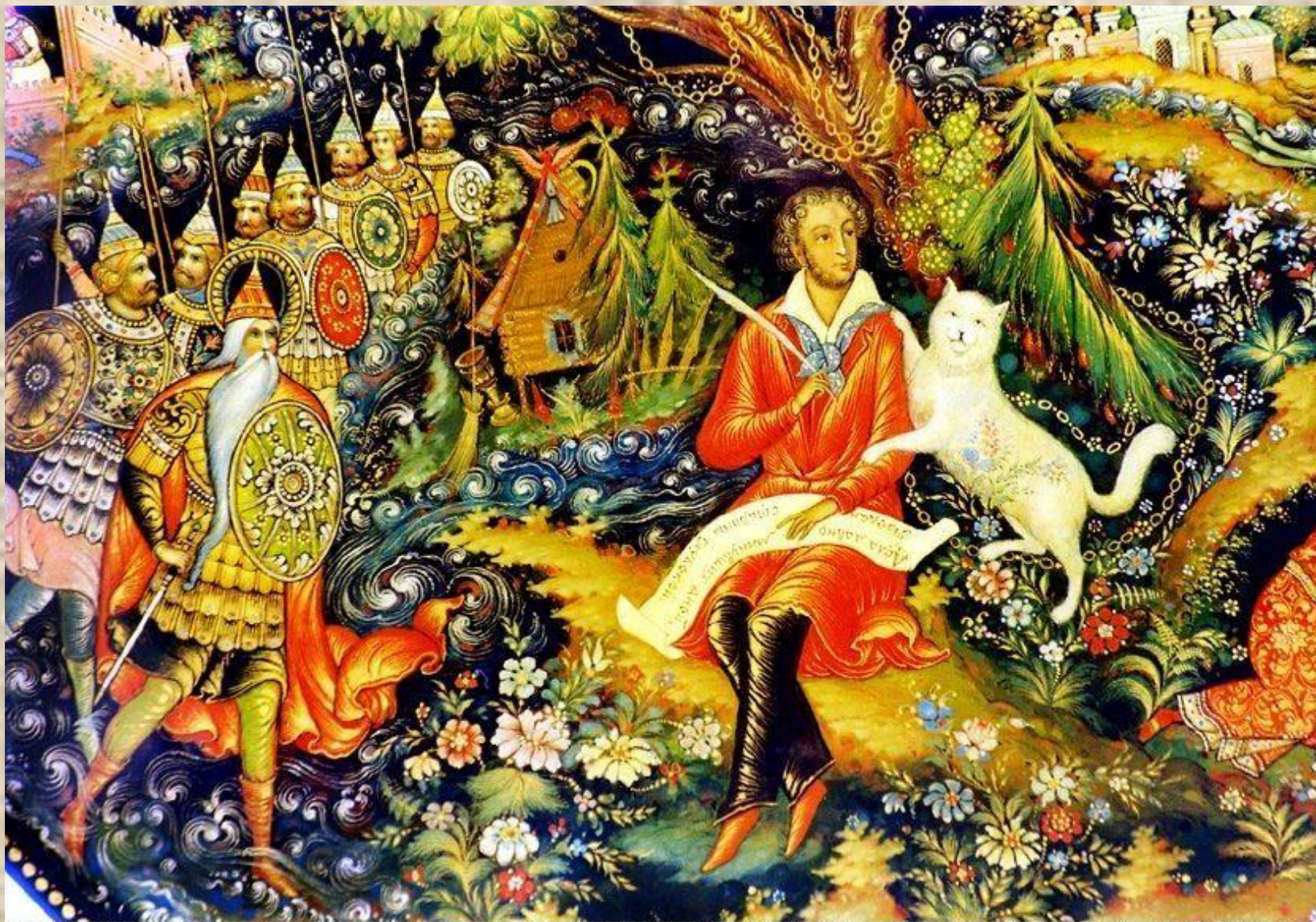
An original Russian Black Lacquer Plate painted by Bakalovii (husband & wife) of PALEKH, illustrating Pushkin's Tale "Lukomorye" - From the Elsner Col