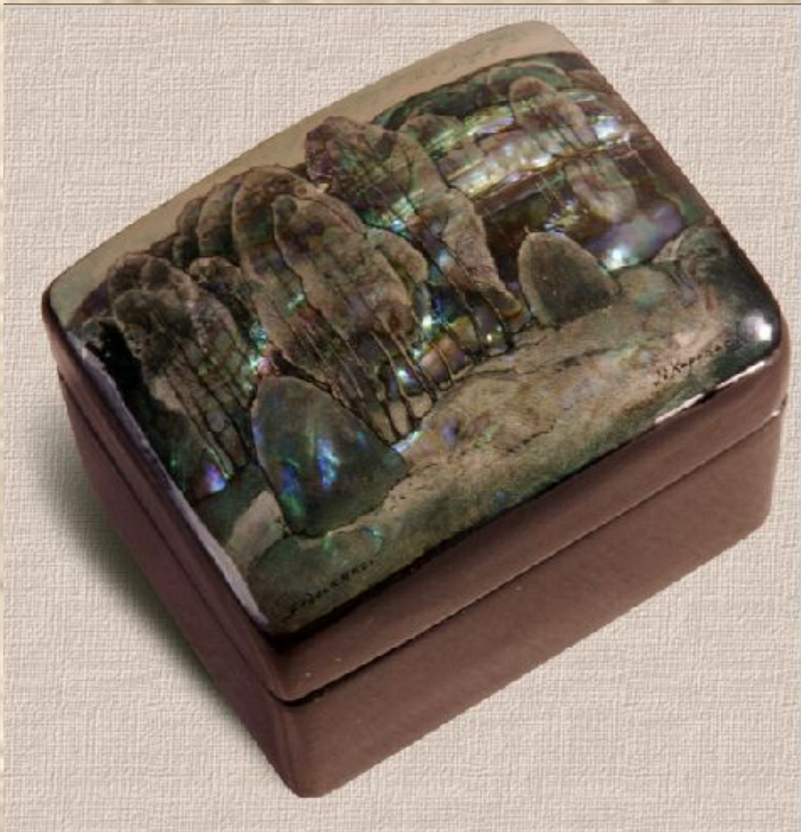
Федоскино. Коробочка «Роща»