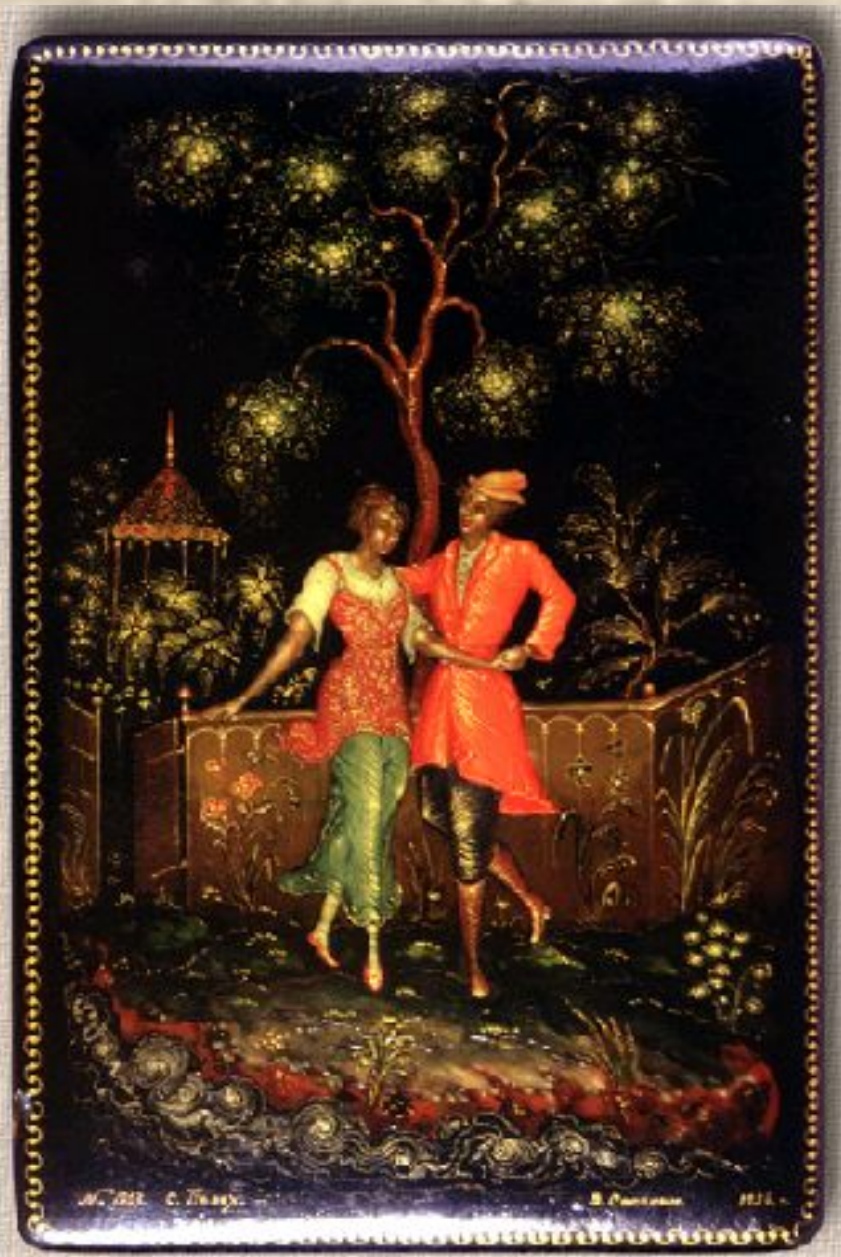
Палех. Шкатулка «Свидание»